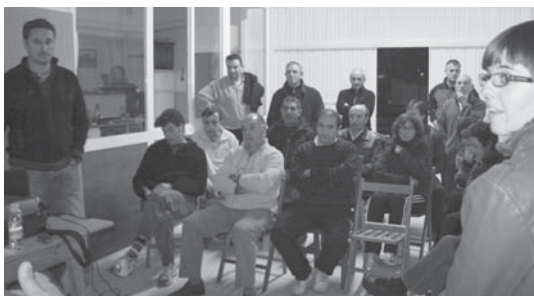
Zabaletako 20 bizilagun izan ziren konpostatze ikastaroan.

ruan, uztailean bildu ziren lehen aldiz auzoan konpostatzen hasi nahi dutenak eta irailaren bukaeran auzo elkarrekin gai hau jorratzeko.