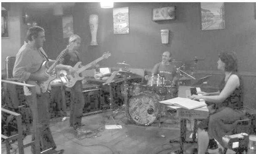
Boogaloo, Jazz-Funky, Blues edo Latin Jazz estiloak nahasten ditu The Boogalords taldeak.