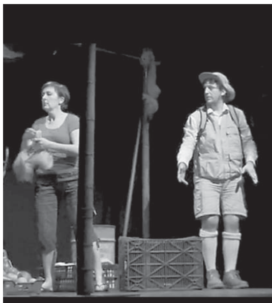
Akaziaren jokoa , antzerkia eta dantza garaikidea biltzen duen ikuskizun polita da.

Ikuskizunak bi saio izango ditu bata euskaraz eta bestea gazteleraz. Euskarazko saioa arratsaldeko 18:30an hasiko da; gaztelerazkoa, berriz, 20:30an izango da. Sarrera doakoa izango da. •