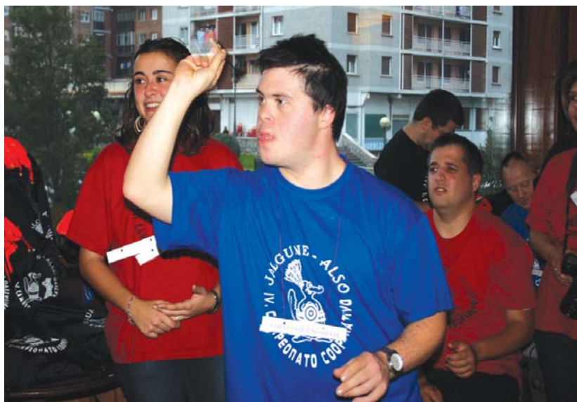
Jalguneko elkarte gazte bat baino gehiagok indarra eta zehaztasuna duela erakutsi zuten dardo txapelketa berezi honetan.