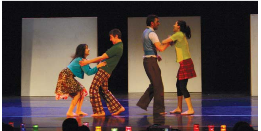
Musuak, besarkadak... poza sortzen duten une asko daude bizitzan eta horietako batzuk azaldu ziren kultur etxeko aretoan.

Lasarte-Oriako ikusleen harridura nabarmena izan zen Momentari lanaren une batzuetan, baita haien barreak eta onespena ere.