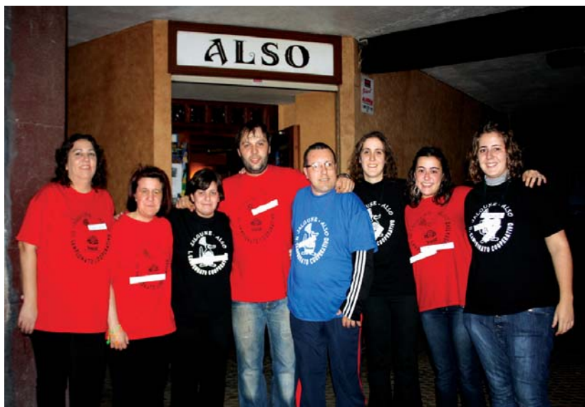
Jalguneko elkarte kideak esker handia diete txapelketa honetan urtero parte hartu duten lagunei eta Also tabernari.

Interesatuak dauden herritarrek Jalguneko elkarteak Behetako Kale bidea 1, 2. solairuan duen egoitzara hurbildu daitezke ostegun eta ostiraletan, 17:30etatik 19:30etara edo larunbatean, 15:30etatik 20:30etara. •