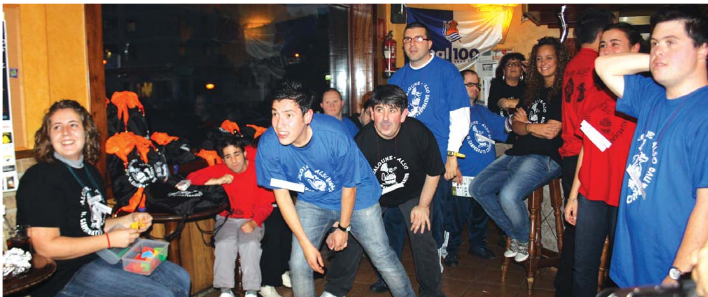
Giro ezin hobean Jalguneko kide eta lagunek bosgarren dardo txapelketa kooperatiboa egin zuten. Argazkian ikusten den bezala, urritasuna ez duten partehartzaileek oztopo bat baino gehiago gainditu zuten jaurtitzeko.