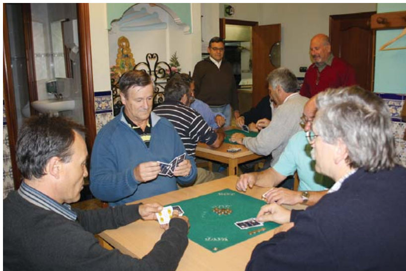
Tute eta Mus txapelketa jokatu da astearte eta asteazkenean arratsaldez Semblante Andaluz elkartearen.