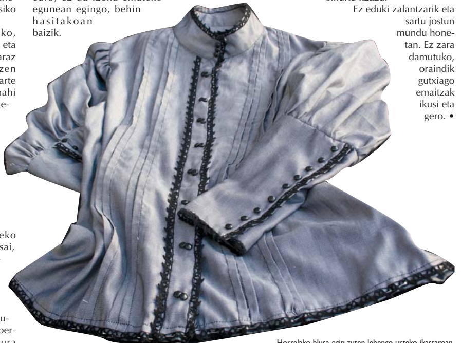
Horrelako blusa egin zuten lehengo urteko ikastaroan.

Ez eduki zalantzarik eta sartu jostun mundu honetan. Ez zara damutuko, oraindik gutxiago emaitzak ikusi eta gero. •