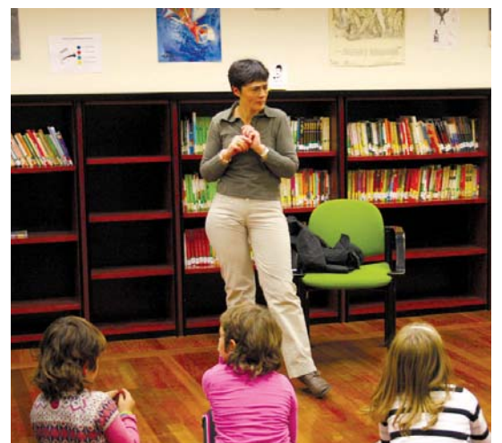
Korukok ipuinak kontatzeaz gain, haurren kontakizunak ere entzun zituen.

Hurrengo saioa, astelehenean, urriaren 25ean izango da, 18:00etan. Pello Añorgaren eskutik, 4 eta 5 urte bitarteko haurrek istorio ezberdinez gozatzeko aukera izango dute. •