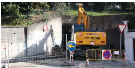
Loidi kaleko tunela itxia dago eta hiru astez ezingo da pasabide hau zeharkatu.