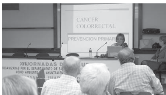
Osasun jardunaldietan gai ezberdinak jorratzen dira, iaz esate baterako kolon minbizia.