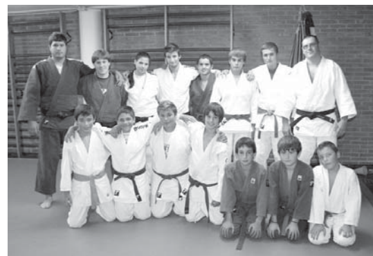
Aristegiren mutilak lan ona egiten ari dira. Oraingoan gaztetxoek lortu dituzte dominak.

Orain, hilabete amaierako Avilesko Hiria sarian parte hartzeko prestatzen ari dira. •