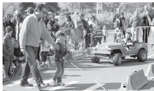
lax kanpainak izan zuen arrakasta ikusirik, berriro ere, Urbilera dator autoeskola berezia.

Autoeskola berezi honetaz gozatzeko, hurbil zaitzete Urbilera, goizean 11:00etatik 13:00etara edo arratsaldean 16:00etatik 19:00etara. •