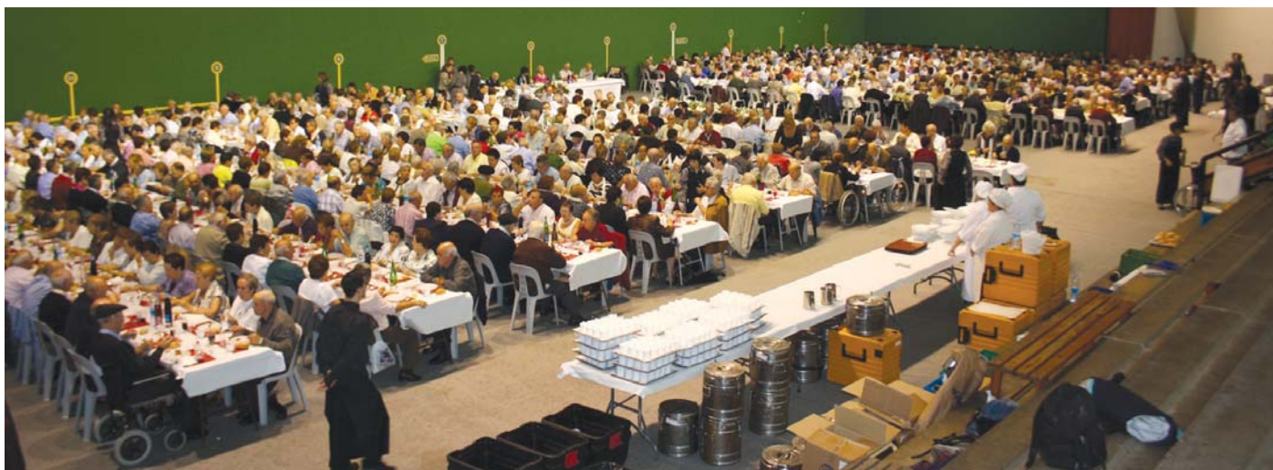
Igandean, urriaren 10ean, ospatu zen Zaharren omenaldi eguna. Hainbat ekitaldi burutu ziren eta jendetsuena Michelin kirol guneko frontoiko bazkaria izan zen, 870 herritar bildu ziren bertan.