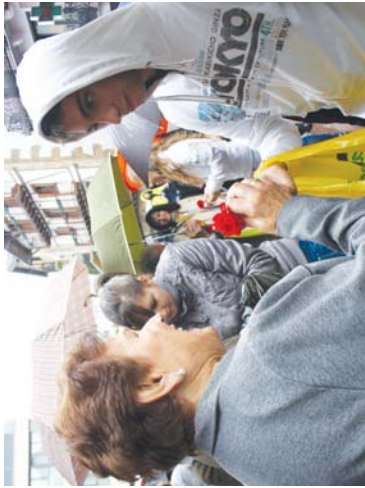
Haur eta gazteok ere bere harrizkoak jarri zuten omenaldi honetan. Argazkian, olerki eta marrazki lehiaketako sariak.