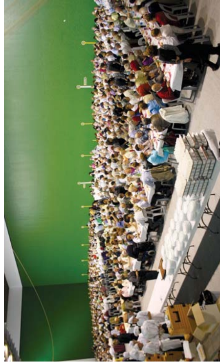
Ospakitzun amateko, ohikoa den bezala, bazkaria antolatu zen eta bago bazkaldia zuten Micheln, keol gureko pilotalekuan bildu ziren 870 herritarrek.

Izan ere, bertan Lasarte-Oriako Biyak-Bat erretiratuaren elkarteko abesbatzak eskaintzako kontzertua emaitzeko aukera egon zen, baita hainbat txiste