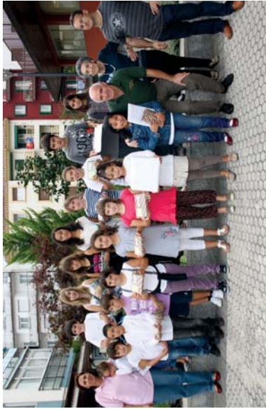
Haur eta gazteok ere bere harrizkoak jarri zuten omenaldi honetan. Argazkian, olerki eta marrazki lehiaketako sariak.