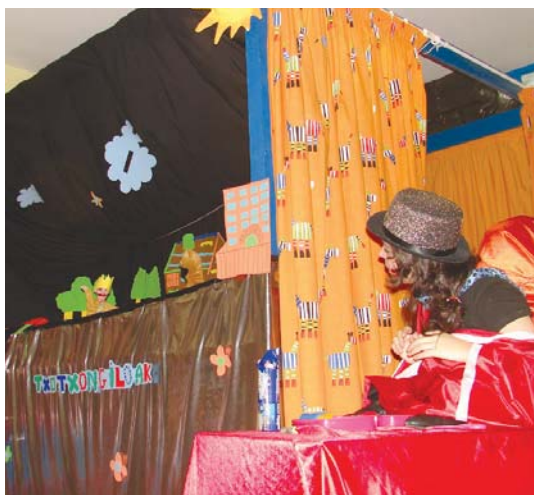
Txotxongilo saio ederra eskaini zieten begiraleek Ludotekako haurrei.

Hasiera berezi honen ostean, ostiralero tailerrak, jolasak eta eskulanak egingo dituzte Klubeko gaztetxoek. •