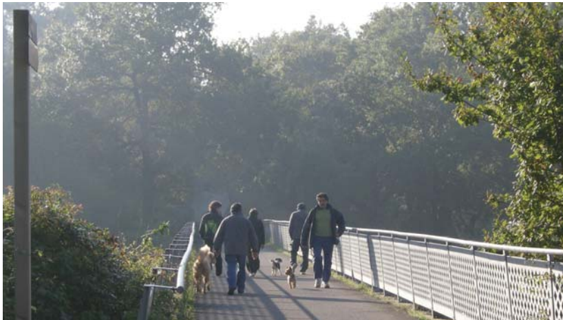
Buruntzaldeko ibilbideen bigarren topaketan jende ugari parte hartu zuen.

Formaz ondo aurkitzen dena eta bi ibilbide egiteko gogoz dagoena, jakin dezala kamiseta bat jasoko duela opari eguneko oroigarri gisa. Andoain-Usurbil ibilbidea egiten dutenak ere, bietako edozein norabidean eginez gero, kamiseta bat ere eskura-