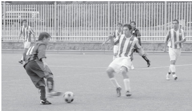
Ostadar eta Texas Lasartearren arteko denboraldiko lehenengo derbia fisikoki gogorra izan zen jokalariek guztientzat.

08:30ean, Ostadarreko zikloturista taldeak San Martzialera, Irunera egin- go du irteera.