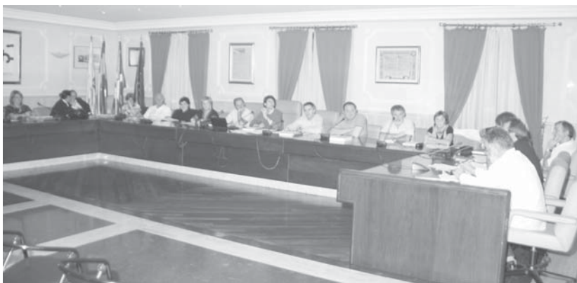
Hilaren 7an ospatutako plenoan ez ziren aurrekontuan onartu. Oposizioako alderdi guztiak kontrari bozkatu zuten.