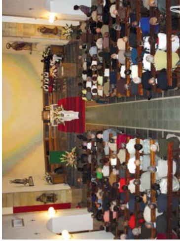
Egnari hasiera emateko, San Pedro parrokiaren mezan ospatu zen. Honean, hainbat pertsona sifidndi eta uddi ordaintzeko egon ziren. Irteeran, Ostarre taldeko gazteek klabellinak, txapeltakozkoak, txapeltakozkoak, txapeltakozkoak...