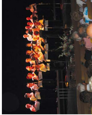
M re Luisa Corpearen zuzendaritapan, abuztu egunak, hala nola, Pire Vigi, Donostarra, Chelillos soba, Alumberra eskolaini zuten Biyk. Bat erretiratuaren abesbatzak, baita erretiratuaren elkarteko erretiratuak ere.