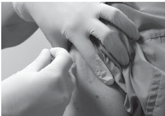
Arrisku taldeek gripearen aurkako txertoa jartzeko aukera dute, urriaren 31a arte.

Eta aurretik aipatutako beste arrisku-talderen batekoak direnek, ohiko medikua-rengana joan behar dute txertoa jarri ahal izateko bolantea hartzera. •