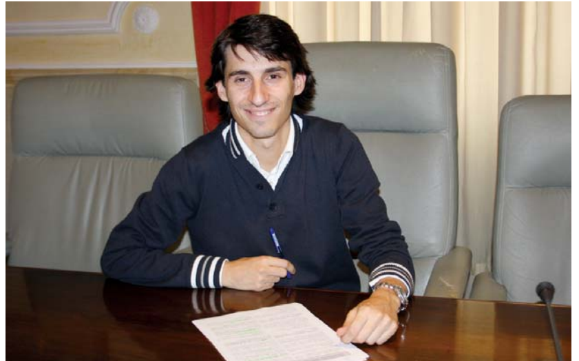
Lasarte-Oriako alkateak Udalaren Babes Ofizialeko Etxebizitzaren lehenengo promozioiko zozketa azaldu zuen.

Honetan, beste bost zozketa egin eta 45 etxebizitza banatuko dira: lau, mugikortasun urriko kidea duten familiarrentzat, beste lau, bost edo