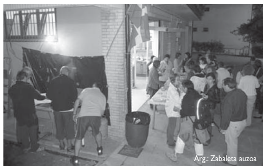
Arg.: Zabaleta auzoa

Herriko taldea astelehen eta ostegunetan, 20:00etatik 21:30era, biltzen da Arantzazuko Ama Birginaren eliza azpiko lokalean. •