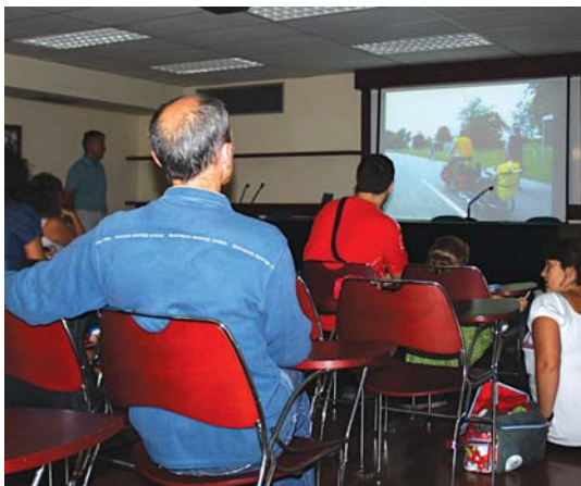
Alemanian zikloturistentzat egokitutako espazio ugari aurkitu zituzten.

25 minututako ikusentzuzkoan Lur da protagonista, bere eskutik kontatzen da bidaia. Familiako kide txikiak kokatzen gaitu uneoro bidaia honetan: Strasbourg-etik atera, Alsacia, Rhin ibaia, Suitza, Alemania, Danubio ibaiaren sorkuntza, Ulm, Baviera, Ingolstadt, Ragensburg, Deggendorf, Austria, Viena, Paris... zeharkatu eta etxera itzuliko dira. Bi hilabete izan ziren, abenturaz jositako bidaia.