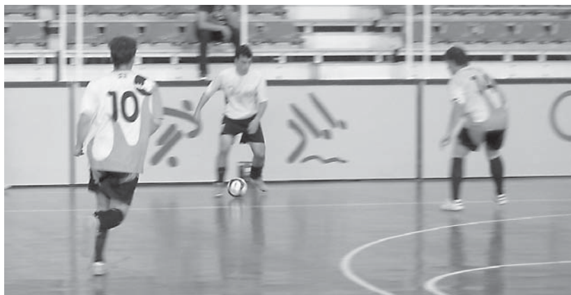
Aldaz Hertz Klinika taldeak Nazional B mailan mantentzea du helburua, aurtan ere.

08:30ean , Ostadarreko zikloturista taldeak Betelura egingo du irteera.