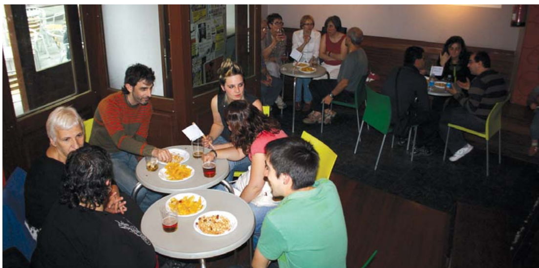
Mahai bakoitzean gai ezberdin bat, hori izan zen aurreko urtean Mintzodromoaren I. edizioan Jalgin ospatu zena.

Hau guztia martxan jartzeko, hoberena lehendabizi "solaskide talde edo bikoteka momentu babestuetan aritzeko parada izatea" eta ondoren "bizitza errealean, normaltasun osoz aritzea".