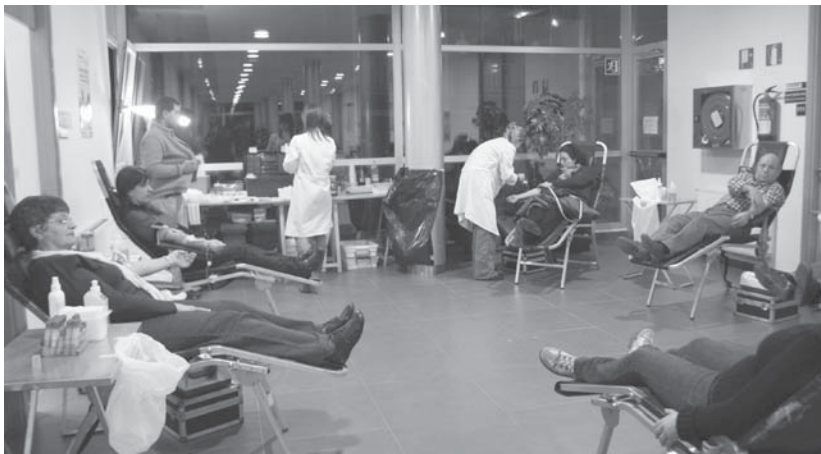
Odol atertze egunetan 57 odol emari egiten dira herrian. Odol eskaerari aurre egiteko, 10 emari gehiago egin behar lirateke.