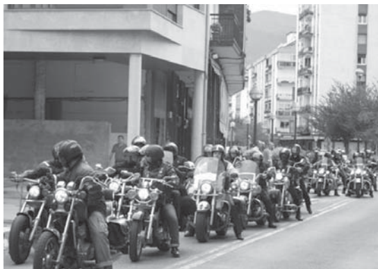
Era desberdinetako motorrak ikusi ahalko dira larunbatean.

Azkenik, ospakizunak ederki bukatzeko, arratsaldeko 18:00etatik taberna itxi arte, djak, opariak, ron dastatzea eta sorpresa ugari egongo dira Mendi Kafe Rock-era hurbiltzen direntzat. •