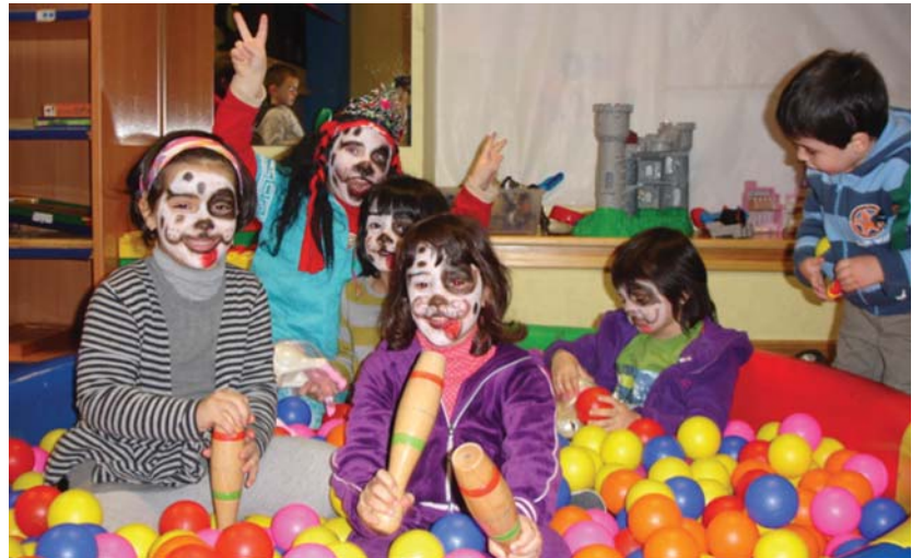
Umeak euren aisia antolatzea da helburua "momentuan ez badute egin nahi ez zaie behartzen"

Lasarte-Orian umeen aisia euskalduna bultzatzeko helburuarekin jaio zen Amaraun Ludoteka. Jolas egiteko gunea da, umeei dibertsioa eskainiz. Elkarbitza bultzatzeaz gain aisialdiko jolasaren bitartez haurraren garapena lantzea da helburua, beti ere, euskararen erabilera eta ezagutza bultzatuz. Jolasteaz gain, lagunekin biltzeko aukera eskaintzen du, lagunarteko jolasa sustatuz.