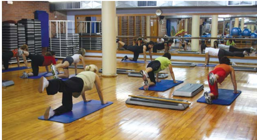
Herenegun Gah (gluteoak, abdominalak eta hankak) ikastaroa probatzeko aukera izan zuten kiroldegira hurbildutakoek.

arteon kirola sustatzeko, hurrengo larunbatetan hainbat kirolerako erakusketak egingo dira eta hauetan parte hartu daiteke.