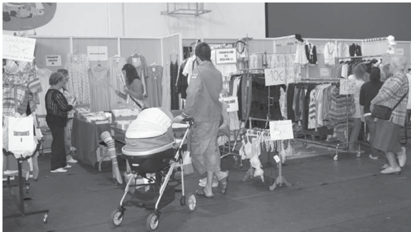
Stock eta Saldoen azokako aurreko bi edizioek harrera ona izan dute herritarren artean, pagotx ugari aurki daitezke.

Asteburuan denboraldiz kanpoko arropa edo edozein modutako pagotxak erosteko aukera egongo da