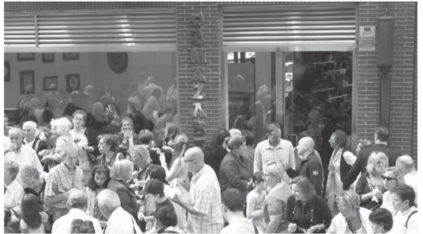
Jende ugari bildu zen Ormazabal loradendaren inauguraziora.

Lau urte eta erdi beste lokalean egon ondoren, larunbatean inauguratu zuten lokal berria