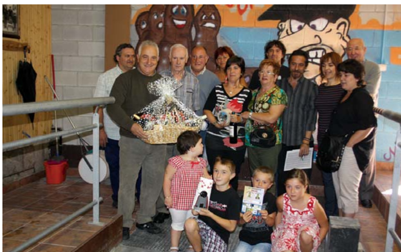
Amaitutakoan, antolatzaileek, irabazleek eta omenduen senitartekoek argazkia atera zuten.