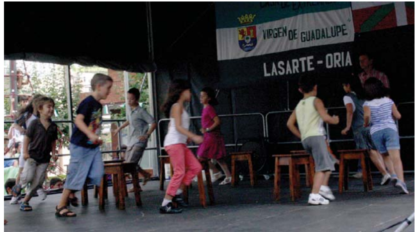
Haurek ederki gozatu zuten Extremadura etxeko lagunek prestatutako jolasekin, hala nola, aulkien jokoarekin.

Hauetaz gain, doinu eta dantzen emanaldia ikusteko aukera egon zen larunbata arratsaldean, Nafarroako Extremadura etxeko Raices y Brotos taldearen eskutik. •