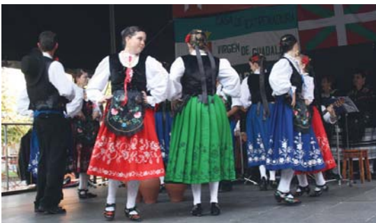
Larunbata arratsaldean, Raices y Brotos taldeak folklorea ekarri zuen plazara.