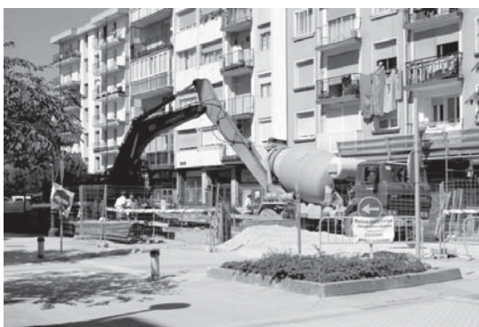
Intertzeptoreko lanengatik Ola kaleko 10. zenbakitik Oria ibairaino itxiko da.

Lanek eragin dituzten zirkulazio aldaketei dagokionez, Dorre parkeko lurrazpiko aparkalekuak eta Ola kaleko lehenengo zenbakiko garaieak ohiko sarrera izango dute.