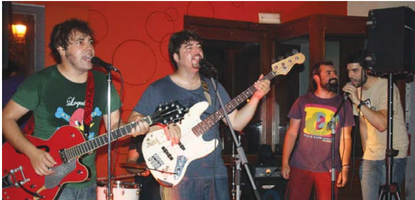
Azkaiter Pelox Bandek eskaini zuen rock eta blues jam sesioan hainbat herritarrek parte hartu zuten.

Taldeen abestiek, zein bertsiioek Parapetoko gunea musikaz bete zuten gaueko ordu txikiak arte. •