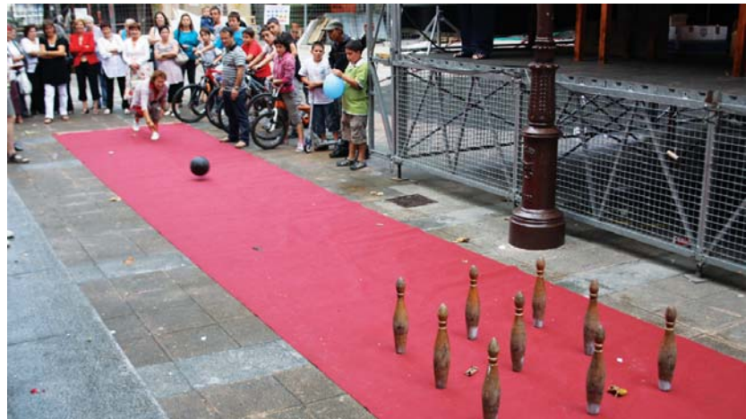
Igande arratsaldean, euria ere festara batu zen. Bola jokoan eta tokan aritu ziren herritarrek aurre egin zioten eguraldiari.