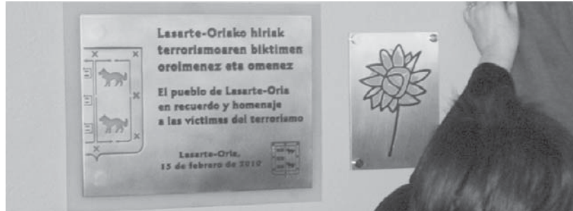
Memoriaren egunean lore sorta jarriko da memoriaren mapa irudikatzen duen betibizi lorearen plakaren aurrean.

Honetaz gain, tentsioa nabaria izan zen, Ezker Abertzaleko zinegotzietatik hitza