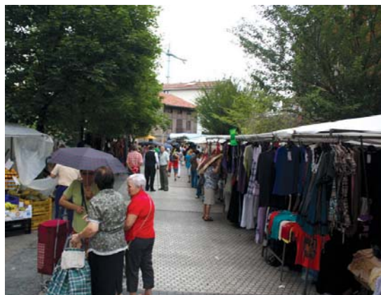
Elizatze plazako kokalekua behin behinekoa dela azaldu digu Udalak, lanak bukatu arte; Brigitarren plazako postuak ordea, hor izango dute behin betiko lekua.