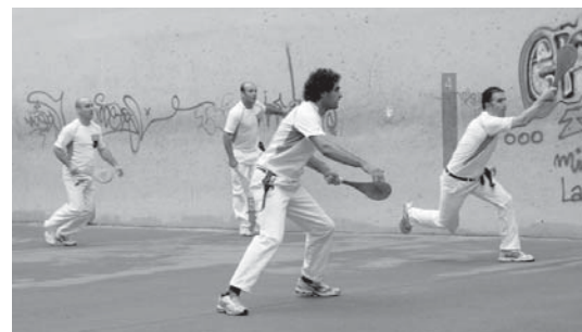
Partida gogorra jokatu zuten atzo, finalerako lehenengo txartela eskuratzeko.

Gaur arratsaldeko 19:00etara, atzeratu da bigarren final