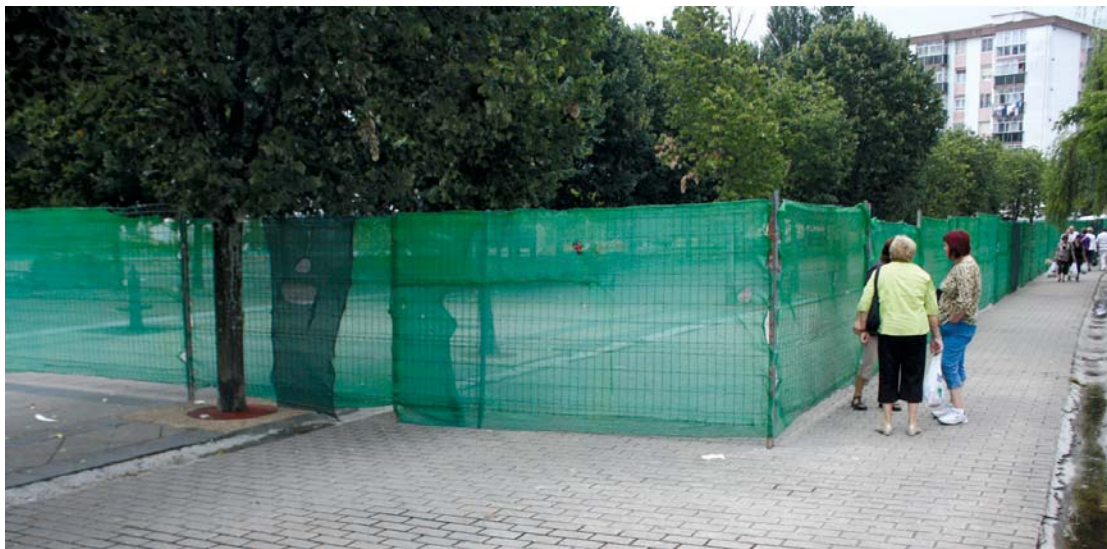
Udaletxe eta parke berriko lanak direla eta, ibai ondoko pasealekuko eremu bat hesiz itxi dute. Bertan jartzen diren postuak lekualdatu behar izan dituzte.