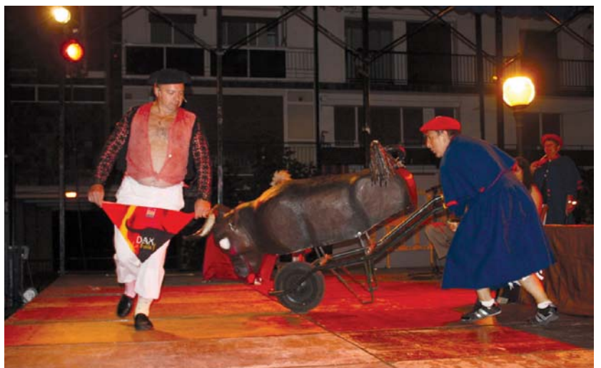
Hainbat testigantza eta pertsonaia xeblere ikusi ahalko dira Isla plazako ohol-tzan eta hori guztia, musikaz girotua.