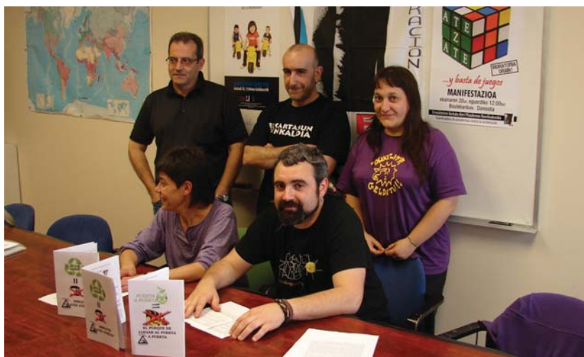
Sei urte dira Lasarte-Oria Bizirik plataforma sortu zena, urte hauetako bilakaera jakitera emateko liburuxka argitaratu dute.

Bestalde, liburuxka bat argitaratu du taldeak interesgarria den informazioarekin. Batetik, duela sei urte Lasarte-Oria Bizirik sortu zenetik, taldeak izan duen bilakaera azaltzen da, hasieratik defen-