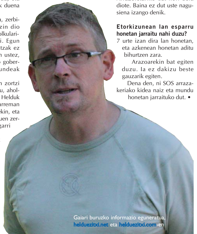
Gaiari buruzko informazio eguneratua, helduezitxi.net eta helduezitxi.com -en

Dena den, ni SOS arrazakeriako kidea naiz eta mundu honetan jarraituko dut. •