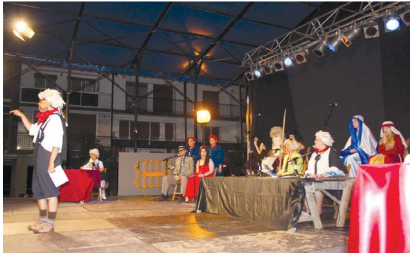
Epaiketa berezi honetan, urtean zehar, herrian gertatutako guztia errua botako zaie akusatuei. Ea aske geratzen diren.

Santa Ana, San Joakin eta Basajaun ere bertan egingo dira guztia entzun eta epaia emateko. Ea akusatuak erre-tzen dituzten! •