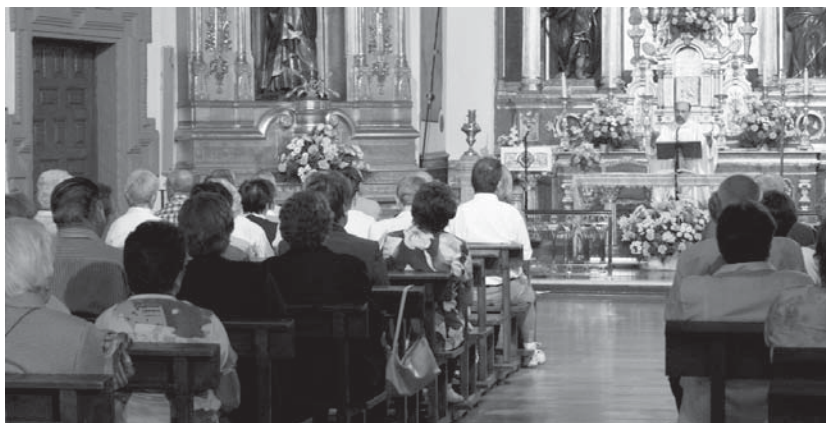
Santa Brigitaren heriotza ospatuko dute gaur 11:00etan Brigitarren komentuko kaperan egingo den mezan.