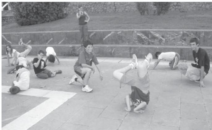
Break-dance, capoeira eta batukadan trebeak direla erakutsi zuten txokoetako gaztetxoek.

Lasarte-Oriako Udalak herritarren parte hartzea sustatzeko iradokizun orrialdea duela gogora arazten da. Orrialdea Udaleko harreraren dago eskuragarri, baita baita www.lasarte-oria.org orrialdean ere. Idatzi ostean, Udaletxeko harreraren dagoen postontzi berdean utzi edo iradokizunak@lasarte-oria.org helbide elektronikora bidali behar da orrialdea. •