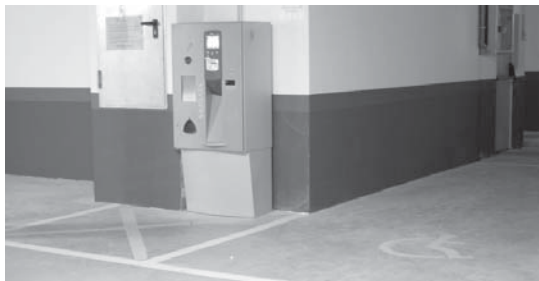
Osasun zentro azpiko aparkalekuan txartelaz bakarrik ordaindu ahalgo da.

Lehenengo astelehenetik, Loidi-Barreneko, hau da, Osasun Zentro berriko txandakako aparkalekuko tarifak txartelarekin bakarrik ordaindu ahal dira, izan ere, makinak ez du txaponik hartzen. •