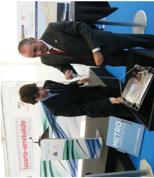
Arg.: Lasarte-Oriako Udaia