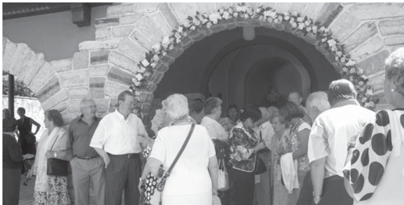
Urtero legez, Oriako auzotarrek Karmengo Amaren eguna ospatuko dute ostiralean.

Alkateak tirabirarik ez zela egon azaldu zuen, "txosna haiek eskatutako lekuan jartzeko asmoa zegoen, Loidi-Barrenko frontoiaren aurrean. Baina haiek leku aproposa ez zela jakin arazi zidaten eta errepidean egin zen azkenean. Gurekin behintzat ez dute kezkarik" •