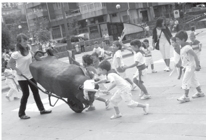
Udako txokoetako txikiak ederki gozatu zuten asteartean Andatza plazan antolatutako entzierroan.

Milaka abentura biziko dituzte herriko haur eta gazteek udara osoan zehar