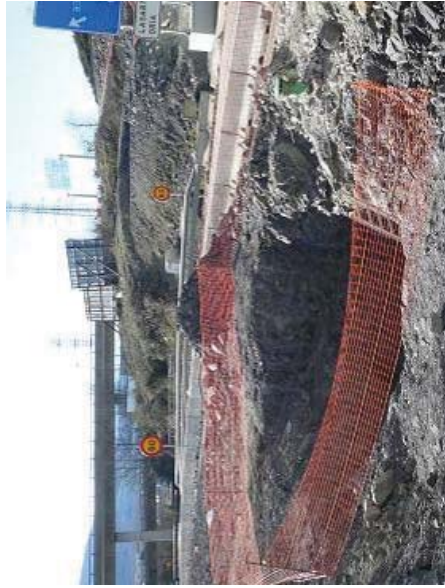
Errekaldean burutzen ari diren obraren irudiak zuloak, duela 100 urteko tunel ahaztua azalertu da.

Bigarren gerririkoko lanetako esker-historia azalertu da.