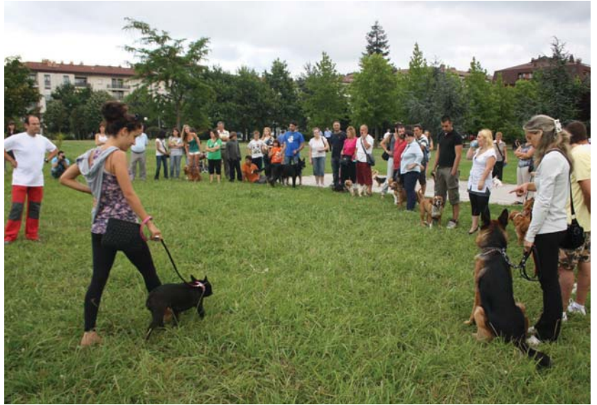
Hainbat herritar Atsobakarren izan zen euren zakurrekin ostiral arratsaldean adituen aholkuak entzuten.

Aditu hauek osteguneko hitzaldi teorikoa eman zuten eta ostiralean bezperan azaldutakoa praktikan jarri zuten Atsobakarreko parkean. Hirurak dira zakurren trebakuntzan adituak, eta banan-banan aztertu zituzten Atsobakarrera hurbildu ziren jabe eta zakurren jokabideak. Zakurren erreakzioak nolokotzat izaten diren, une bakoitzean zakurrek duten jarrerak zer esan nahi duen, eta beste hainbat egoera jorratu zituz-