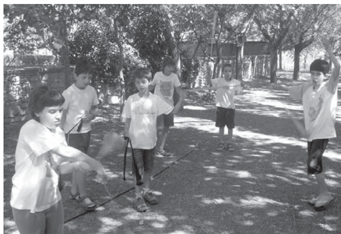
Mendigorrian irteerak, tailerrak, jokoak, igerilekua... gaztetxoak primerako udalekuak ari dira igarotzen.

I kastola bukatu eta haurrek ez dute aspertzeko betarik Ttakin Kultur elkarteak, Udalarren laguntzaz, antolatutako Udako txoko eta kanpaldietan.