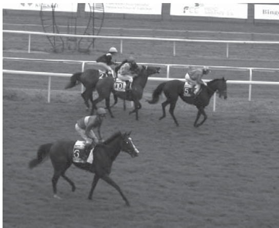
Zaldi eta zaletuen hotsez bete da hipodromoa.