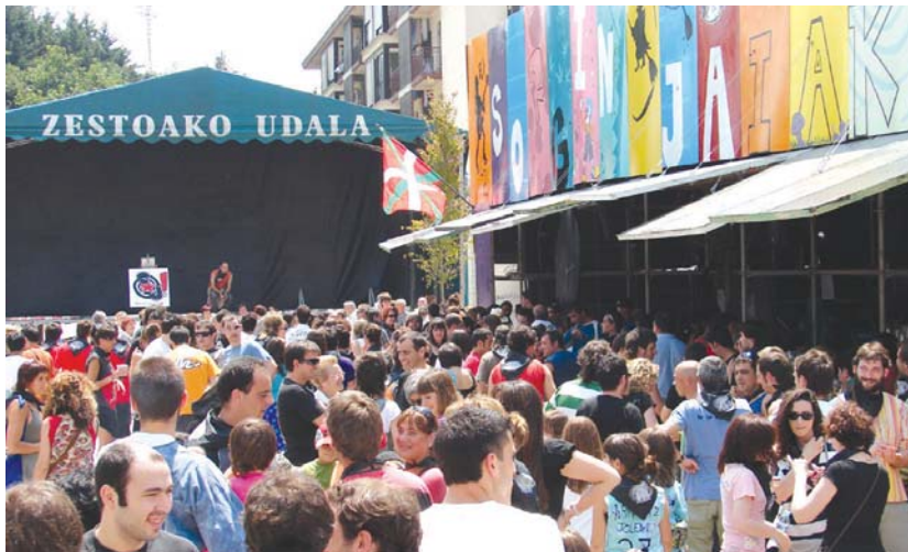
Sorgin Jaiek Gunea jendez lepo zegoen aurten ere txupina bota aurretik.

Mila esker, bertan parte hartu duzuen elkarte eta pertsona guztiak, zerrandatzen hasi gaitzeko, baina zerrenda amaigabea da. Zikiroko giroa, oilaskoen usaina, dantzarien iaioitasuna, irrien lagunak, kafe pizgarrien beharra, kontzertuetako alaitasuna, parte hartze nabarmena, goitik behera eta behetik gora egitea posible dela erakutsi duzue-