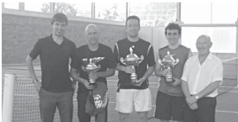
Lasarte-Oria tenis txapelketako lehenengo hiru sailkatuak antolatzailerekin.