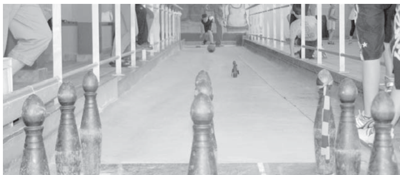
Trebetasun handia dutela erakutsi zuten haur eta gaztetxoek San Pedroetako bola-joko eta toka txapelketan.

Antolatzailerak azaldu digutenez, parte hartzaile guztiek gozatu zuten jokoez eta trebetasunez aritu ziren bi txapelketetan. Amaieran, gainera, dominak eta goxokiak jaso zituzten.