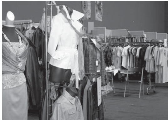
Arropa, oinetakoak, denetarik aurkitu daiteke Stock eta Saldoen azokan.

Bertan bere produktua saldu nahi duenak, Aterpearekin jarri behar du kontaktuan, 637 955 030 eta 687 845 623 telefono-zenbakien bitartez, edo itziarirurun@hotmail.com helbidera posta elektronikoki bidalitz. •