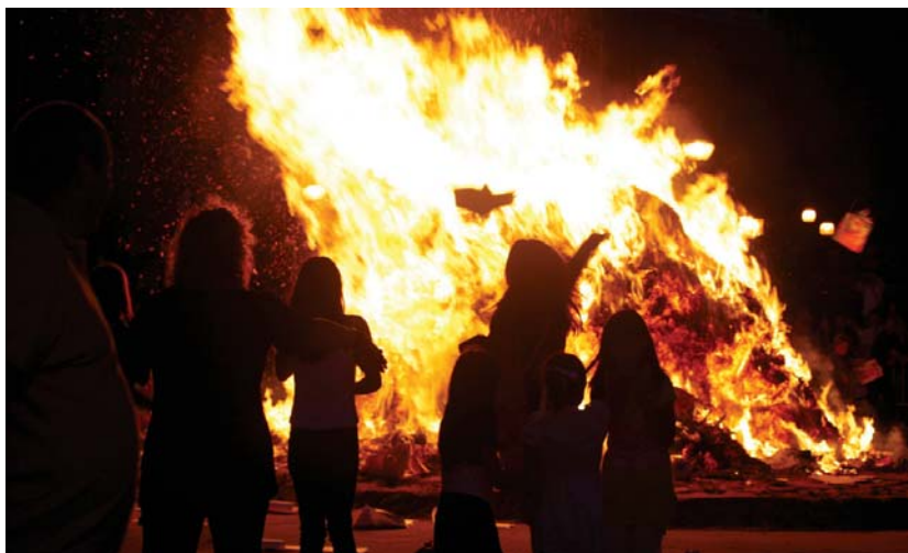
Oroitzapen txarrak erretzeko aukera izango dute herritarrek asteazkenean Andatza plazan egingo den San Joan suan.