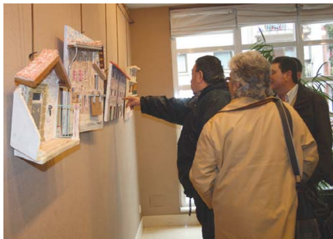
Ostegunean, herritar ugari bildu zen Lasarte-Oriako etxe zaharren erakusketaren irekieran.

Etxe baten maketak oroitzapen asko ekarri eta solasaldiak ireki ditzakela argi geratu zen ostegunean erakusketaren inaugurazioan.