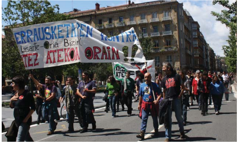
Lasarteoriarrek bi pankarta eraman zituzten Donostiako manifestazioa.

Jende asko bildu zen atzo igandea, eguerdian Boulevard-etik abiatuta Donostiako kaleetan egin zen errausketaren aurkako manifestazioa. Aurretik Porrotx, Petra eta hainbat haur zihoazen euren patin eta bizikletekin, ondoren hainbat lagun pankarten atzetik, tartean batukada eta manifestazioaren bukaeran hipodromoko zaldiak, guztiak "Moratoria, osasunaren alde, no a la incineradora" leloarekin bat eginez. Jendetsua eta alaia izan zen Errausketaren aurkako plataformek deitutako manifestazioa. Lasarte-Oria Bizirik plataformako hainbat lagun ere bertan izan ziren bi pankartatan errausketa salatu eta atez ateko bilketa aldarrikatuz.