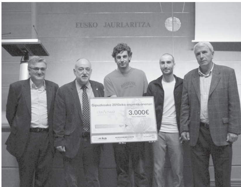
Gipuzkoar enpresa onenaren saria lasarteoriatar batek eta donostiar batek irabazi dute Neurtu enpresari esker

Enpresa asko aurkeztu ziren, baina gehienak itxurazko enpresak ziren, eta hauentzako sari txikiak izan ziren. Gurea martxan zegoen jada, eta Bizkaiko eta Arabako beste bi enpresekin gu izan