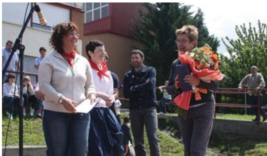
Sasoetako gurasoen elkarteak opari eta lore sorta eman zioten Koruri.