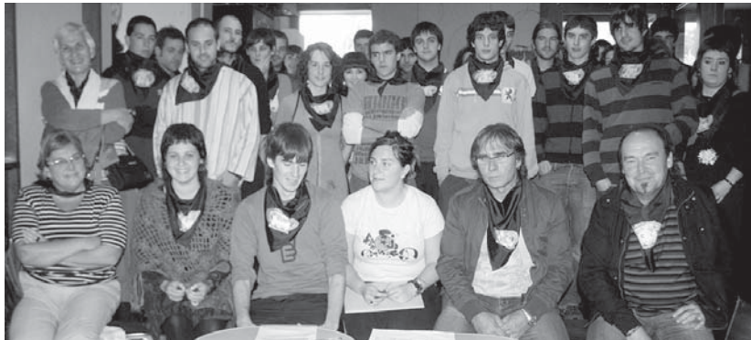
Elkarte eta gazteen babesa izan zuen Sorgin Jaiak batzordeak San Pedro jaietarako aurkeztutako egitarauak.

Ostadarrek, berriz, igandearen goitibehera txapelketa eta kronoeskalada antolatuko