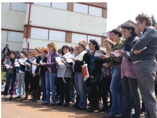
Koru Garmendiari bertso bat kantatu zioten Sasoeta-Zumaburuko irakasleek.