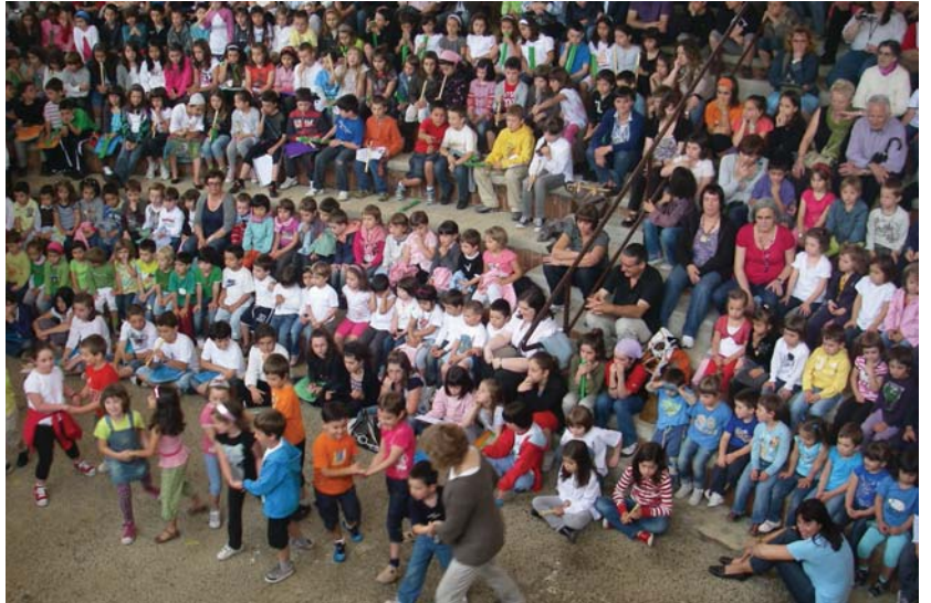
Landaberriko jaialdian, ikasleek dantzan egin zuten beste ikasle, irakasle eta hainbat gurasoren aurrean.

Landaberri ikastolan ere, aurreko astean ez zen giro bikain eta umorerik falta izan, ikasturte amaierako ospakizun-jaialdian. Gurasoek ederki pasa zuten euren haurren musika eta dantza emanaldiak ikusten. •