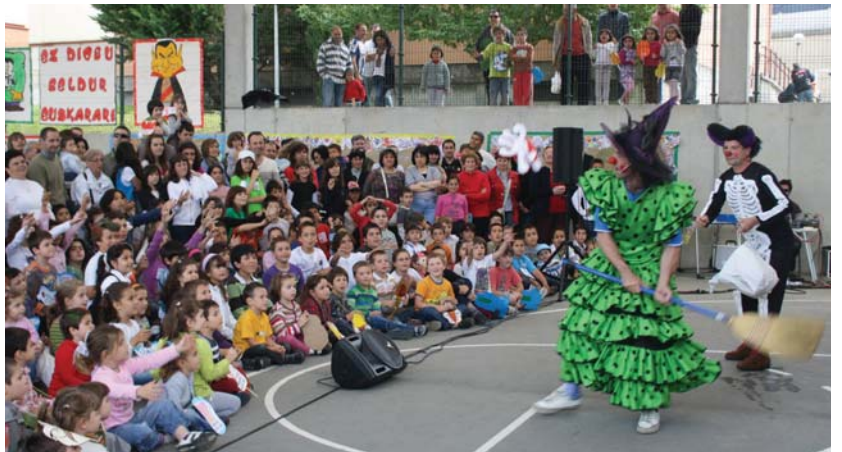
Gustura egon ziren Sasoeta-Zumaburuko ikasleak Hipo eta Tomax pailazoaren "Beldurraren etxean" lana ikusten.