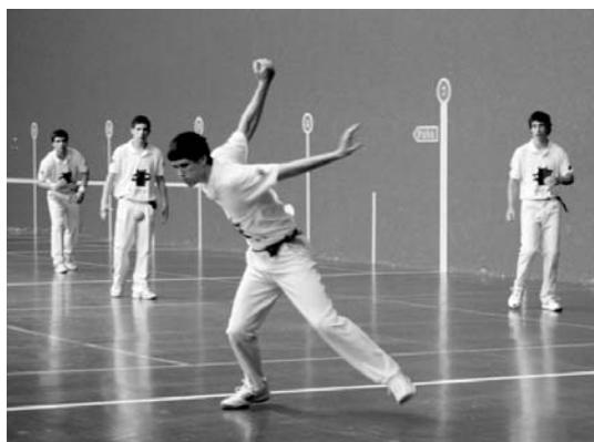
Donostia nagusi izan zen kadete eta gazte mailan; Lasarte-Oria, seniorretan.