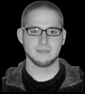
Eman ta zabaldu

Maiatza badoa. Uda iristear da. Eta hementxe gaude ikasle gehienak, liburutegi bateko zoko batean denbora ia uler- tezinak suertatzen zaizkigun apunte batzuen aurrean galtzen. Gaurkoan idaztera noana, estres momentu bate- tako erreibelazio personal baten moduan ulertu behar dela abisatu beharrea nahiz.