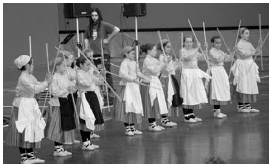
laz ez bezala, antolatzaileek arratsaldeko saioa Andatza plazan egitea espero dute.

Eta hamaiketako hartu osten, hasiko da desfilea. Lau ibilbide egongo dira, batetik Sasoeta auzo inguruan egingo