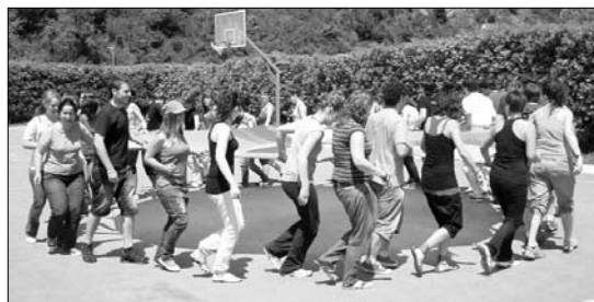
Begirale eta koordinatzaileek heziketa eta jolasen asteburua izan zuten.

Takuneko aisiako arduradunek eskerrak eman nahi dizkiete begiraleei, "asteburuan izandako motibazio eta giro onagatik." •