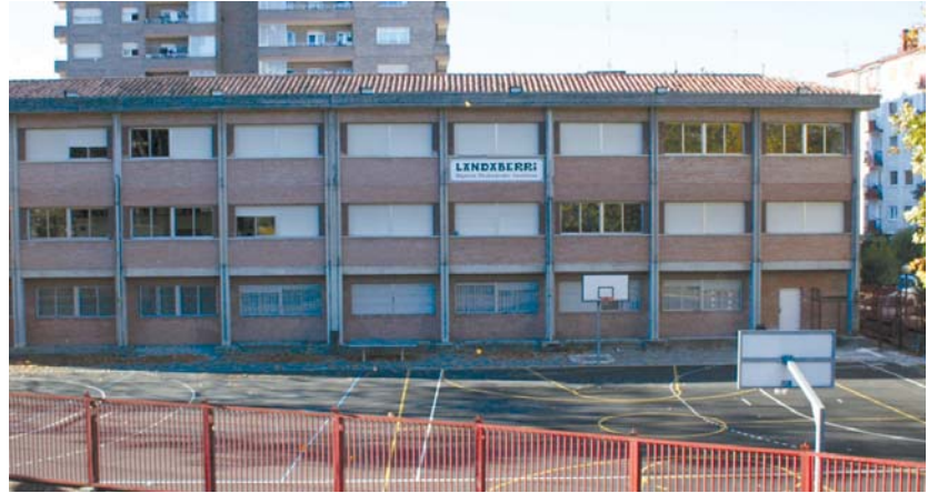
Landaberi BHI-n eta Sasoeta-Zumaburu ikastetxean astearteko grebak eragin handia izan zuen .

Nahiz eta Landaberi ikastolan Haur Hezkuntza eta Lehen Hezkuntza greba ez zen nabaritu, Landaberi BHI-n irakaslearen %87ak egin zuen greba asteartean