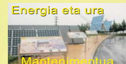
Energia eta ura