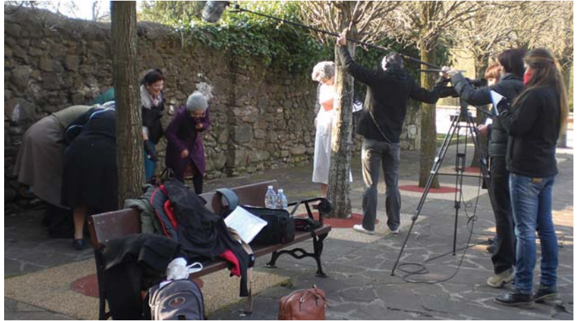
Antzerki eta Dantza Astea aurretik nobedade batekin datorkigu, laburmetraia. Talde honek herrian ere grabatu zuen.

Amona koadrila batekin eginkizun bat dauka. Hori egin beharra daukate, nola edo hala. Eta egin ahal izateko nahiko abentura eta gertaera bizi beharko dituzte.