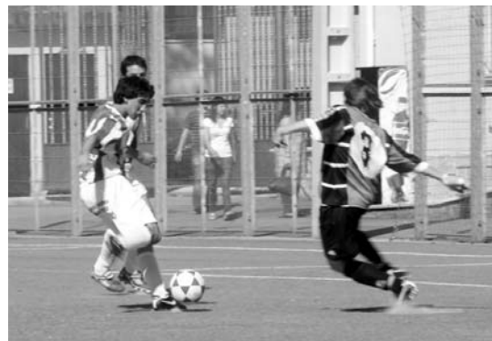
Texas Lasartearra taldeak erraz lortu zuen larunbatean finalerako txartela.

Bestalde, Texas Lasartearren erregionaleko mutilek