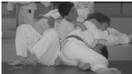
LOKEko judoken entrenamendua ikusi ahalako da ETB-n, besteak beste.