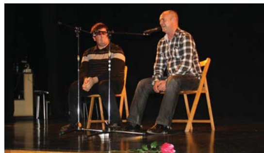
eeeeeeeeeeee eta oooooooooo-ak luzatuz bertso-flamenkoa egin zuten.