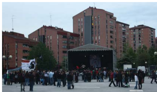
Hainbat lagun bildu ziren Andatza burutu ziren ekitaldietara.