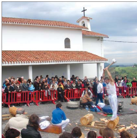
Herri kiroletan zaharrenek irabazi zuten proba mistoan.