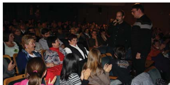
Bertsolariek jendeartera jaitsi zirenean Muñoaren amari kantari.