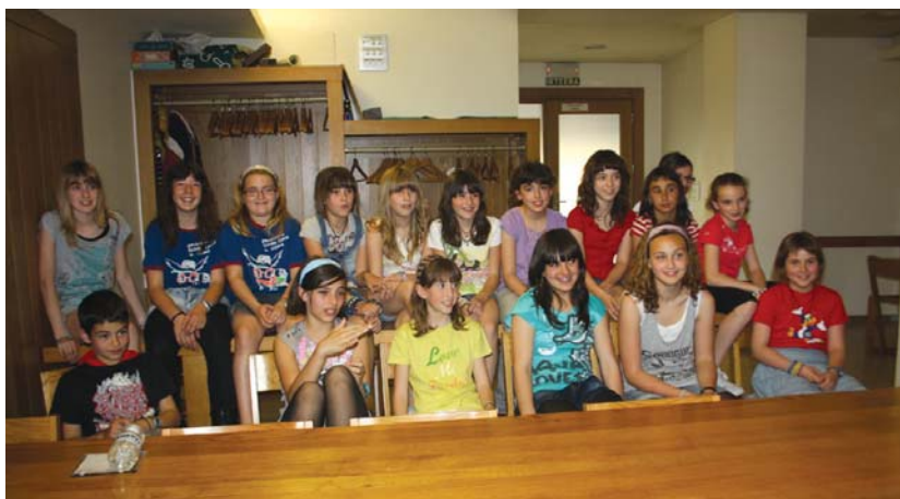
Landaberrin eta Sasoetako bertsolariek Arrieskaletan duela bi aste elkarrekin merendatu zuten.