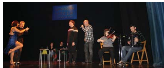
Paya eta Egaña tangoa kantatu zuten soinua eta biolin joleen laguntzaz.