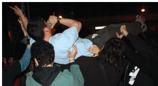
Bittor abeslariak eta Rafa baxujoleak jendearekin bukatu zuten.