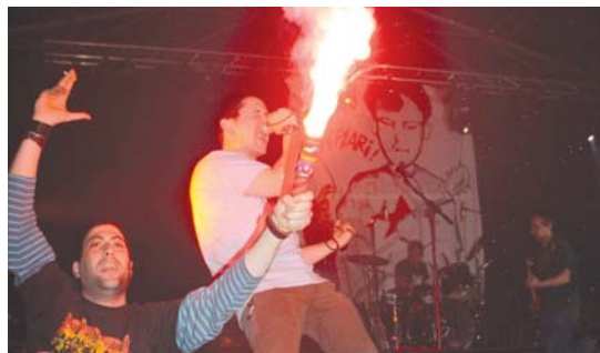
40 de Fiebre kontzertu beroa eskaini zuen zazpi urte eta gero.