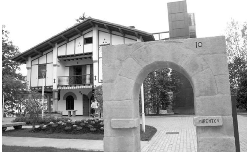
Gizarte Zerbitzuetako egoitzean, hilabete honetan hiru gizarte langile eta adminitratzaile bat hasiko dira lanean.

Murrizketekin jarraikiaz, alkateak bere soldata %20a