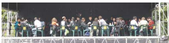
60 lagunek bazkaldu zuten Andatza plazako oholtzaren gainean.