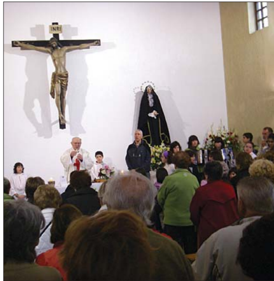
Urnietako apaizak eman zuen meza Azkorteke ermitan.