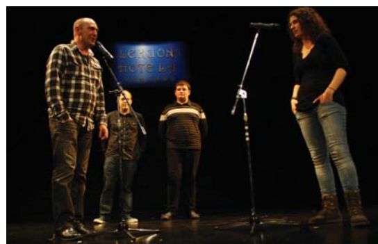
Saio borobila burutu zuten lau bertsolariek "Lekuona Hotelean".