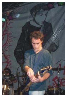
2004ko omenaldiko irudia.