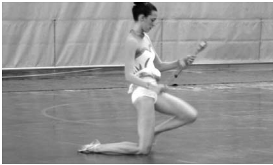
LOKEko hiru gimnastek tresna zaila diren borrekin egin beharko dute lan.