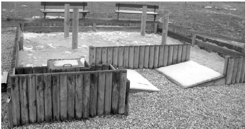
Atsobakarren jarri zen txakurrentzako komunak ez du arrakastarik izan. Txakurrak belarra nahiago dute.