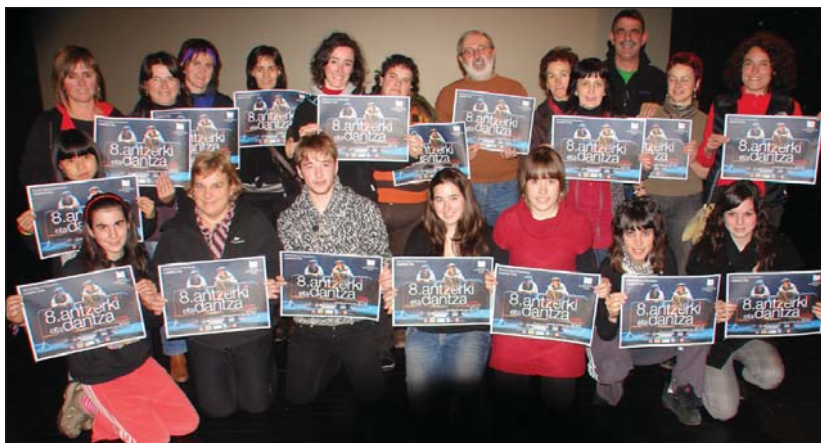
Antzerki eta dantza asteko aurkezpenean antolatzaileak, irakasleak eta ikasleak egon ziren.

Maiatzaren 15ean, desfilea eta Dantzas Blai! ikuskizunarekin emango zaio hasiera. "lazko arakasta ikusirik aurten ere desfilea egingo dugu, oraingoan talde guztiak batuta," azaldu