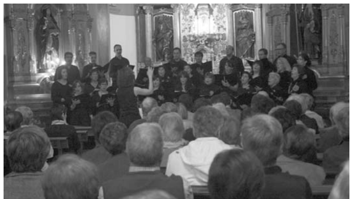
Zumaiaiko San Pedro abesbatzak gustura utzi zituen Brigitarren kaperan bildu ziren herriarrak.

Ostean, euskal abesti, zein nazioarteko abesti herrikoiak entzun ahal ziren Brigitarren kaperan. •