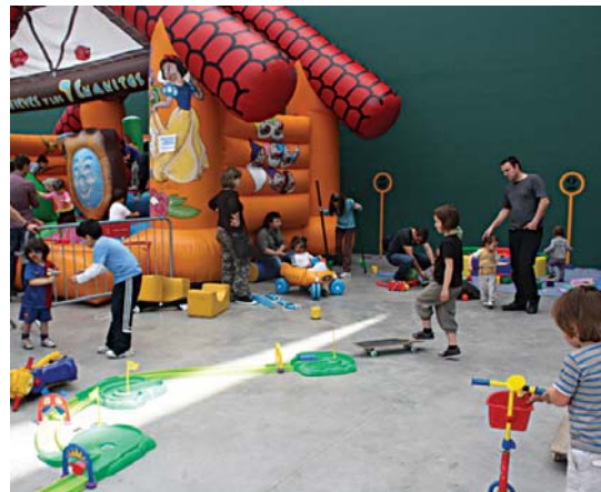
Puzgarriak, jolasak, egun zoragarria... zer gehiago eskatu daiteke?