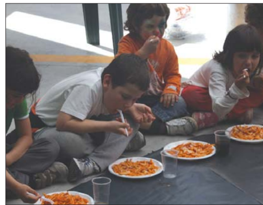
Urdaiazpikoa, gazta, tomatea... makarroiak bakoitzak bere gustura egin zituen.

Aurtengo jaialdia amaitzeaz zegoen. Baina gogoratu ezazue, uda etortzeaz dagoela, txokoak eta kanpaldiak hurbil dituzuela. Amaraun jaialdia datorrenaren zizkamizka besterik ez da, oraindik plater goxoenak dituzue zuen zai: lasai, makarroi-jana eta dibertimentu ziurtaturik daukazue. •