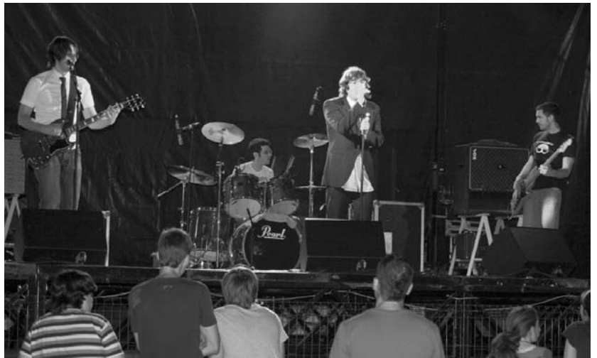
Plastic taldeak irabazi zuen iaz Lasarte-Oria saria eta San Pedro jaietako amaiera kontzertuan egon zen Isla Plazan.

Eskatutako gutzia, make-tak@lasarte-oria.org helbidera bidali behar dira maiatzaren