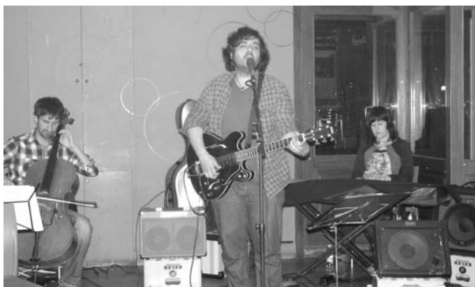
Ikusleak oso gustura egon ziren ordu eta erdi inguru iraun zuen kontzertua entzuten.

Sari metalikoaz gain, irabazleek kontzertu bat eskainiko dute hurrengo San Pedro jaietan. •