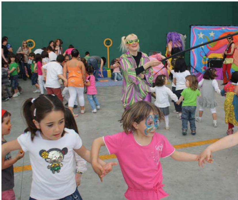
Egun zoragarriari amaiera paregabea emateko Txorro eta Morrorekin denok dantzan!