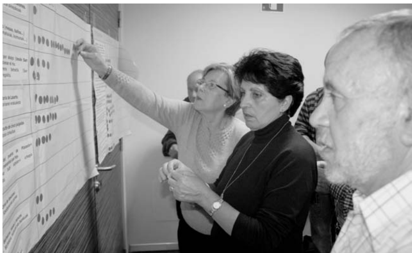
Plazaola parkeari buruzko proposamenak bozkatu ziren, aurreko ostegunean, Kudeatuz-en hirugarren bileran.

Beraz, kontraesanetan dau-den bi jarrera daude, batzuk aisialdiko gunean jartzearen aldekoak eta besteak zerbait txukundu baina aldaketa asko ez egitearen aldekoak. Egia esan, eremuan interesik izan gabe euren iritzia eman zutenen artean nagusi ziren bigarren aukeraren aldekoak, hau da, bidegorria jartzekotan par-