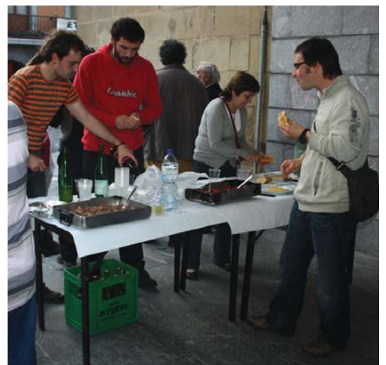
Presoen aldeko itxialdi-gaupasa egin baino lehen, sabela bete behar ondo.