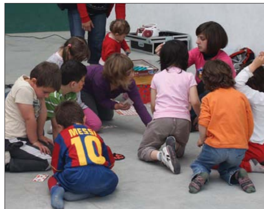
Jolasteaz aparte, aurpegia margotu eta marrazteko aukera izan zuten