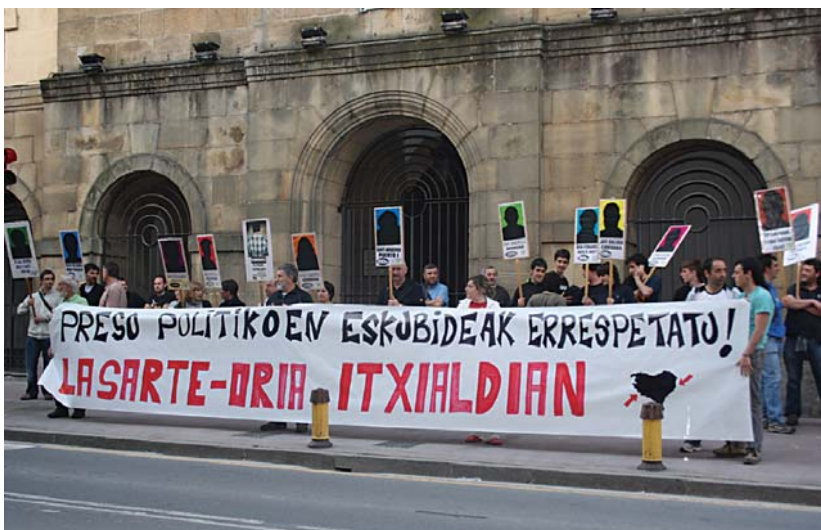
20:00etan hasi zen preso-erantzuleen aldeko itxialdia udalaren aurrean elkarretaratzea eginez.