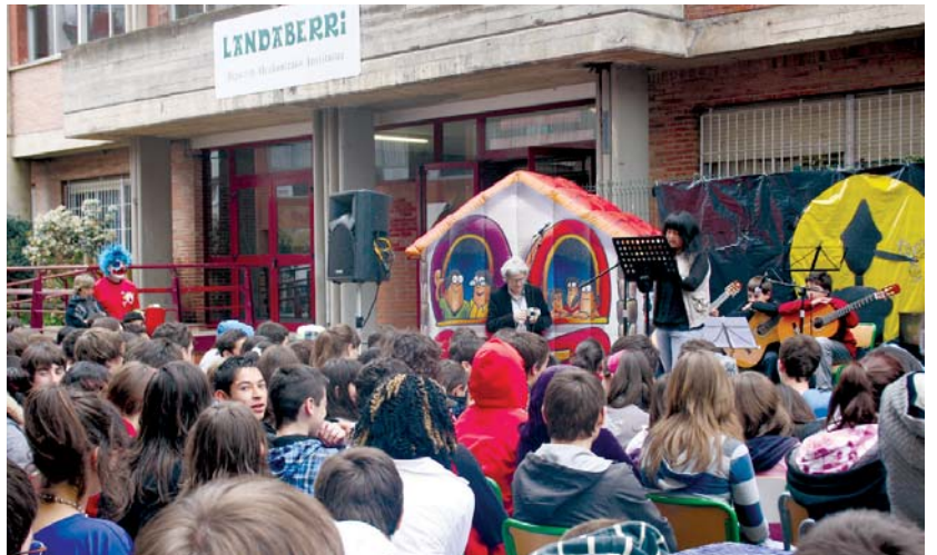
Pinotxo bederatzi hizkuntzetan entzuteko aukera egon zen ostirala eguerdian, Landaberri BHIko aurrealdean.