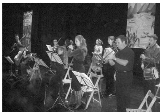
Ostegunean, esku soinu, piano, trikitixa eta pandero entzunaldia egingo da.

Musika eskolako ardura-dunek azaldu dutenez, parte hartzaile gehienak aurtien hasi dira musika tresna ikasten eta askorentzat, jende aurreko