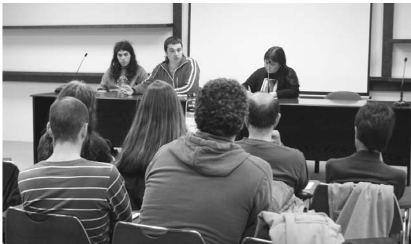
Haien esperientzia aurkezteaz gain, herritarren galderei erantzun zieten Jardunaldi Internazionalistetako hizlariak.

■ Gaur, Hogei minutu taldearen kontzertua dago Obelixen eta bihar, afaria mexikar begetarianoa Xirimiri elkarte