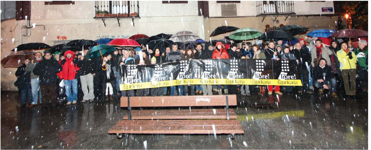
Herritar ugari bildu ziren iazko abenduan, elurrari aurre eginez, Egunkariaren aurkako epaiketaren kontra zegoela adierazteko.