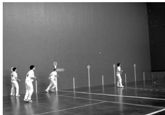
Herriarteko txapelketan, Soraluze izango da Lasarte-Oriaren lehenengo aurkaria.