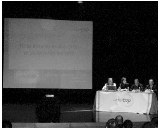
Euskara Zerbitzuetako jardunaldiak izango dira, berriro ere, gure herrian.

Aurten gainera, iparraldean hasi berriak diren udaletako euskara teknikariak gonbidatu dituzte jardunaldi hauetan parte hartzera eta haien esperientzia entzuteko aukera egongo da, besteak beste. •