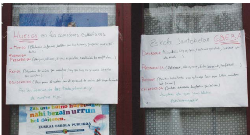
Langileen eskaerak Sasoeta-Zumaburuko jangelako atean izan dira, grebak iraun duen tarte honetan.