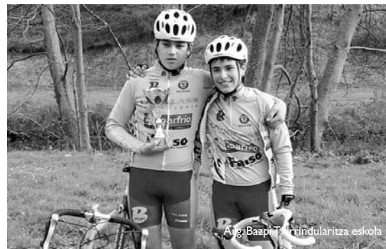
Algo Bazpi Txirrindularitza eskola