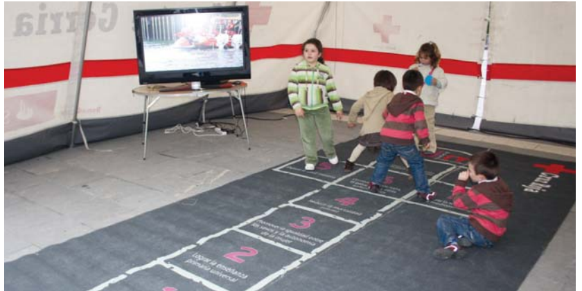
Gurutze Gorriaren erakusketan haurrek jolasteko aukera izan dute.

Galdetu al diozu zure buruari Gurutze Gorriak erreskateetan, edota larrialdietan, zein