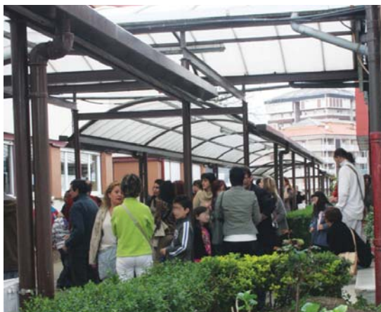
Aiton-amonak eta lagunak ziren bazkal orduan, haurren bila zihoazek.