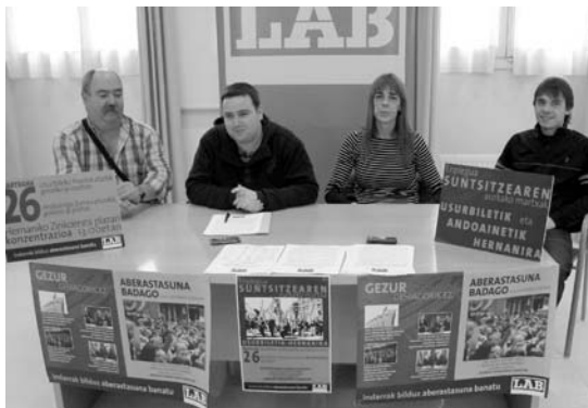
Indarrak bildu eta aberastasuna banatzeko deia luzatu du LABek.

Enplegua suntsitzearen aurkako martxan antolatu du LAB sindikatuak langileiak eta lan esparruak Buruntzaldean bizi duten gainbehera salatzen. Konkreteki, Lasarte-Oria, 2008ko uztailaren 720 langabetu izatetik otsailaren 1.329 izatera pasa da; urte eta erdian ia bikoiztu egin da, beraz, langabetu kopurua eta une honetan langabezia tasa ehuneko 15ekoa da. Martxa gaur goizeko 9:00etan aterako da Usurbilgo pilotaleku atzetik eta Hernanin gutxi gora-behera eguerdiko ordu batean amaituko da Zinkoenea plazan egingo den agerraldiarekin.