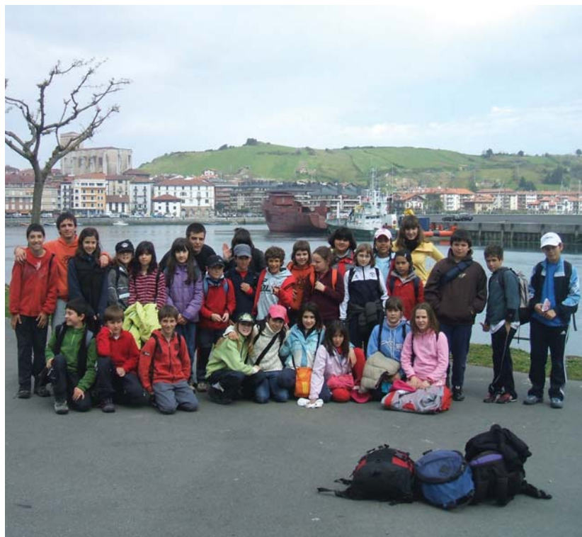
Pasa den urtean ondo aski pasa zuten Zumaian, Zarautz eta Orion. Aurtengo esperientziaren parte izan nahi?

Umeentzako esperientzia polita proposatzen dute Ttakuneko aisialdi sailetik "oporrei ongi etorria emateko modu bikaina izan daitekeelakoan gaude" dio arduradunak. Mundu guztiak behar ditu oporrak "eta ekintza honen bitartez umei, oporrak bere lagun taldearekin pasatzeko aukera luzatzen zaie" gaineratzen du Ttakuneko ordezkariek.