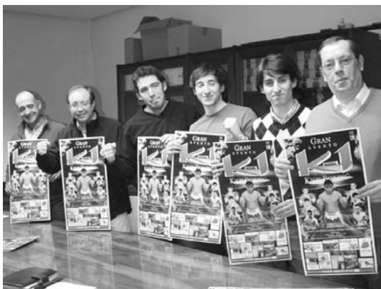
Udaleko eta Kuraia Fight klubeko ordezkariek ekitaldiko aurkezpenearan.