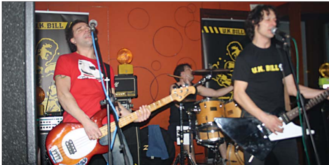
U.K. Bill taldeko kideak oso gustura aritu ziren Jalgi kafe-antzikian.