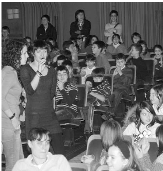
Ane eta Uxue ikusleak zirikatzen aritu ziren, baten bat gorritu ere egin zen.

4. Beste biderik ez dut izan ta, azkenean nik aitortu. Besotik bortizki heldu naute, gero zelda hontan sartu. Hemendik aurrerako bizitza: bakardade-basamortu. Zorigaitzeko amets-gaizto hau benetako zait bihurtu.