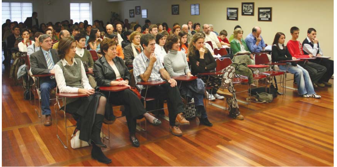
Idazle ugari hartu du parte aurreko urteetan herriko literatur lehiaketan. Irudia azkenengo urtetako sari banaketa batetan ateratakoa da.

Euskaraz eta gazteleraz sari bana emango da Ipuin eta Poesia ataletan. Gainera herrian eroldaturik daudenek "Lasarte-Oria" sari berezia eskuratzeko aukera izango dute. Sariak 1.000 eurokoak dira sail bakoitzean eta herriko lan onenek 300 euroko saria eskuratuko dute. Beraz 1.000 euroko lau sari izango dira eta 300 euroko beste lau, ipuin eta poesian, euskaraz eta gazteleraz. Aurreko urteetan sarituak izan diren pertsonak ezingo dute berriro saria jaso zuten sailean parte hartu.