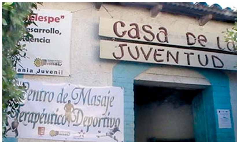
Lasarte-Oriako Udalaren laguntzarekin ireki berri den Masaje terapeutikoko zentroa, Ibonek zuzentzen duena.

“ Ekimen horien guztien helburua gazteak gauzak egin eta gazte taldeetan edo maretan ez sartzea da