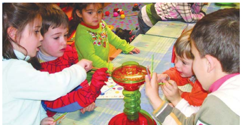
Umeek aste santuan elkarrekin jolasteko aukera dute. Martxoaren 24ra arte dago epea zabalik. Plazak mugatuak dira.

Aipatutako egunetan Goizeko 09:00etatik eguerdiko 13:30ak arte jolasean aritzeko aukera izango dute Txokoetan izena ematen dutenek. 80 euro ordaindu beharko du haur bakoitzak baina Amaraun ludotekan matrikulatuen ehuneko 10eko beherapena izango dute. 2001 eta 2007 urte artean jaiotako haurrentzat irekia dago matrikula epea martxoaren 24ra arte. Dena den plazak mugatuak dira eta bizkor ibiltzea gomendatzen du Ttakun elkarteak. Informazio gehiago