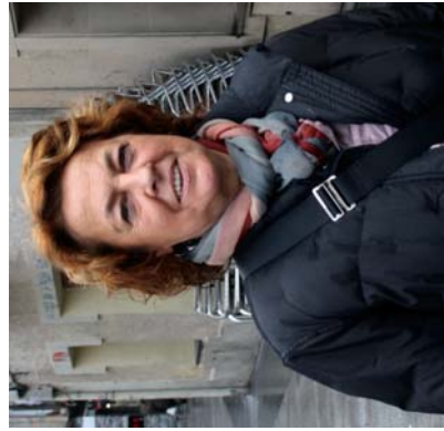
Eguneroko bitzian euskarari lekua egin eta bertan murgiltzen dira.

"Kantuan aritzea gustuzten zaizula, Xumela abesbatza duzula, kultura, kondairak, ohi-tura eta ibilteza duzula gustuko? Oinatz talde zure zain dago. Aliz eskutian dagoela zure trebezia, ba eskulanean ikastean parte har dezakezu. Ordu zure zaleatasuna pota-trean dagoela, lasa, horretan dek egin duite horren aldeko apustua, zuk gure sarean sartu ere euskaraz aritu zaitzake. Ostegunero 20:30etan jalgin izateko apostua".