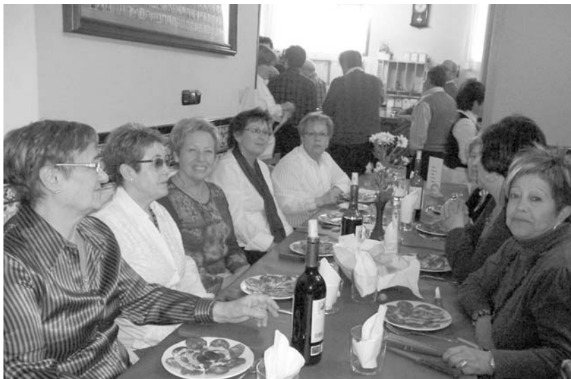
Igandean ohorezko ardoa eskainiko zaie Semblanteko bazkide eta gonbidatuei. Ondoren elkartean bazkalduko dute.

Hala ere, nahiz eta proiektu saiakera hutsean geratu, esperantza badute antolatzaileek, "noizbait lortuko dugun segurtasunarekin," hitzekin amaitzen baita oharra. •