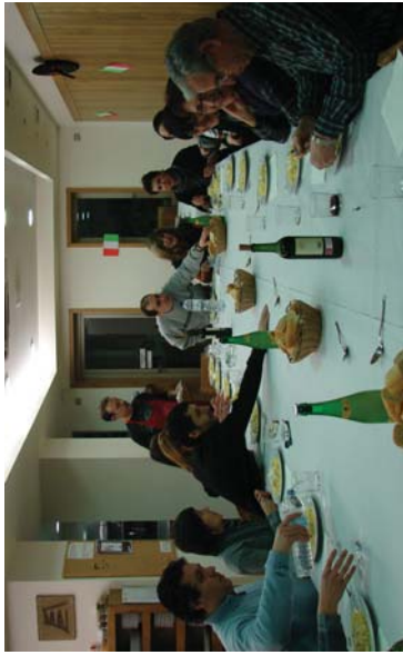
Solaskide programa euskaraz auzerik auzerik gehiago, harreman eta erlatzo sendoak ateratzen dira bertatik.