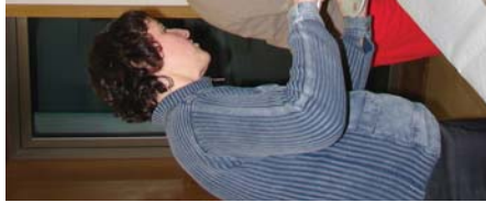
Propaganda omena ahoz ahoko izan da, horretan lotu du programa honek gorantzko joera nabaria.

Euskaldun zaharren eta euskaldun berrien artean, auzerik auzerik eta giza harreman garrantzitsuek sortzen dira. Herrian jada 80 solaskide egin duite horren aldeko apustua, zuk gure sarean sartu ere euskaraz aritu zaitzake. Ostegunero 20:30etan jalgin izateko apostua".