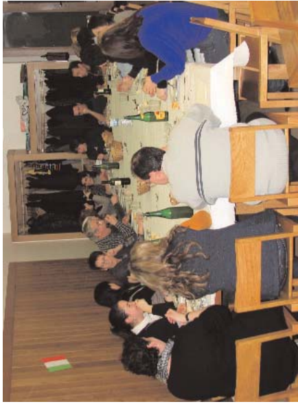
Maipei baten inguruan aritu ziren 28 solaskide, jan eta jai: hitz eta pizza.

12 urte pasa dira Solaskide programa Lasarte-Orian abiatu zenetik. Hasieran taide handitan bitzen ziren euskaldun zaharrek eta euskaldun berriak elkarrekin hitz egiteko. Duela bi urte birakuntza eman, eta orain taide xikitzen bitzen dira, gehienez lau euskaldun berri eta euskaldun zahar batekin taidea osatuz. Gainera, orain parte hartzen dituzten zalebatasunak arreta gehiago jartzen da, inguruko profila dituenak elkartzeko. Hala ere, euren taldeetara soilik ez mugatzeko, eta harremanak sortzeko atari ederra antolatuta zuten pasa den ostegunean. Lotsak kenduz, euskaraz gozatu zuten.