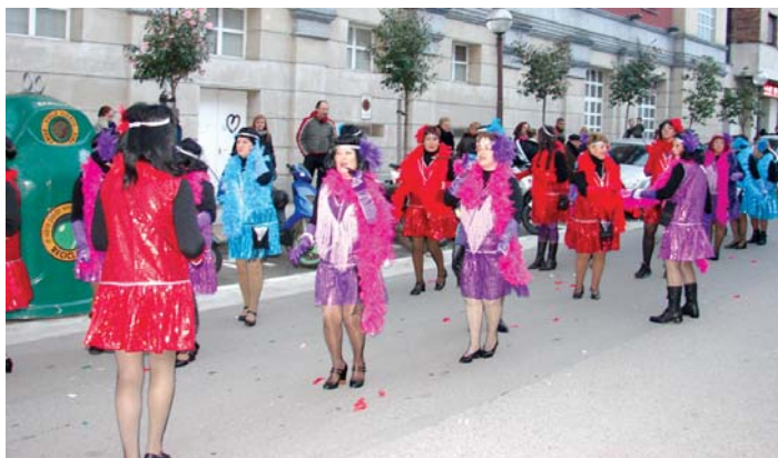
Emakumeen Zentro Zibikoko kideek Charleston dantza menderatzen dutela erakutsi zuten.