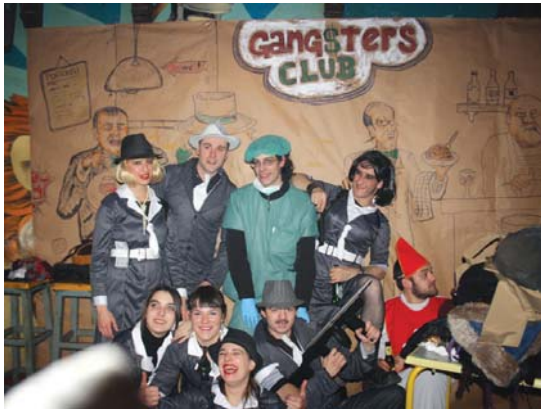
Obelix tabernan gansterrak ziren nagusi!