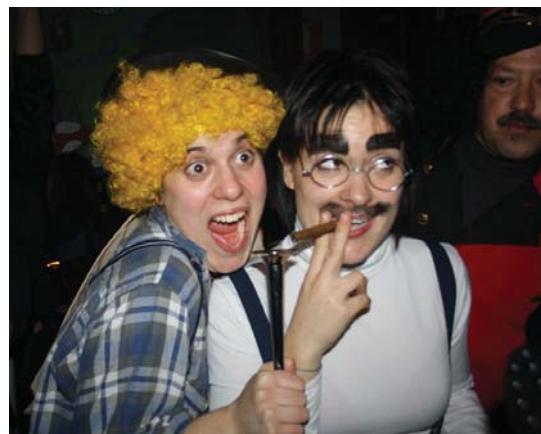
Groucho eta Harpo, Marx anaiak ere topatu genituen.