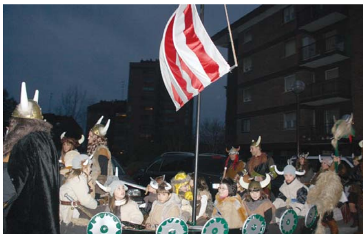
Zakilixut taldeko bikingoen konpartsan haurrek eta helduek ederki gozatu zuten!