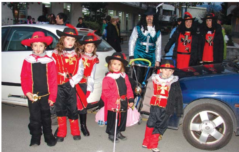
Mosketero kuadrilla ederra topatu genuen larunbat arratsaldean.