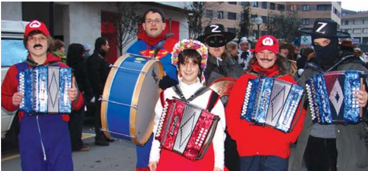
Udal Musika Eskolako taldeak ederki girotu zuen desfilea!