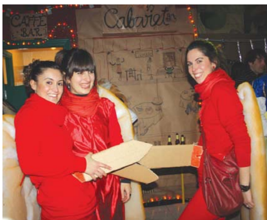
Kontuz, txintxetekin harrapatuta geratu gabe!