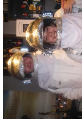
NOSeko astronautak ere Lasarte-Oria ihili ziren.

“ Herriko taberna asko zeuden aurtun dekoratuta, eta horrek oso giro ona sortu zuen herrian