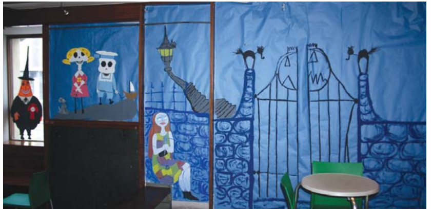
Tim Burtonen filmografiako irudiekin dekoratu zuten Jalgi kafe-antzokia.