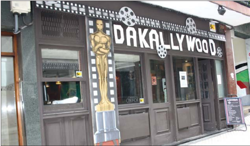
Elegante zegoen Dakara taberna, Oskar saria eta guzti.

Aurten inoiz baino taberna gehiago dekoratu dituzte, eta horrek lagundu du herrian giroa sortzen.