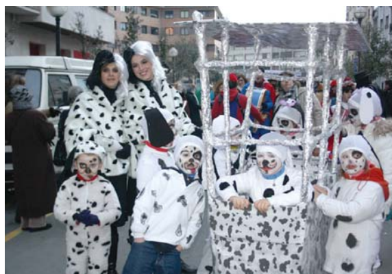
Ludotekako haurrek goxo-goxo zeuden moztorra horiekin!

www.txintxarri.info web atarian dituzue ikusgai eta eskuragarri inauterietako argazki gehiago