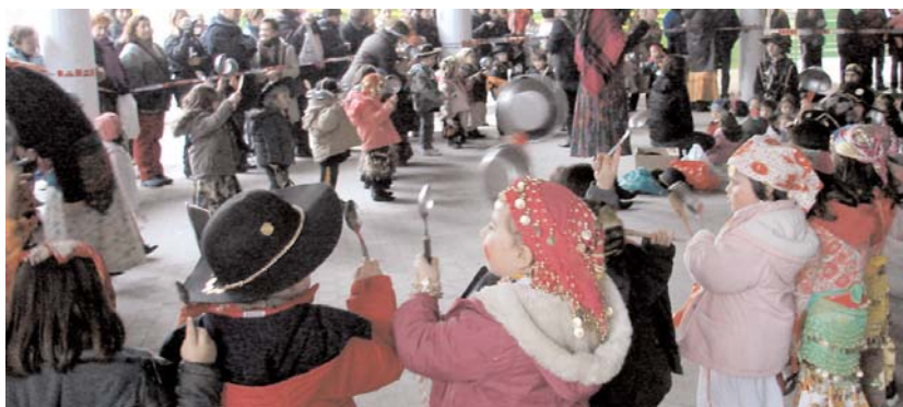
Sasoeta-Zumaburukoek kaldereroak ospatu zituzten.

L auteriei ongi etorria ematen lehenak haurrak izan ziren ostiral arratsaldean. Herriko ikastetxeetan, urtero bezala, jaialdi politik antolatu zituzten.