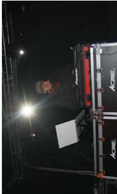
Ditlo festa egon zen Andatza plazan goizaldeko ortu txikiak are.