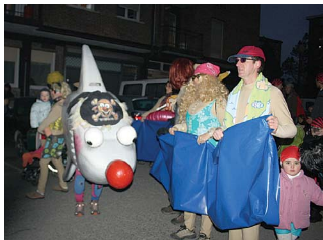
Eskerra Zabaleta Auzoko konpartsako marrazoa ez zen filmekoa bezalakoa!