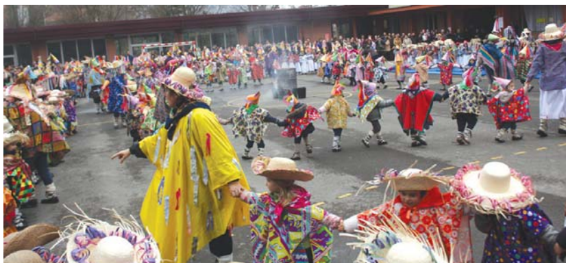
Landaberri ikastolako txikienek Euskal Inauteriak ospatu zituzten.