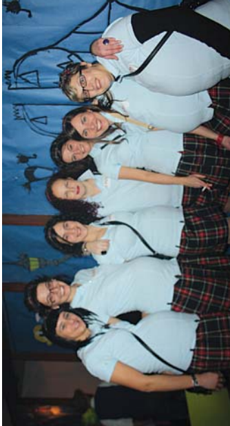
Hauak ere telebista-koak bazal, botera, genua diru haundun? Eskernak inauterak ditren..

“ Herriko taberna asko zeuden aurtun dekoratuta, eta horrek oso giro ona sortu zuen herrian