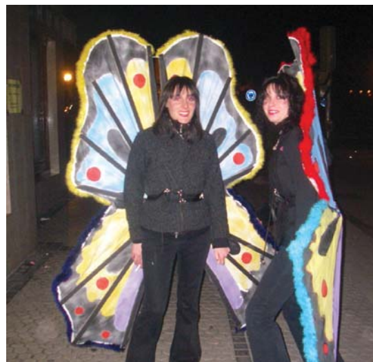
Tximeleta bereziak, gauze ere ateratzen direnak!