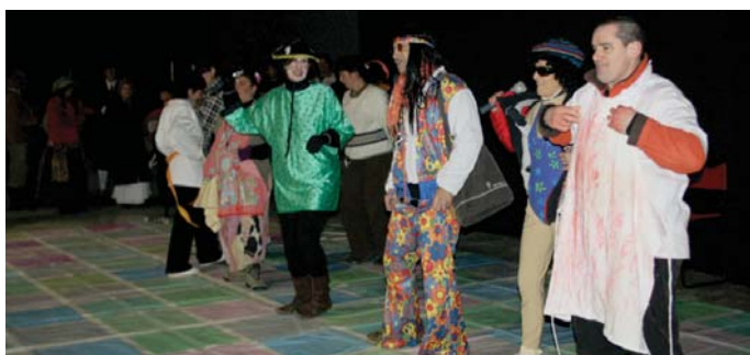
Kastina egitera etorri zen antzerki taldeak striptease berezia eskaini zuen!