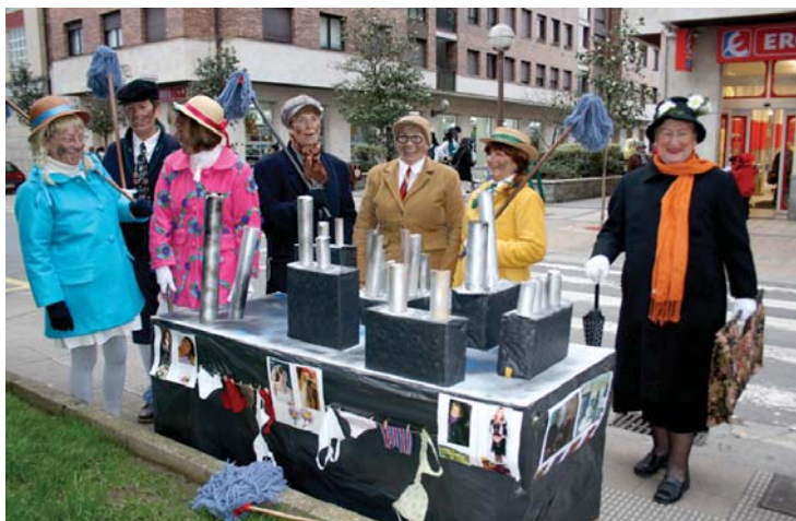
Mary Poppinsek ere ez zuen desfilea galdu nahi izan. Bejon deizuela kuadrilla!