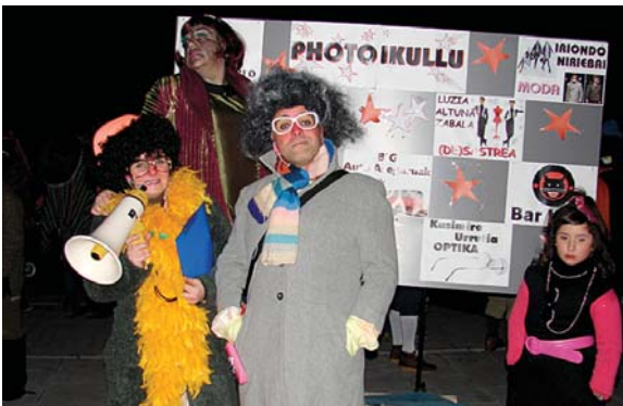
Pelikula ederra grabatu zuten azkenean bi zuzendari hauek!