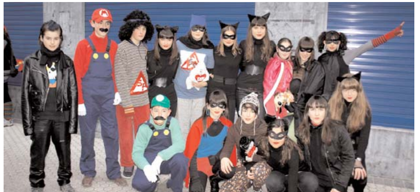
Desfilean ez zegoen zertan kezkatu, arazoei aurre egiteko Superheroriak zeuden!