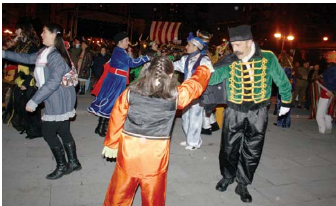
Erketz Dantza Taldekoek munduko dantza ezberdinen erakustaldi ederra eman zuten.

H otz handiari aurre eginenez, jende ugari bilduzen Iñigo de Loiola kalean desfilean parte hartzeko asmoz. Giro alaiean eta ondo pasatzeko asmoz, ehundaka lagun ibili ziren herriko kaleak alaituz desfilean.