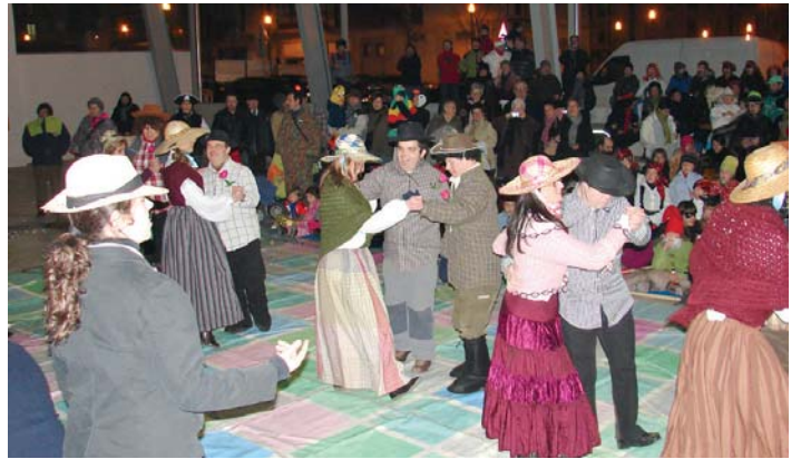
Jalgunekoek emanaldi politta eskaini zuten, lortu zuten anaiak eta andregaiak elkartzea!