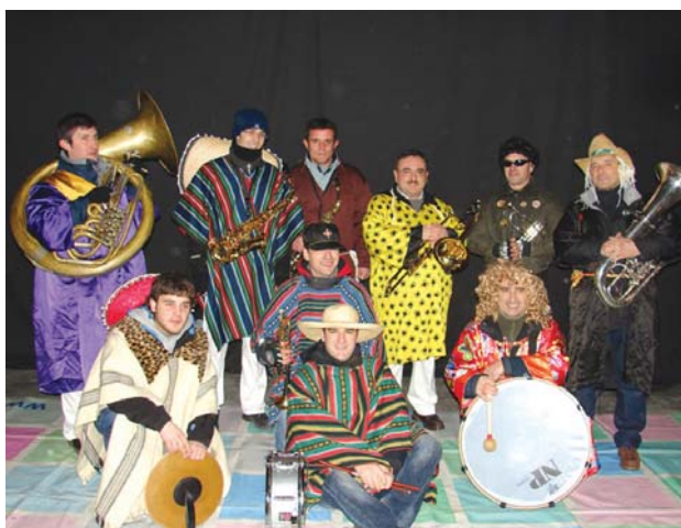
Oriako Txarangaren lagunek herriko kaleak alaitu zituzten desfileareki batera.