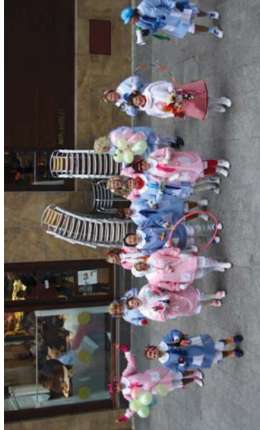
Umore bikaina emakume kuadrillak honetk duenak!