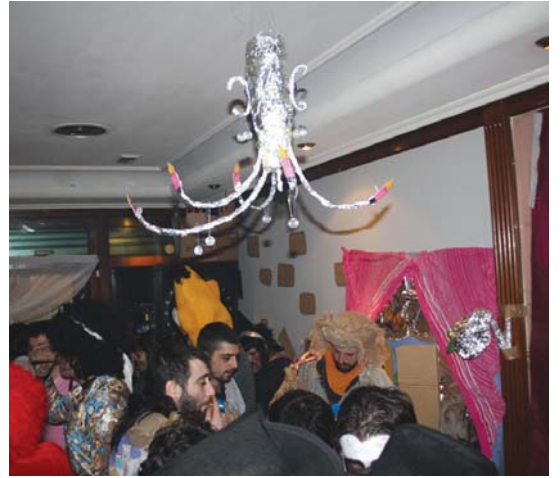
Sustrai taberna gaztelu batean bihurtu zuten.