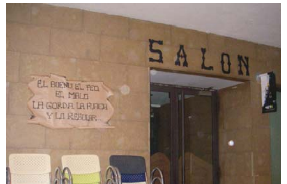
Buenetxea tabernak berriz, iraganera egin zuten salto.