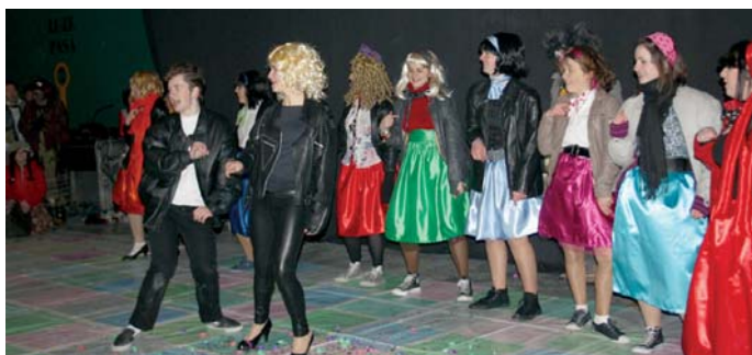
Greaseko kideek erakustaldi polita egin zuten, azkenean frontoi osoa kantari jarri zuten!