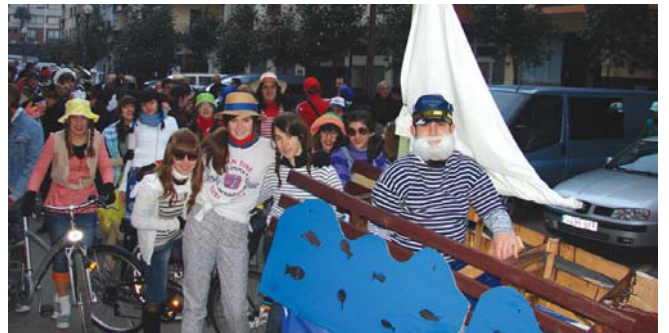
Txankete ez zen bere txalupatik mugitu!