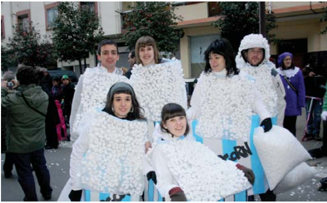
Zineman ezinbestekoak izaten dira palomitak! Desfilean ere bai!