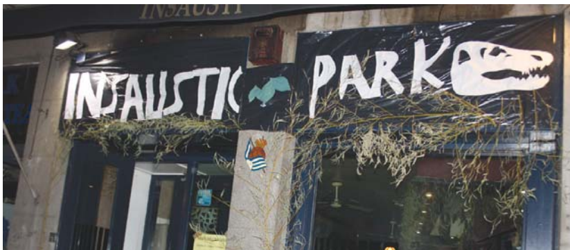
Insausti tabernan dinosauroak azaldu ziren!