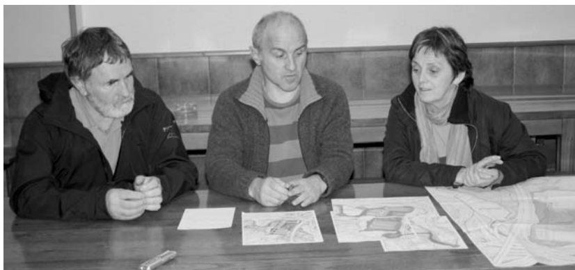
Udal agintariak industrialde politikarik gabe ari direla salatu dute ezker abertzaleko zinegotziek.