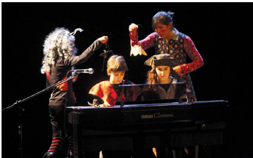
Txokoetako gaztetxoek rap berezia eskaini zuten. Taula gainean mozorroez gain, munstro eta ezusteko ugari egon ziren.