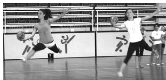
LOKEko taldeak martxoak 7an Udaberriko Torneon izango dira Astigarragan.

aukera gehien jardunaldi honetan 4. postua eskuratu duelako," aipatu du.