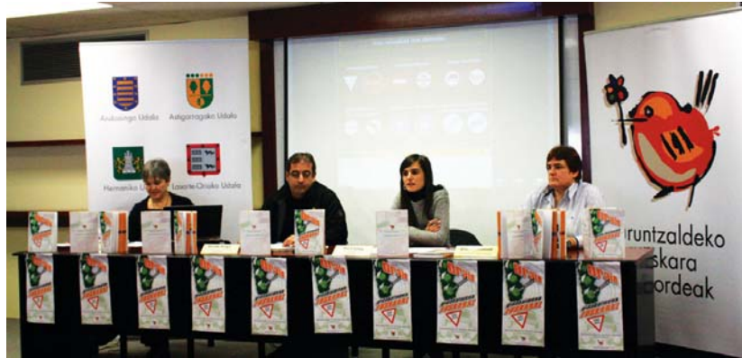
Prentsaurrekoan Buruntzaldeko herritarrek auto-eskoletan gidabaimena euskaraz ikasteko duten materiala aurkeztu zen.