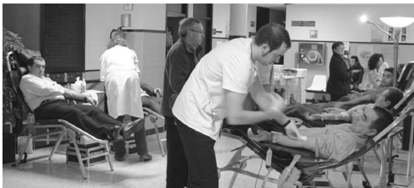
Odol emaien ordezkartzako datuen arabera, odolbeharrei erantzuteko kopuruen ratioaren azpitik dago gure herria.