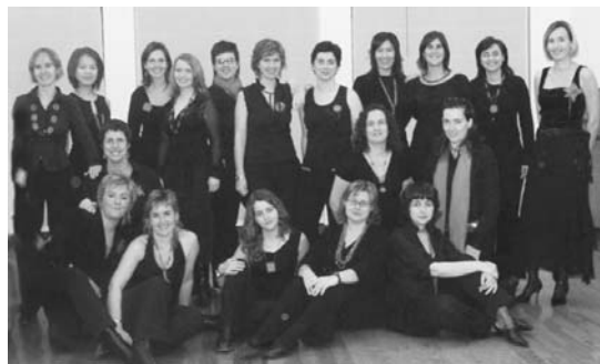
Nayade abesbatzak eliz musika eta euskal folklorea eskainiko du ostiralean.

Hamar urte hauetan, kontzertu ugari eskaini ditu eta lehiaketetan ere parte hartu du hainbat sari eskuratu, hala nola, Zumarragako La Anti-