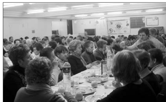
Lasarte-Oriako Misio taldeak afari solidarioak antolatzen ditu urtean zehar.

Alkatetzak barkamena eskatu nahi du sortu daitezkeen eragozpenengatik eta bizilagunen laguntza izango dutelakoan daude. •