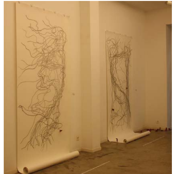
Amaitu gabeko paper-bildua, jarraipenik izango al dute obra hauek?

Hemendik hona, aldrebes, gauzak modu errizomatikoan mugitzen dira. Mugimendu horietan, gauzak nahasten edo bizitzen dira. Beraien