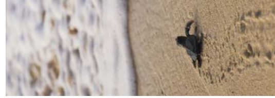
Dortoka jolaberria itasora bidala.