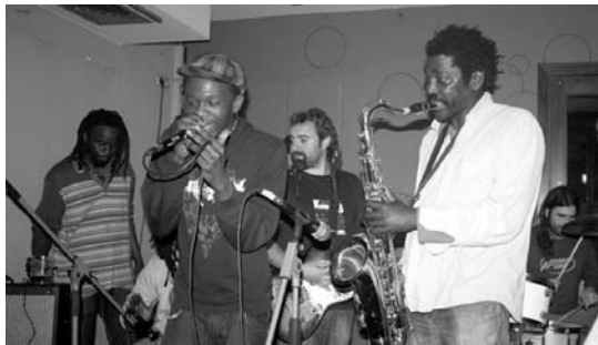
Giro ezinhobea egon zen Jalgin ostiraleko jam sesioan.

Herritar asko hurbildu ziren jam sesiora eta izugarriko giroaz gozatu ahal izan zuten. Erritmo afrikarrez osatutako erreporitorio bikaina eskaini zuten jam sesioan parte hartu zuten guztiak. Bi ordu luzez aritu eta gero, merezitako txalo zaparrada jaso zuten ikusleek eskainita. •