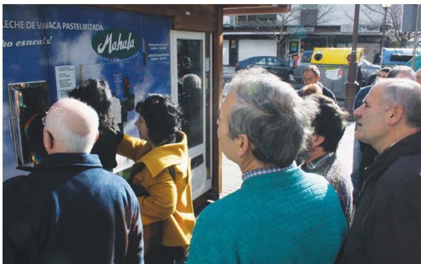
Alkatea izan zen lehena makinatik esnea hartzen. Herritar ugari bildu zen makinaren nondik norakoak ezagutzeko.