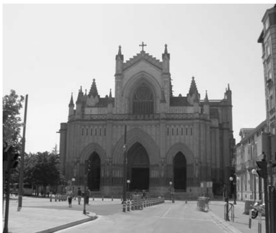
Gasteizko alde zaharra eta katedrala ezagutuko dituzte Oinatzeko partaideek.

Autobusez joango dira Gasteizko hirira. Goizean, Artium museoa ikusiko dute goizeko 11.30etatik aurrera. Bisita gidatua izango da eta lasarteoriarrek museoa dauden artelaren berri izango dute euskaraz, noski. Eguerdian alde zaharra ikusi eta