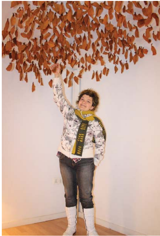
Magnolia hostoak naturarekiko konexio bat sortzeko nahiarekin ezarrita.

Interdiziplinarra. Diziplina ezberdinak nahasten ditut. Erakusketan honetan ikusten ditugunak zer dira marrazkiak edota eskulturak? Bakoitzari erabakitzen uzten diot. Nik hemen erakusten ditudan marrazkiak dira, baina ikusi gabe marrazturikoak. Nik paisaiak edota gorputzak begiratzeko ditut soilik, nire eskua libreak marrazten du, eta