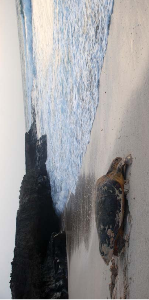
Dortoka emeak gauaz arantzadien diran arantzadiak jarrezko toki egoki bila. Buzumetan hain jantzien dute eta bestetan ez, baina egunentzako izurletan diran itasora. Informazio hori gurea jasozten zuten egunero ikertzen.