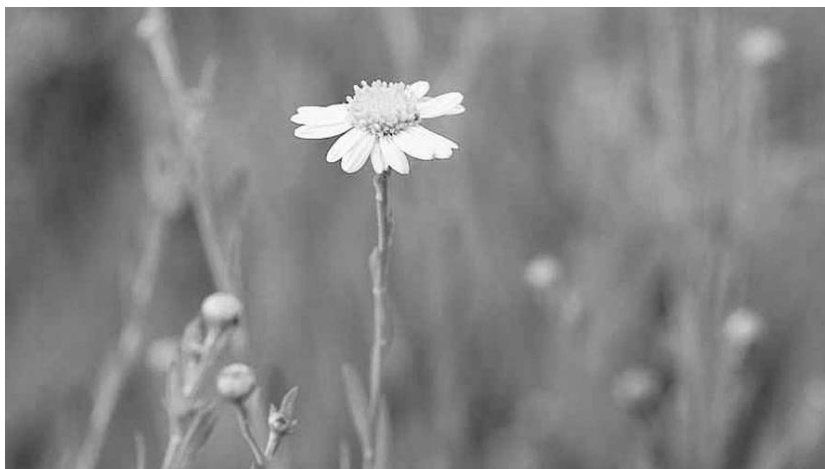
Gehien erabiltzen diren sendabelarrak eragutaraziko dira eta bi ukendu egiten erakutsiko da, hilaren 25ean Xirimirin.

Hala ere, penaz aitortzen dute Ttakuneko ordezkariek denentzako kaltetan ezagutza ugari galdu dela hain juxtu isilpean erabili izan direlako, eta azken finean jokabide eta ohitura horiek baztertzeko joan garelako. "Ez inondik ere euren eraginkortasuna zalantzan