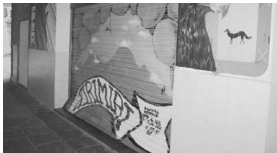
Xirimiri elkarteko pertsiana puskatu zuten, baina ez zuten barrura sartzea lortu.

Ez da lehenengo aldia elkarteak horrelako erasoak jasaten dituen, duela lau urte lortu zuten sartzea. Kanpoan dituzten ikurrina eta banderak ere behin baino gehiagotan puskatu edo desagertu dira eta horregatik, azken aldiari ez dituzte jartzen. •