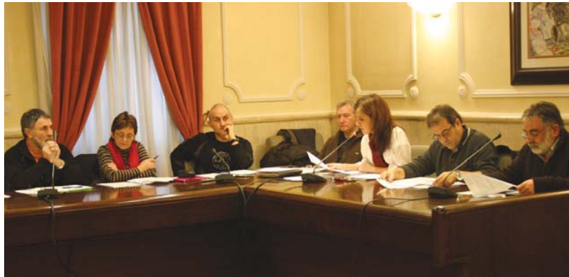
Mozio alternatiboa aurkeztu zuen oposizioak, baina ez zen aurrera atera.

Mozioa ez zen onartu oposizio osoak aurka bozkatu baitzuten. Oposizio taldeek