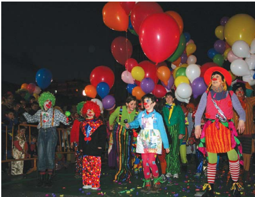
Gaur arratsaldean erabakiko da aurtengo inauterietan Ttakunekok jantziko duten mozorroaren gaia. Iaz zirkoa izan zen.