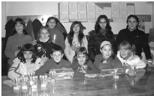
Irudian herriko parte-hartzaileak beraien sari eta oroirarekin.