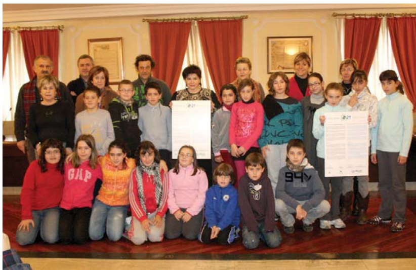
Lasarte-Oriako Udalak, Eusko Jaurlaritzak eta herriko ikastetxeek Eskola Agenda 21eko helburuak betetzea espero dute.

laritza baten edo laguntza-entpresa baten bitartez, proposamenei erantzun eta ikastetxeei lagunduko diete.