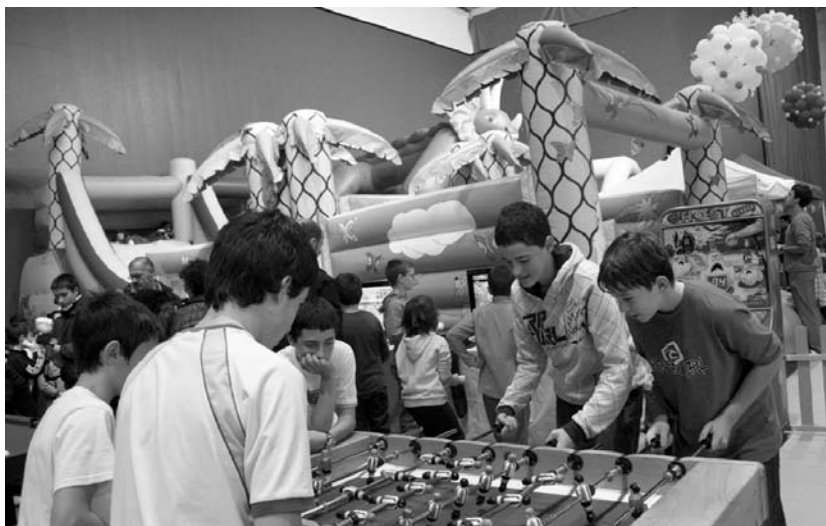
Udalaren datuen arabera, 8.000 pertsona baino gehiago igaro dira Michelingo frontoitik parkea egon den 12 egunetan.