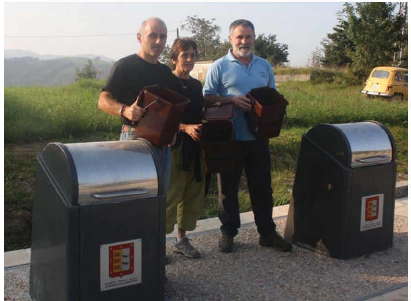
Ezker abertzaleko zinegotzien ustez, atez ateko zabor bilketa sistema da erraustegiaren alternatiba.

Gainera gogor salatzen du Ezker Abertzaleak informazio hain mugatua ematea, hau da, energiaren sorkuntza eta hon-