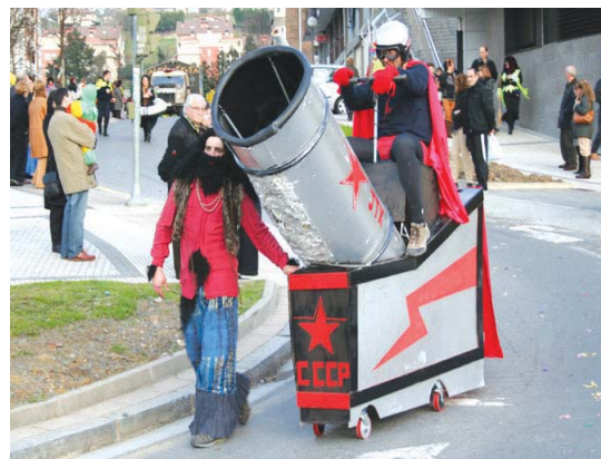
Zirkoako hainbat pertsonaia ikusi ziren iaz mozorrotuen kalejiran.

Iaz koordinatu zuen Ttakunek lehen aldiz Inauterietako kalejira. Aurten berriro egingo da otsailaren 13an