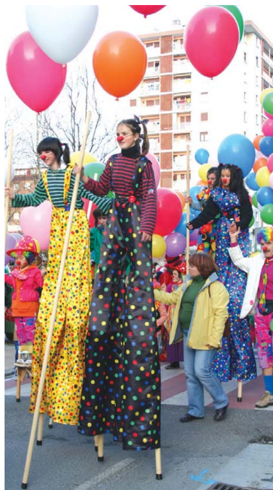
Adin guztiakok hartu zuten parte kalejiran.