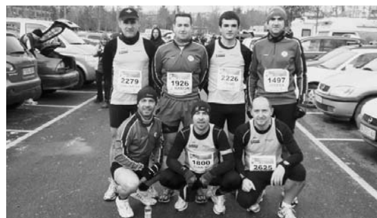
Gasteizko maratoi erdian parte hartu zuten Ostadarreko korrikalari batzuk.

Eta urteari era osasuntsuan agur esatko, Donostiako San Silbestrean ere herritar ugari parte hartu zuen. •