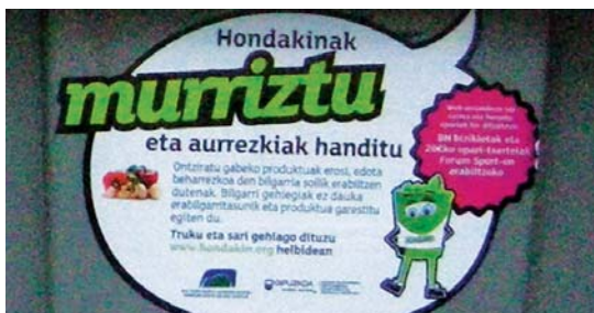
Herriko edukiontzietan jada aurkitu ditzakegun mezuari-ko bat

Gainera, ikasteaz eta kontzientziazteaz gain, parte-hartzaile guztien artean hiru BH bizikleta tolesgarri eta Forum Sporten 20 euroko 100 txartel zozketatuko dira. Ez galdu ikasi eta sari batekin egiteko aukera. •