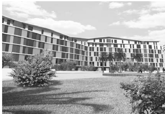
Babes Publikoko Etxebizitzaren erregimena Arautzeko Ordenantza onetsi zen.

Era berean, Lasarte-Oriako fededunei jakin arazten zaie, hau izango dela larunbata arratsaldean herrian egingo den elizkizun bakarra. •