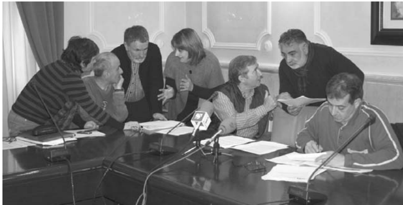
Bost minutuko atsedendian, oposizioa egoera aztertzeko eta erabakia hartzeko bildu zen

Bi hilabeteko epea izango du lan taldeak eginkizuna