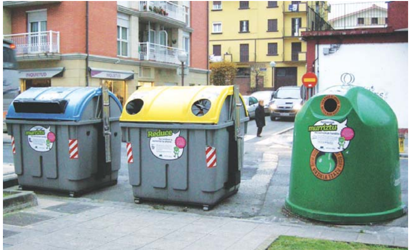
Edukiontzia pertsonalizatu dira birziklapenaren kontzientziazio kanpaina berrirako.

Edukiontzia mota bakoitza, bai organikoa, bai ontziak, bai beira, bai papera... pertsonalizatuta egongo da, begiak irudikatu nahi dituzten binilo