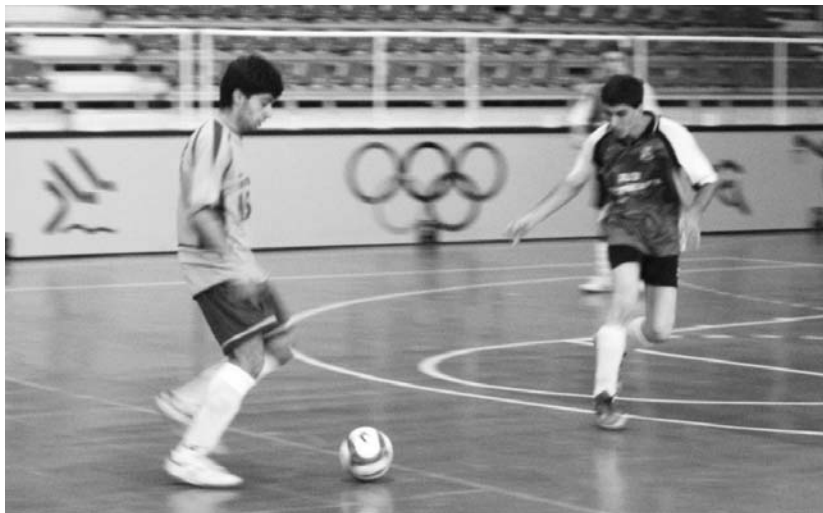
ISU Leihoak taldea bi txapelketetan, Gipuzkoako Ligan eta Herriko txapelketan sailkapeneko lehenengo postuan dago.

Lehenengo itzulua amaitzeko hiru jardunaldi geratzen direla, lehia gogorra dute bi