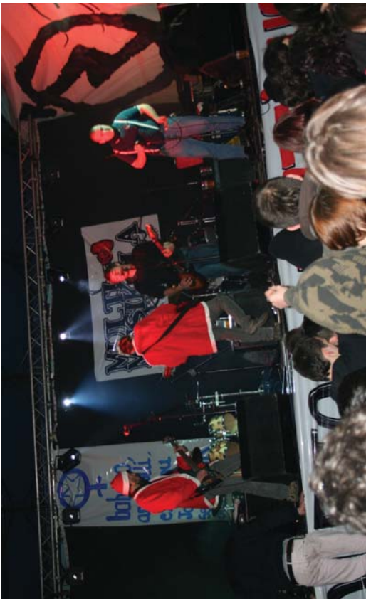
Asteburu honetan, bilar eta etzi, Multimusikala jaialdia, eguingo da Lasarte-Orian. Asteleheneran Santo Tomas eguna izango da.