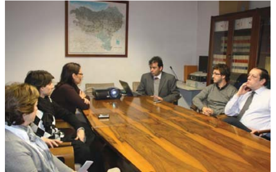
NBGPko Julio Portielesek proiektuaren berri eman zion Udala Gobernuari.

Era honetara, lankidetzeta deszentralizatuari garrantzia ematen diotela azaldu zuen. Eta lagundutako herrialdeko instituzioen eta laguntzaileen