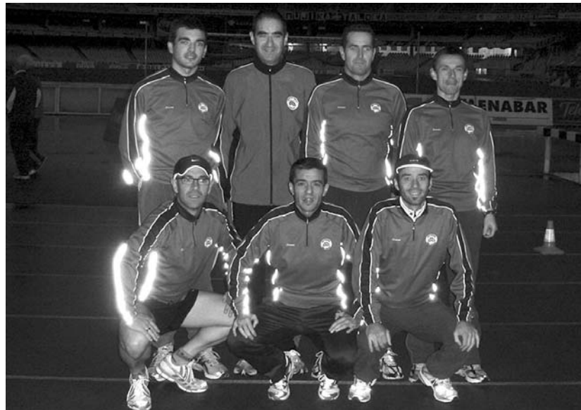
Ostadar K.E.-ko korrikalariak igande goizean, Donostiako Maratoian parte hartzeko irrikaz.