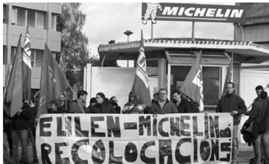
LAB sindikatuko delegatuen babesa izan zuten lehenengo kontzentrazioan.

Horregatik, Euleno langileek, hil honetan egunero 13:00etatik 15:00etara kontzentrazioak egingo dituzte Michelingo enpresaren aurrean. •