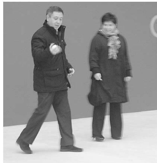
Frontoiko lehenengo tantoak alkateak eta Estatuko ordezkariak egin zituzten.