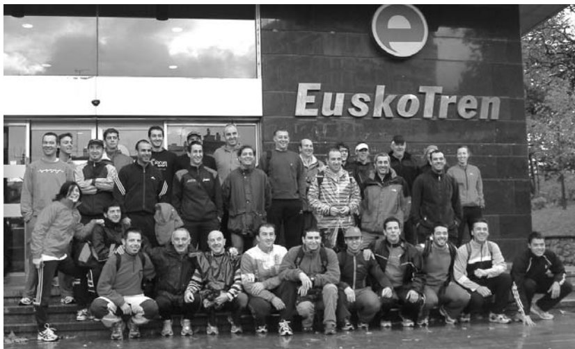
Lasarteoriatar batzuk atzo goizean Euskotren geltokian Behobiaruntz abiatzeko prest.