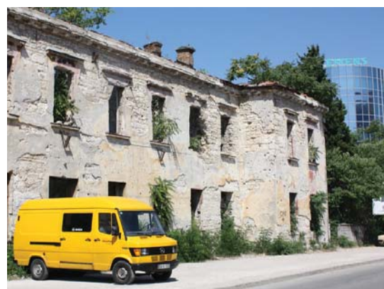
Bosniak eskaintzen dituen paraje kontrajarriak. Guda garaiko edifizio hutsa, bonbarketan arrastoekin eta alboan, etxe-orratz moderno bat.