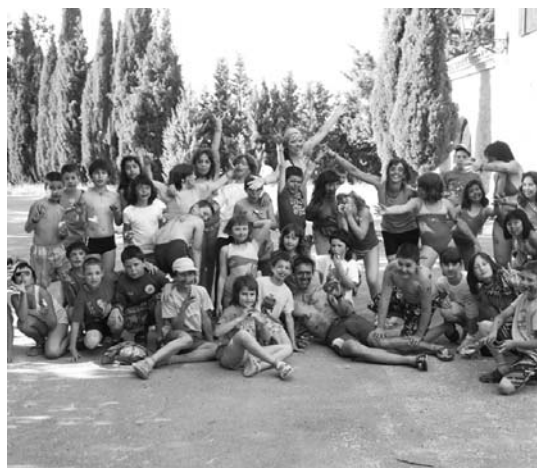
Aldrebes egunean ederki pasa zuten Mendigorriako kanpaldiko gaztetxoek.

Arratsaldeko 17:30etan dute hitzordua Udako txoko eta Kanpaldietako gaztetxoek.