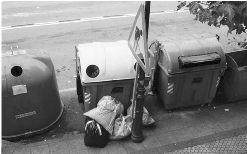
Hondakinen bilketa eta estolderiaren zergak izango dira hurrengo urtean goberna gehien jasango dutenak.

Izan ere, EAJk aipatu zuenez, aurtengo egoera ekonomikoari buruz ez dio oposizioari