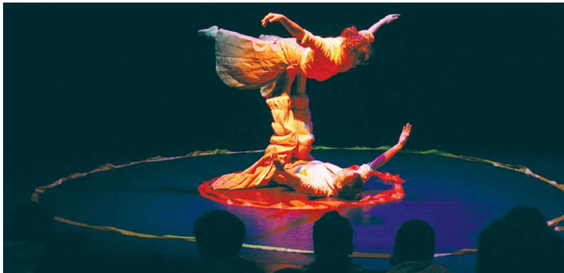
Hogei bat haur bildu ziren kultur etxeko aretoko oholtza gainean, Da Te Danza taldeko kolore eta mugimenduz betetako Tondo Redondo lana ikusteko.