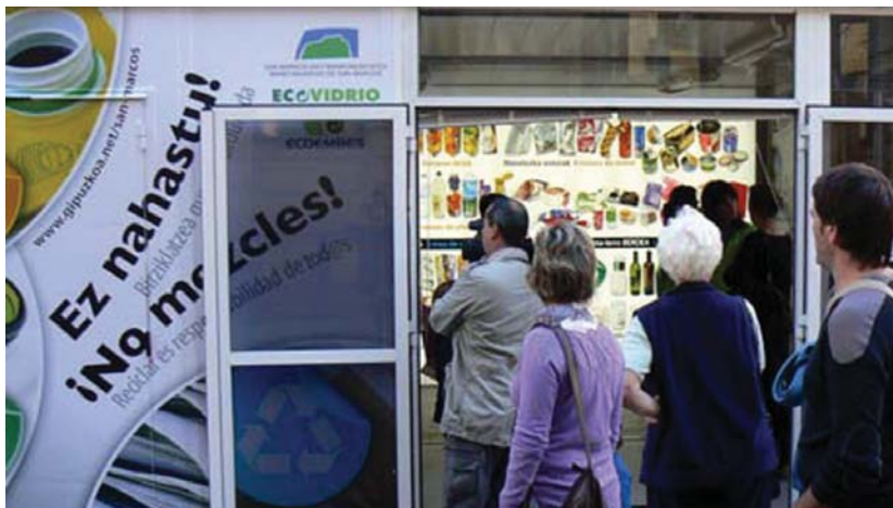
Erakusketa ibiltariarekin batera informazio gune bat ere ezarriko da Ardatza Plazan.