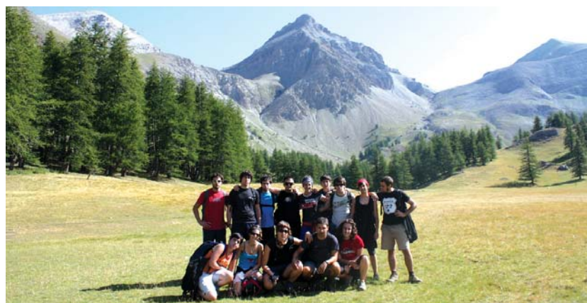
Pareja ezin hobea gazteek aukeratu zutena bidaiari hasiera emateko, Montpelat mendia, Alpetan.

Gurpil zulaketak, Azucar Moreno Sarajevon egindako parrandan entzutea, gasolina gabe geratu, multa jaso, gutxi dutxatu, muga bateko hesia apurtu, Dachau kontzentrazio kanpoa ezagutzeko aukera, bidai intentsua eta dibertigarria. 20 eguneko Europa ezagutzeko. Hemen bakarrik bidaiako lehen platera eskaini da, bigarren platera eta postrea dastatzeko gogoia izanez gero, www.blogari.net/ttapa-ttipi blogean, edota asteazkenean, Jalgi kafe-antzoikiak gaueko 21:30ean aukera paregabea. •