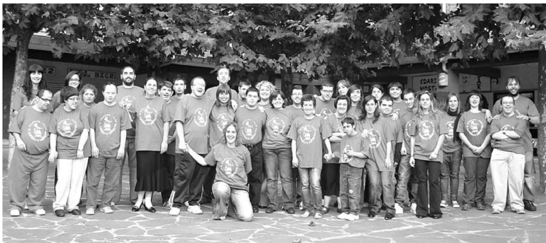
Guztira berrogei parte-hartzailek hartu zuten parte Also tabernan larunbat arratsaldean Jalgune taldeak ospatu zuen txapelketa kooperatiboan.