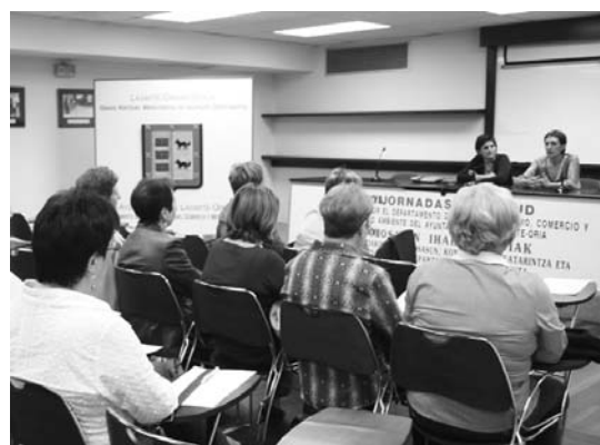
Asteartean, emakumeek pairatzen duten bularreko minbizi aztertu zen.