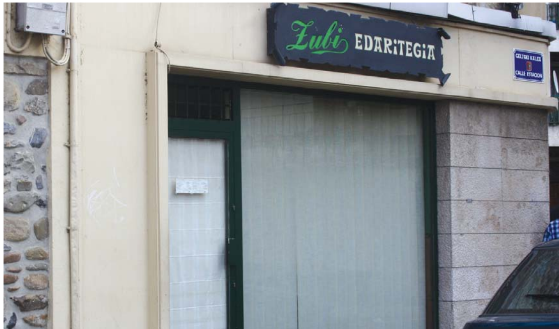
Zubi tabernaren atea horrela aurkituko ditugu hemendik aurrera, itxita.