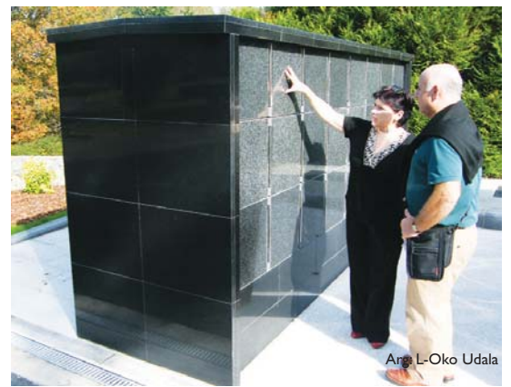
Arg. L-Oko Udala

Horren ondorioz, kolonbarioa eraiki da. Izan ere, alkatearen hitzetan, "gure helburua da egungo beharrei egokitzea eta herritarrei zerbitzu osoa eskaintzea". •