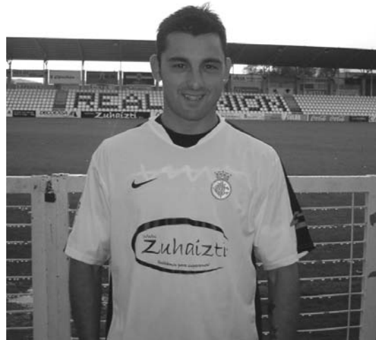
Gorka Brit Irungo Stadium Gal futbol zelaian aurtengo taldeko kamisetarekin

Oso kontent jarri nintzen. Baina era berean, lasaitasun puntu bat ere lortu nuen. Aurrendenboraldian ez nuen golik sartzea