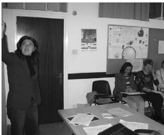
Ikastaroa Danok kide eta Esperanza Latina elkarteak antolatua da.

Besteak beste, ikerketa, aholkularitza eta zerbitzu kudeaketak egin ditu, baita eguneko arreta zentroetan eta erretiratuen zentro sozialetan esku-hartzeak ere.