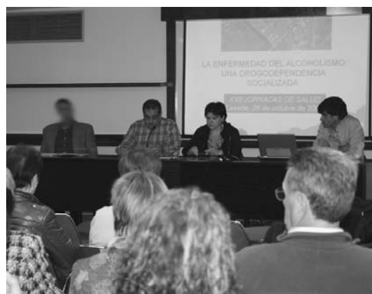
Osasun Jardunaldien hasierari emateko udal ordezkariak hitz egin zuten.

Hala ere, gure herrian Osasun zentroaren datuen arabera, kolon minbiziaren sentibilizazioa handia dela azpimarratu zuten. •