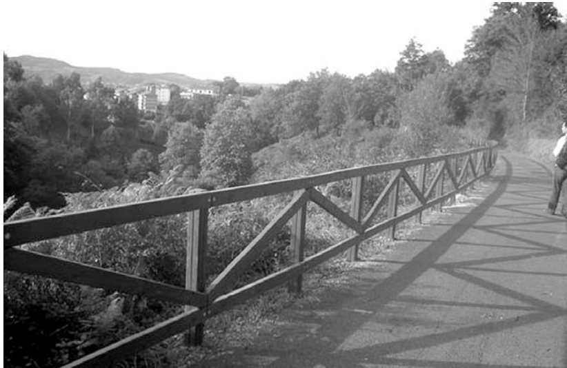
Garai batean Plazaolako trenak egiten zuen bidetik pasako da ibilbideetako bat.

Seinale horiek guztiak udal-herri bakoitzaren identifikazio kolorea aintzat hartuz daude