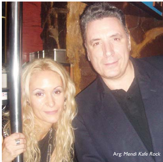
Arg. Mendi Kafe Rock

Era berean, Mendi Kafe Rock tabernak eta Drakos Custom elkarteak eskerrak eman nahi dizkiote Lasarte-Oriako Udalarari, izan duten elkar ulertzearengatik eta, era erosoan, ibilgailuak Dorre parkean aparkatzen uzteagatik. •