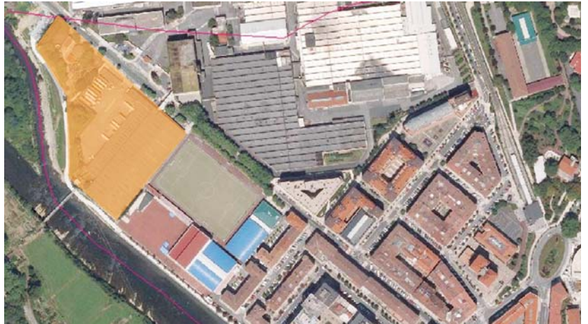
Laranja kolorez dagoen zatia da Michelin fundazioak Udalari proposatutako lur eremua.

egingo ditu elkar-tee berriak, batetik Hernaniko Udalak Galarretan egingo duena eta bestetik Michelin fundazioak Lasarte-Orian egingo duena.