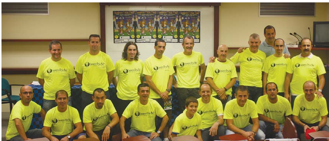
Ostadar K.F.-ko atletismo saileko korrikalariak kamiseta teknikoarekin atera zuten argazkia prentsaurrekoa bukatzean.

■ Irteera-helmuga eta ibilbide aldaketak herrian dauden lanak direla eta