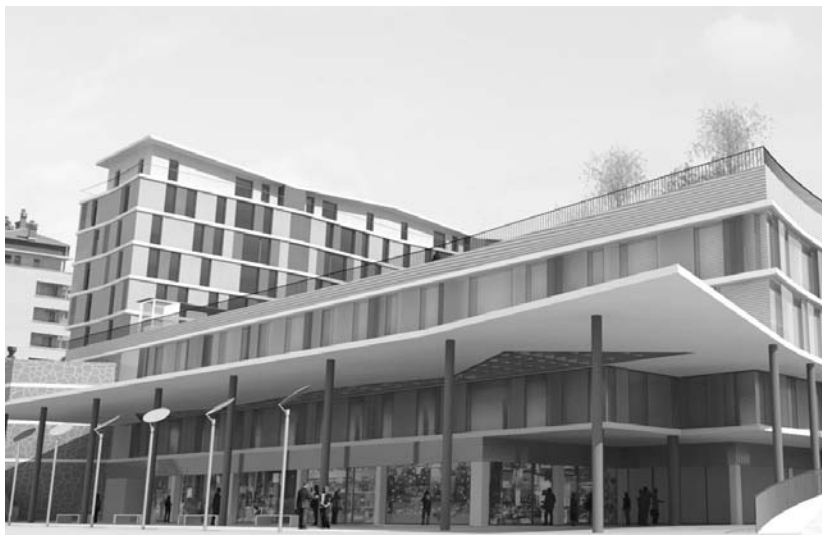
Merkatalgunea eraikitzeke azken aldaketa egin du Lasarte-Oriako Udalak aste honetako ohiz kanpoko Udaltzarrean.

Helburua, hauek eraitsi eta Loidi Baren inguruan dauden plazak egokitzeaz gain, oinezkoentzako eremu librea lortzea da.