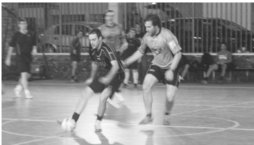
Obelix eta Lekuona Mena taldeek jokatuko zuten ostiraletan Aretu-futbol herrikoiko XXVII. txapelketako lehenengo partida.

Baina ez da hori aldeketa bakarra, Txusek azaldu digu-