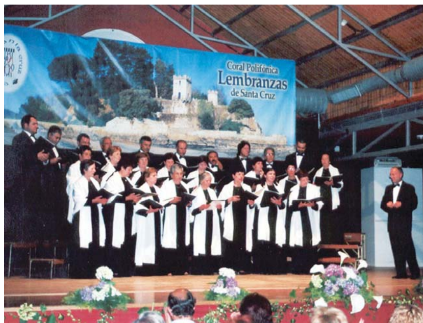
Portugalgo Calçada Romana abesbatzak Ama Brigitarren komentuan eskainiko dute kontzertua bihar, 20:00etan.