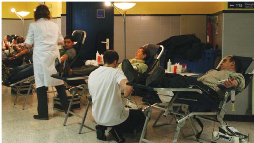
Urriaren 18an bilduko dira Odol Emaileen Oria Beheko ordezkaritzako kideak Urnietan.