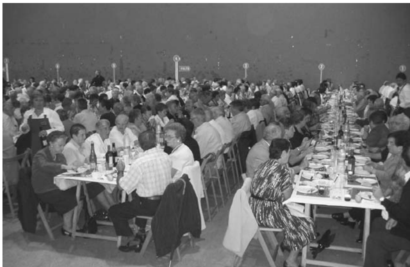
Urtero legez, Lasarte-Oriako Udalak meza, jaialdia eta bazkaria antolatu ditu igandean Adinduen omenaldi eguna ospatzeko.

Omenaldiko egun garrantzitsua da igandekoa da. Goizeko 11:00etan San Pedro Parrokian ospatuko den mezarekin emango zaio egunari hasiera. Alboka Abesbatzak, bertsolariak, trikixak eta dantzariak parte hartuko dute honetan.