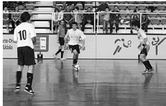
Aldaz H.K. taldeak Nazional B mailan mantentzen saiatuko da aurtent.

Hala ere, zaila da gure lehengo urtea da eta maila honetan dauden taldeak urteak daramatate, esperientzia handia dute.