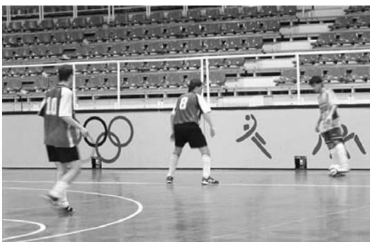
ISU Leihoak, berriro ere, Euskal Ligara igotzeko ahaleginak egingo ditu.

Aate buru honetan auekarak ditugu irabazteko ondo jokatuz gero, baina denboraldi hasiera da. •