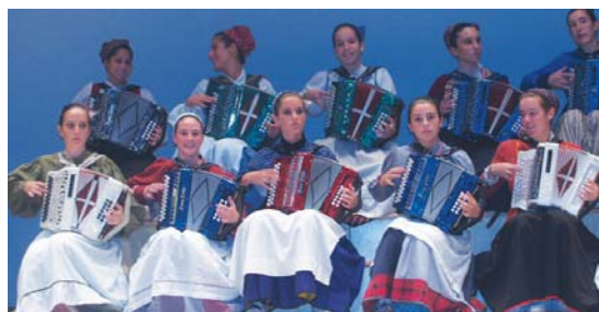
Miranda de Ebron Donejakue bideko lagunen IX. bilkuran parte hartu berri dute.