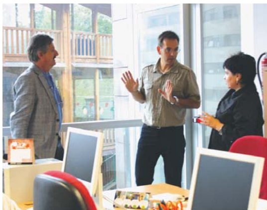
Udal Euskaltegiko zuzendariak egoitza berria erakutsi zien Lasarte-Oriako Udaleko eta HABEko ordezkariak

HABEko zuzendariak herri-tar guztiei gonbidapena egin zien "euskara mundura hurbildu edo hizkuntza gehiago ikasi nahi dutenei, Udal Euskaltegiari etorri daitezela." •