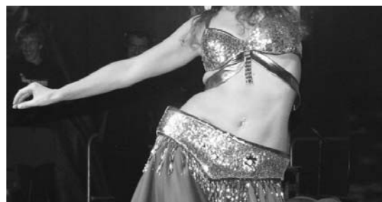
Gazte ikastaroetan, sabel dantza da ikasle gehien batzen dituen ikastaroetakoa.