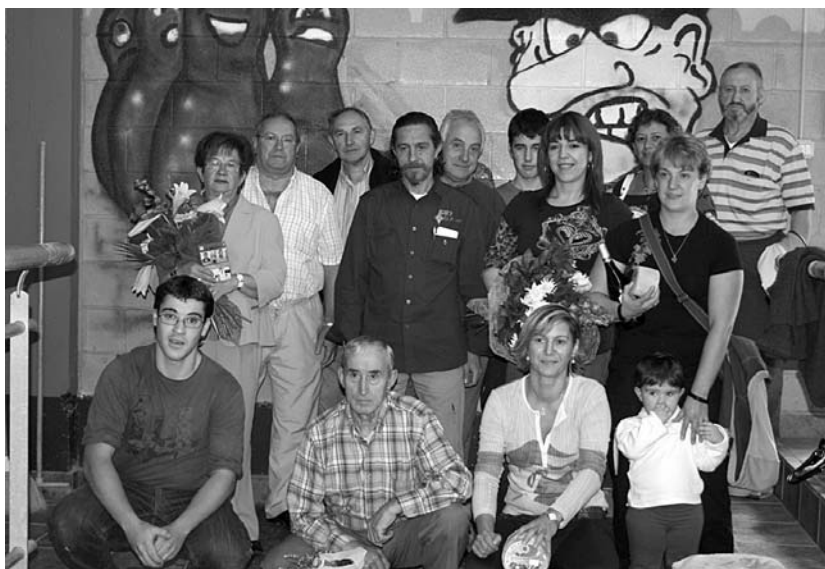
Sari banaketaren ondoren, alargunei lore sorta bana eman zizkieten.

Giro ederra egon zen goiz osoan zehar eta bertaraturakok ederki pasa zuten. •