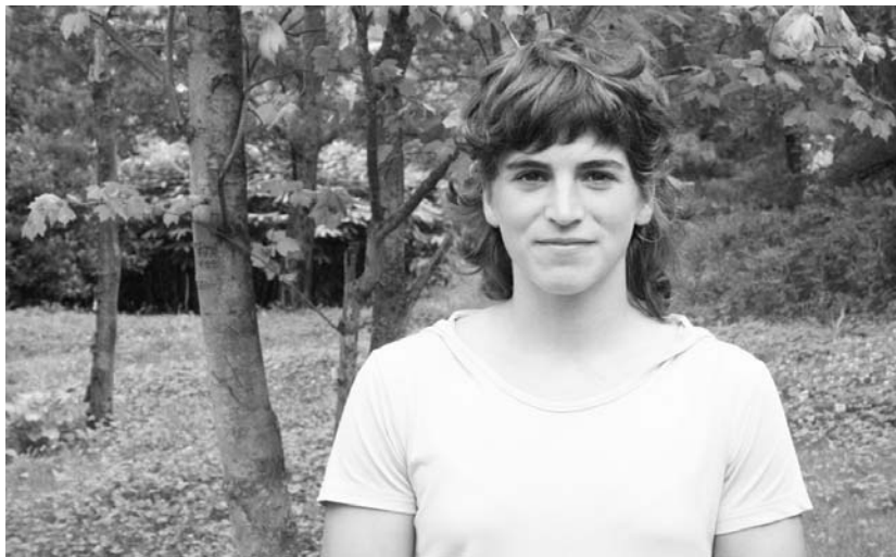
Urte bete gogor lan egin ostean, eskuratu du zilarrezko domina Maialenek Munduko Txapelketan; orain, atsedena dator.

Ahalik eta kontzentratuen. Nire jaitzieran oso sartuta. Ezin nuen burua beste gauzetan despistatu. Ikaragarria izan zen jendeak nola animatzen zuen. Espektakulo polita izan zen.