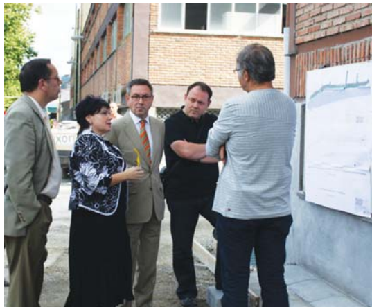
Oriako pabilioien atzealdeko eraberritze lanak ere ikusi zituen.

"Lana sortzea edo mantentzea zen laguntza hauen helburua eta ongi bete da. Proiektuen arabera, 2.907 lanpostu sortzea espero genituen Gipuzkoan, baina 3.734 izan dira. Estatu osoan