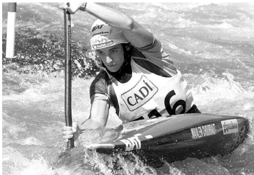
Bi segundutako penalizazio bategatik ez zuen urrezko domina eskuratu.

Kurtsoan interesa dutenak posta elektronikoz egin beharko dute, gaf@kirolak.net helbidean.