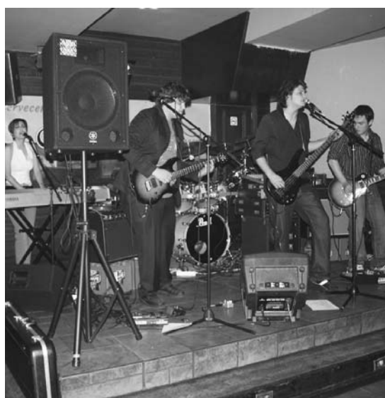
Latitud 43 taldeak Abend kafe-antzokian eskaini zuen kontzertuan.

Ospakizunaren ostean, atek irekiak izango ditu euskaltegiak. Eta, jakin arazi digutenez, lasarteoriatar guztiak gonbidatuak daude egoitza berria ikustera. •