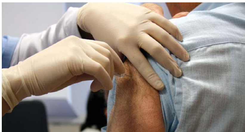
Aurten Osakidetzak aurreratu egin du gripearen aurkako txertoaren kanpaina, astelehenean hasi zen.

A gripearen taldeak, ordea, "oraindik ez dakizkigu Osasun ministerioak erabaki behar du hori," adierazi digu Osasun zentroko zuzendariak.