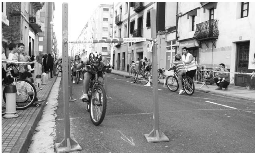
Ederki pasa zuten iaz haurrek gymkhana egiten; aurten ere, aukera izango dute irailaren 25ean, Andatza plazan.

Ostean, 17:00etatik 19:30era, bizikletarekin zeri-kusia duten jolasak eta gymkhana antolatu dira plazan. Jolasak parte-hartzaileen adinera moldatuak egongo dira.