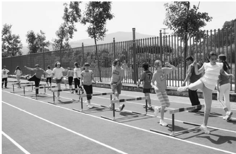
Alebinen kirol jardueren sustapenean kirol ezberdinak probatzeko aukera dute haurrek, atletismoa, esate baterako.

Hautetaz gain, 6-24 hilabete bitarteko haurtxoentzako igeriketa ikastaroan parte hartzeko aukera ere badago ikasurte honetan.