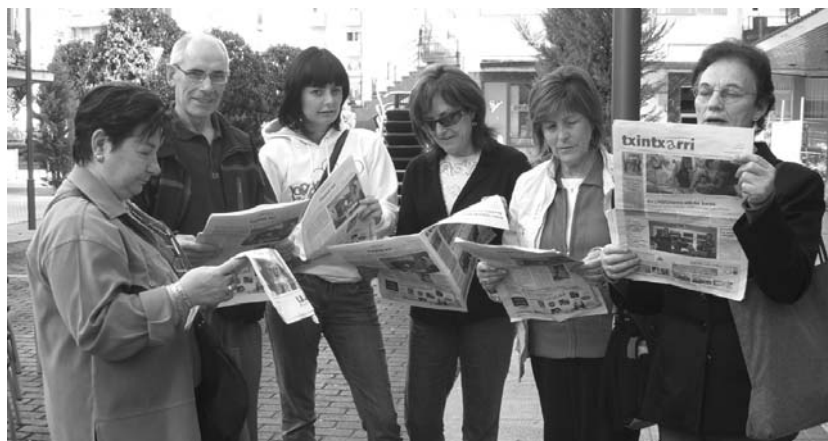
Matematikak, literatura, artea, informatika, ingelesa eta, noski, euskara ikasten dituzte. Arg: L-O Helduen Hezkuntza

Helduen Hezkuntza zentroko ikastaro batean parte hartu nahi izanez gero, "hurbildu, informatu eta izena eman. Hilabete osoa dute interesatuek. Astelehenetik ostegunera 10:00etatik 12:00etara eta 16:00etatik 18:00etara eta ostiraletan goizez." •