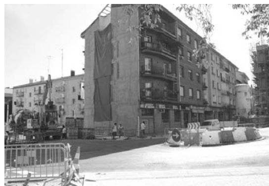
Lehenengo astean, kalea irekitzeko azken ikutuak ematen ari ziren langileak.