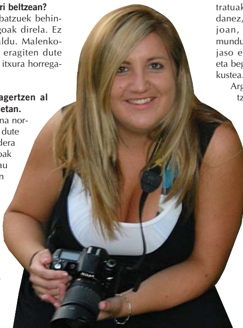
Duela sei bat urte hasi zen argazkilaritza serio xamar hartzen.

Argazkiei esanahiren edo mesuren bat erantzen saiatzen al zara? Esanahiarena ez dakit,... nik agian esanahi bat eman nahi diot eta zuk ikustean beste bat ematen diozu. Argazkiak zerbait espresatzen badu behintzat, gustura gelditzen naiz. Ez, ikusi, “argazkia polita da” edo “itsusia da” esan eta kitto, zerbait sortarazi behar dute barruan. •