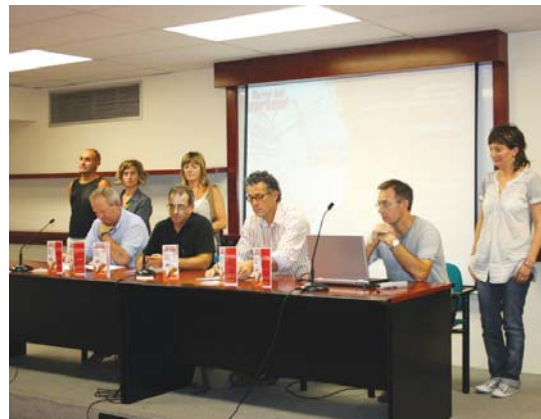
Atxu, eskuineko bigarrena, Buruntzaldeko matrikulazio kanpainaren aurkezpenean.

Internetean erabilerara garrantzitsua bilakatu dela ere onartu du euskaltegioko zuzendariak, “HABEren dokumentazioan sartu eta bertan dokumentuak eta entzungaiak daude. Orain, entzungaiak ez dira lehen bezala egiten, irratikasetari jarri eta denak batera. Eta hor nabaritu dugu izugarriko aurrerapena, ikasleak bere kaxa entzumen arizketak egiten dituenean askoz