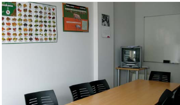
Teknologia berrien erabilerak euskararen ikasketan ondorio onak dituela aipatu digu Udal Euskaltegioko zuzendariak. Horregatik ordenagailu gela berriak garrantzia handia du, baita gelatan dauden tresnak ere.