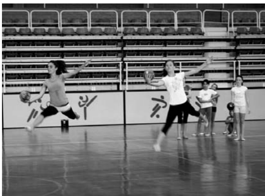
Malgutasun eta tresna erabilera ariketak egin zituzten lehenengo egunean.