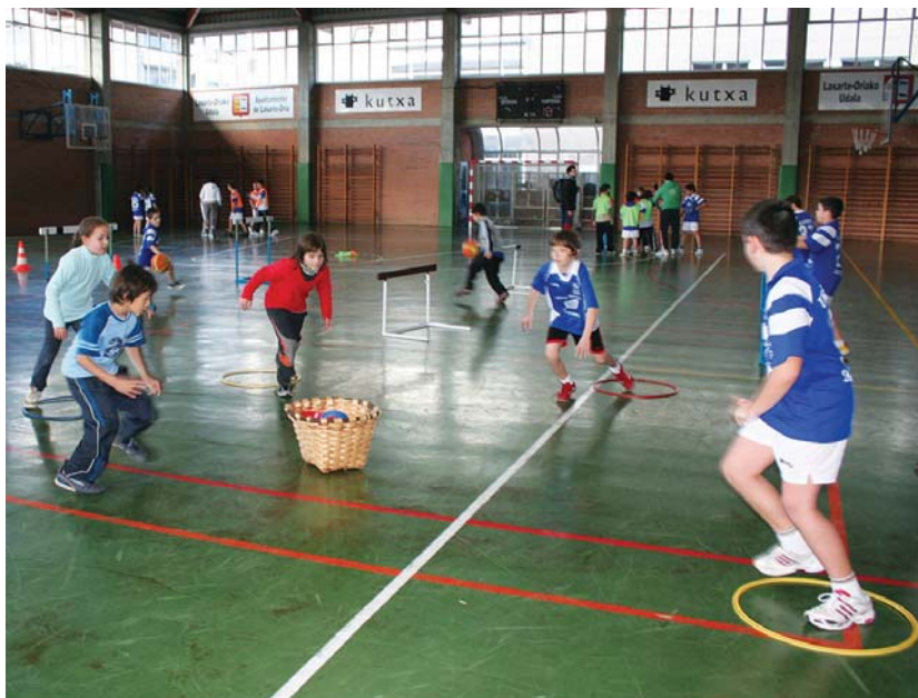
Euskaraz egin daitezkeen jarduerak ugari aurkezten dira Buruntzaldeko aisiako gidan eta kirola horietako bat da.

Izan ere, orain arte paperezko bertsioan atara bada ere, hemendik aurrera web-orrian bakarrik egongo da eguneratuta aisiako gida. •