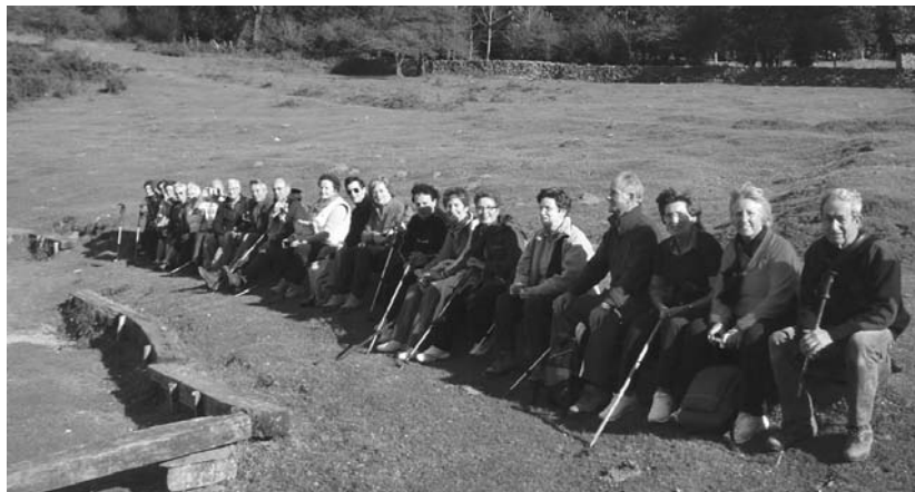
Helduen Hezkuntza zentroan ikasteaz gain, zenbait modulutan irteerak egiten dituzte.

"Baina bakoitzaren ibilbidea ezberdina da. Batzuk ezer