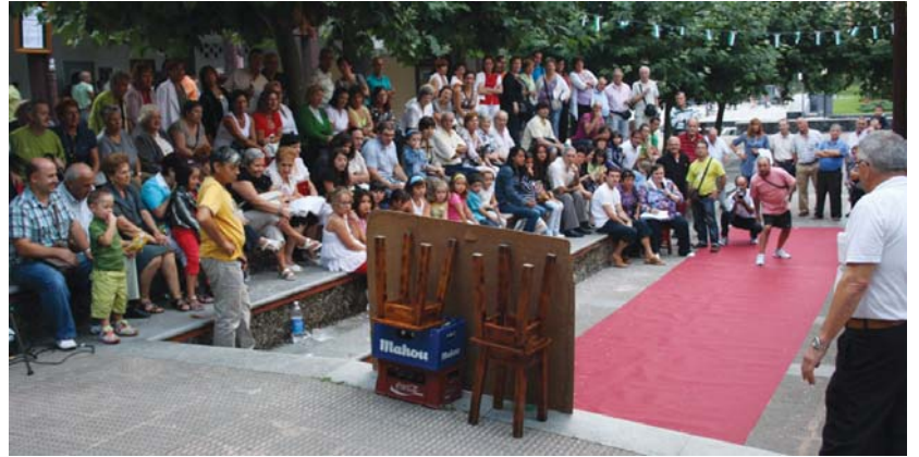
Heldu eta haurrek primeran gozatu dute Extremadura Etxeko jaietaz. Goian, gizonen toka lehiaketa; behean, haur jolasak.

Ibai Berriak taldearen laguntzaz dantza lehiaketa egon zen ostean. Eta asko izan ziren goizeko hirurak arte dantzan egon zirenak. Orduan, indarrak eskuratzeko, bertan zeuden guztiak migak banatu zituen Extremadura etxeak.