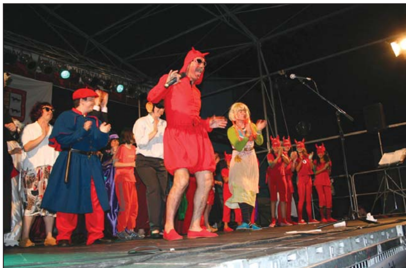
Deabrua errausketaren aurka zegoela eta, izako Parodian, akusatuen aurkako epaia ez zen burutu.

21:30ean Andatza plazatik irten eta, Parodia iragarritz, desfilea egingo dute guztiak herriko kaleetan zehar Isla plazaraino.