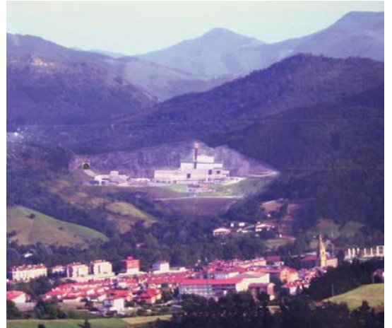
Zubietan Gipuzkoako Hondakin Kudeaketa Zentroa egotea aurreikusten da.

Kudeaketa zentro nagusi honetan, aurretratatendu biolehorketako eraikina, balorazio energetikoko eraikina, zepen balorazio eraikina eta ingurumenaren interpretazio zentroa eraikitzea aurreikusten du Foru Aldundiak. •