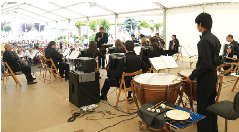
Berritri ere emanaldi ederrera eskaini zuten Zero Setteko kideek.

Lehenengo aldia zen herrian akordeoi orkestra batek jotzen zuena eta Zero Setteren errepertorio alaia, zartzueta, pasodoblea eta Guillermo Tell obraren hasiera, besteak beste, herritarren gustukoa izan zen, nahiz eta obrak murriztu behar izan zituzten.