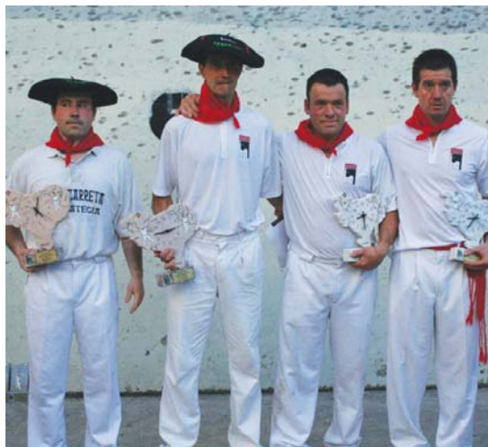
Etxezarreta eta M. Bardajik izakio bigarren postua ahozteko aukera dute igandean.

Pala gustuko duten herritarrek zorionezko dira. Igande honetan, XXVIII. Santa Ana pala txapelketako finalak jokatu baitira Michelin ondoko frontoian.