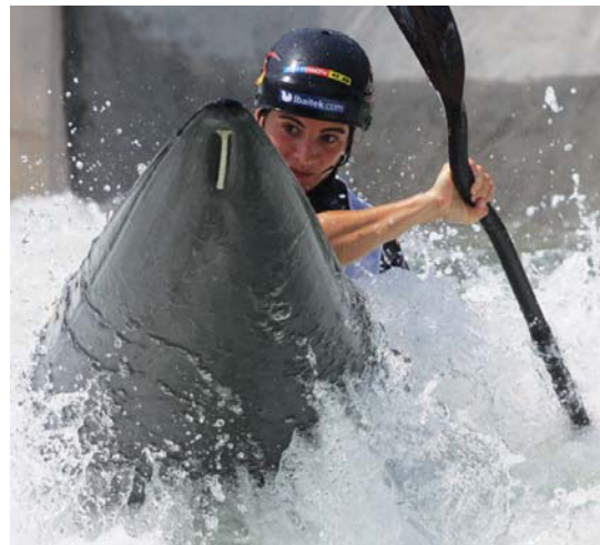
Espainiako txapelketa eskuratu ostean, iraileko mundiala du orain erronka nagusi.

"Espainiako txapelketa Munduko Kopako proben jarraian izan zen. Orduan, espainiako txapelketara oso nekatuta iritsi nintzen," azaldu digu palista lasarteoriarrak.