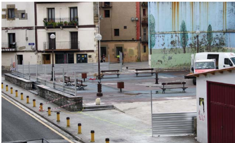
Ekainaren erdialdean itxi zuten Okendo plaza lanekin hasteko.

Mugikak ziurtatu duenez, Okendoko lanak aurrera jarraituko dute: "Hirigintzako azken batzordean azaldu nuen moduan, obrarekin jarraitzeko asmoa dago horren garrantziaren eta urgentziarengatik, zeinaren proiektua onartua izan zen. Uste dut zuek zaretela obraren urgentzia ikusten ez