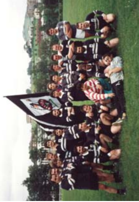
Beltzak Hipodromoan. Eskubian Astar Aituna, Bionakoa Aviron taldeko jokalaria.