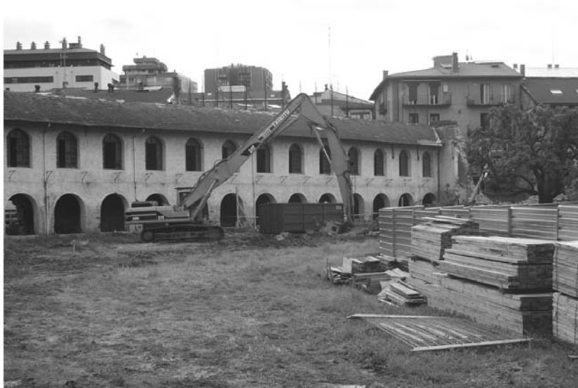
Herritarrek, udaletxe berriaren zati izango den, Brigitarren arkupea ikusteko aukera izan zuten atzo.