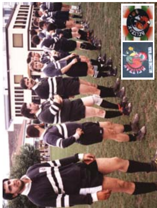
Beltzak Michellego zelaietan berrak. Zelaietan beltzen bi esku.