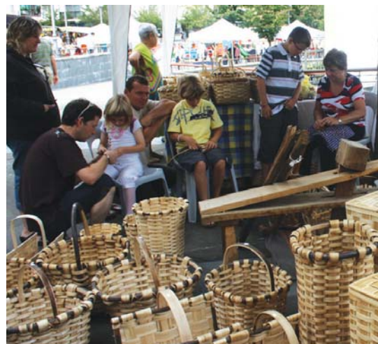
Lasarteoriatar ugari hurbildu ziren Dorre parkean antolatu zen Santa Ana azokara. Helduek erosten zuten bitartean, txiki eta gazteek parkean jolastu edo kandelak eta otarrak egiteko aukera izan zuten.