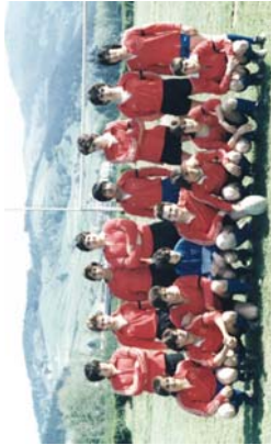
Lasarte Rugby Taldea 1985ean. Oinondik ez ziren Beltzak.

Hasieran, astean zehar, Dana Ona aurrerako aparkalekuan entretuzten zuten, "herrian agia zegoen toki bakarra zela", eta ingandien hipodromoan. Lehen lau urtean Lasarte R. I. izan zen. 1988an kirol-jantzi berriak erosi zituzten, beltzak bi marra zuriek, eta ondik bidaiari Beltzak des-zen dione, izen hori hartu zuten. Lagunarteko partidak Batez ere, Ipar Euskal Herriko taldean aurrerako lagunarteko partidak jokatzen zituzten. Jakina da, hain maila handia dagoela eta, beraz, partidu gehienak baldin egiten zituzten, "uste du gehin irabazi genuela Donibane Lohitzuzen, eta beste hainbat ere errugbian jokatzen izan ziren. Ahal zena egiten guren guren bikaldekinekin. Galduraren giroa bilakatu, alari bat ematen zituzten..." orotari dute beltzek. "Beste filosofia talde gurenuz da, defentsiboa zauden bezala, ez zen lehiakortasunik, lehiatu baino