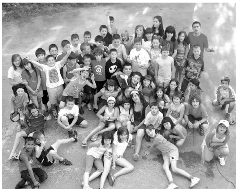
Irudian, Mendigorriako txandako haurrak begiraleekin. Ederki pasa dute!