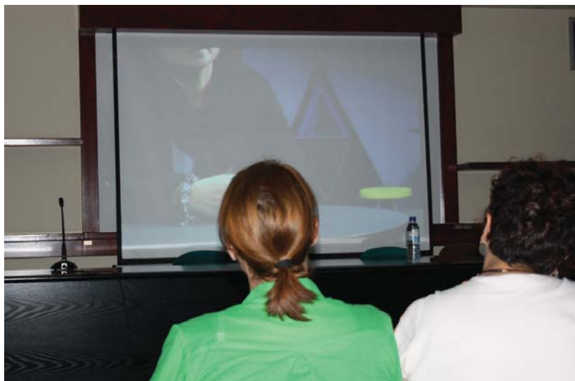
Azken atea dokumentalean ez dira hitz egiten dutenen aurpegiak ikusten. Hori da Elkartearen ezaugarrietako bat.