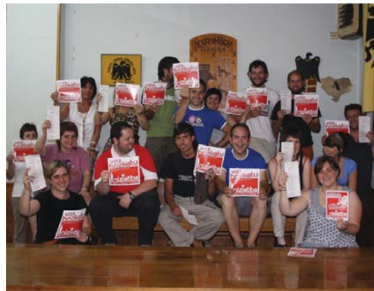
Ezker Abertzaleak Iniziatiba Internazionalistaren aldeko bozka eskatu zuten.