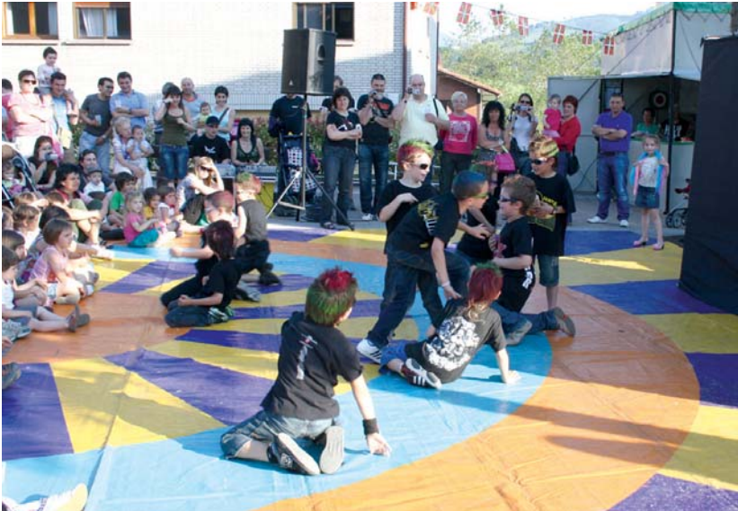
Asteartean Landaberi Antzerki Eskolako LHI mailako haurrek Top Model eta Rock and Roll lanak eskaini zuten.

■ Gaur iluntzean Teresa sorginaren etorrerarekin, ekintzez betetako asteburuari hasiera emango zaio