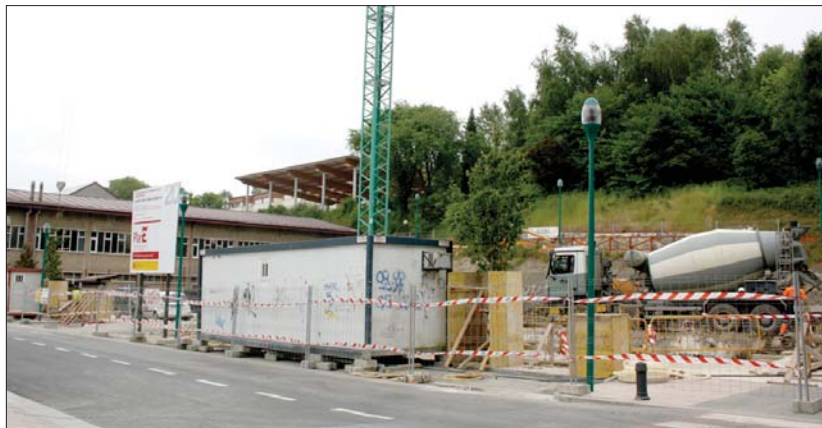
2009an egingo diren inbertsioetako bat izango da frontoia eta paddle pista berria.

Lasarte-Oriako herriaren diru sarrera kopurua ona dela azpimarratu ostean, zera aipatu zuen, "oraingoz egin beharreko ordainketa guztiak egin