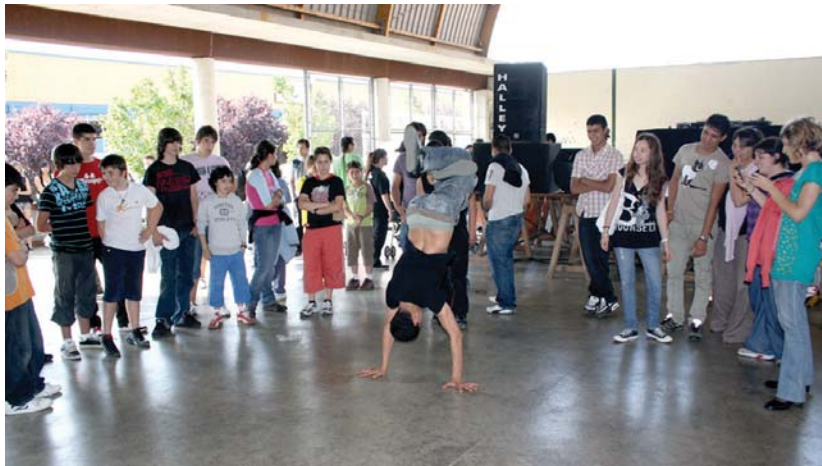
Antolatzen diren ekintzetan gazteen parte-hartzea handitu nahi du Udalak.

Helburu horrekin, gazteen beharrak ezagutzeko ikerketa egin berri du Udalak. Emaitzak jada eskuartean dituzte. Beharrak zeintzuk diren jakinda, orain, horiek gauzatzeko pausuak emango dituzte. Era berean, Gaztelekua nola antolatuko litzatekeen finkatu dute. Ikerketa Kalekka enpresak egin du, eta herriko 3.050 gazteri egin zaie galdeketa, hau da, herritarren %15ari.