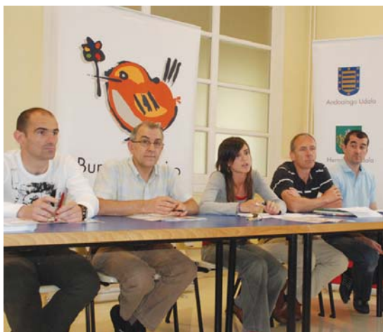
Irudian, asteleheneko prentsaurrekoa Hernaniko Biteri kulturetxean.

alkateak, "2010ean Lasarte-Oria ez da ongi egongo ekonomikoki, baina 2011rako oreka lortu nahi dugu. Izan ere, Foru Aldundiak eman ez dituen milioi horiek udalak aurreztu behar baititu eta kostako da."•