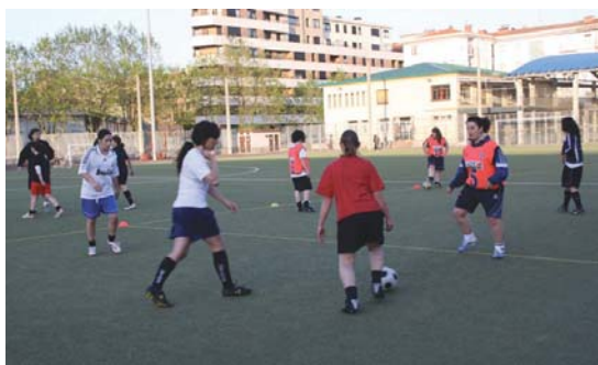
Ostadarreko neska eta mutilak berriro ere lanean hasteko deialdia jaso dute.