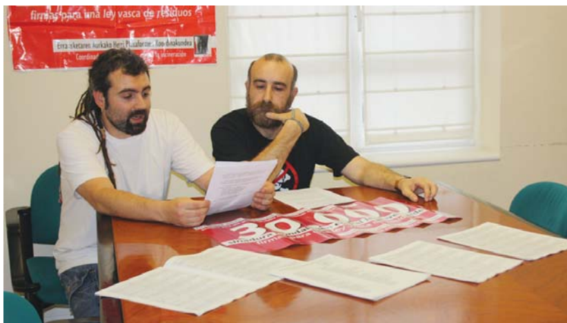
Lasarte-Oria Bizirik taldeak Hondakinen Euskal Legearen aldeko sinadura bilketa sustatzea eskatu zion Udalari.

Honetaz gain, 2001 urteko urtarrilak 1an indarrean jarritzen legearen arabera, 5000