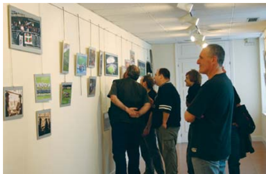
Beltzak taldeko jokalariei ohiaik eta lagunak izan ziren lehenak erakusketa ikusten.

Beltzak Rugby taldeko bizitzaren zatitxo bat erakusketan honetan ikusi daiteke, baita Lasarte-Oriako historia-rena ere. Horregatik, herritarrek gonbidatu nahi dituzte hau ezagutzera. •