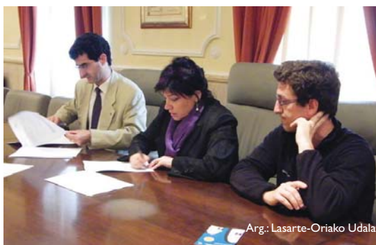
Arg.: Lasarte-Oriako Udala

Honetaz gain, ekimen honen alde sinatu ez dutenek Lasarte-Orian ondorengo lekuetan egin dezaketela jakin arazi zuten, Manoli estankoa, Goxogi gozodenda, Ekodenda Orbela, Corseteria Maya, LABeko egoitza edo ELAko egoitzan, baita taldeak larunetan goizean herriko kaleetan jartzen dituen mahaietan ere. •