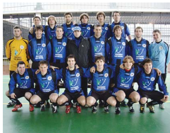
Erregionalakoek igoera lortu dute, orain txapelketaren txanda da.

Hala ere, "orain garrantzitsuenak minduta dauden jokatukoak dira eta horretaz gainera, denboraldian zehar, taldearen errendimendua oso onak izan dira."