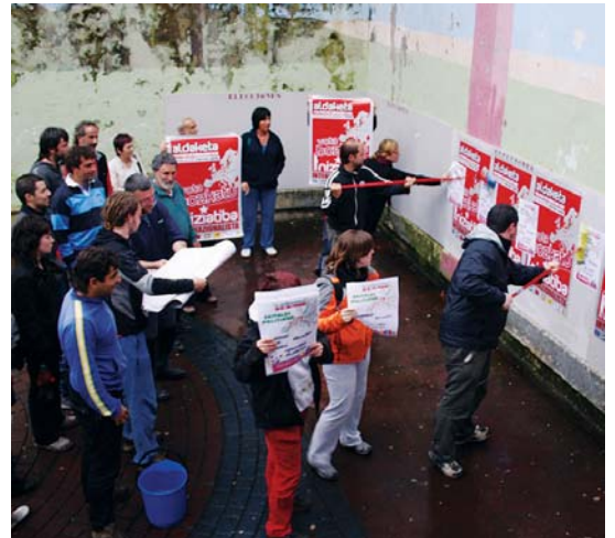
Ezker abertzaleko kideek, herriko kaleetan zehar, kartelen pegada egin zuten.

Era berean, internazionalista izaki, mundu osoan dauden herrien askatasuna eta duintasunaren aldeko borroka sustatzen du alderdiak, Europako prozesu soberanistak edo Latinoamerikako justizia sozialean oinarritutako prozesuak. •