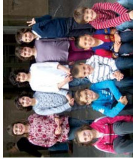
Ametsak lanelo protagonistak, Landaberriko 2. mailakoak.