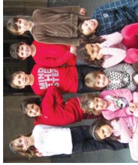
Ametsak lanelo protagonistak, Landaberriko 2. mailakoak.