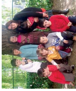
Ametsak lanelo protagonistak, Landaberriko 2. mailakoak.