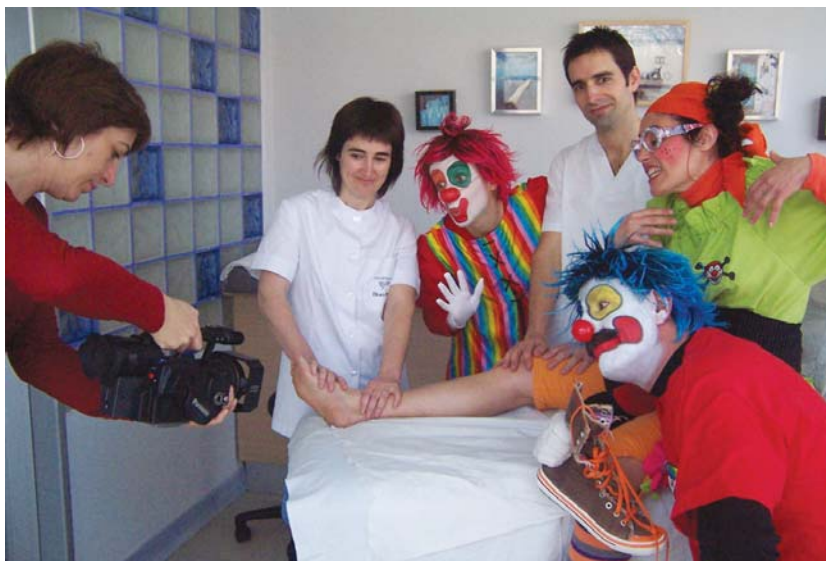
Pirritx, Porrotx eta Marimoto- tsek Ibaiondon egon ziren min ohikoek nola sendatu eta masajeak nola egin jakiteko.

DVDari esker, guraso eta haurrentzat lagungarri izatea espero dutela ere aipatu du Ikerrek, baita gure Porrotx bihu- rriarentzat ere.