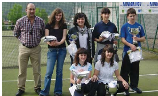
Landaberrikoek emaitza ezin hobekak lortu zituen Gipuzkoako tenis txapelketan.