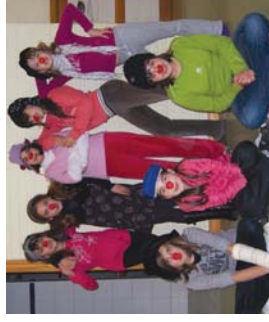
Kalki... hasi filmazten lanelo protagonistak, 5. mailakoak.