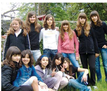
Fandantragoreinusot laneko protagonistak, DBH I-2.