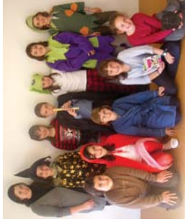
Ipuinen Kerria erregere lanelo protagonistak, Landaberriko 4. mailakoak.