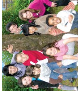
U tanta batzen istorio Zabeletako haurren taldea.