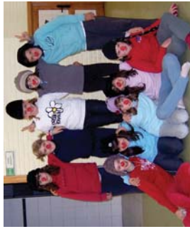
Kalki... hasi filmazten lanelo protagonistak, 5. mailakoak.