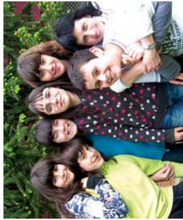
Lizara Magikeak lanelo protagonistak, Landaberriko 6. mailakoak.