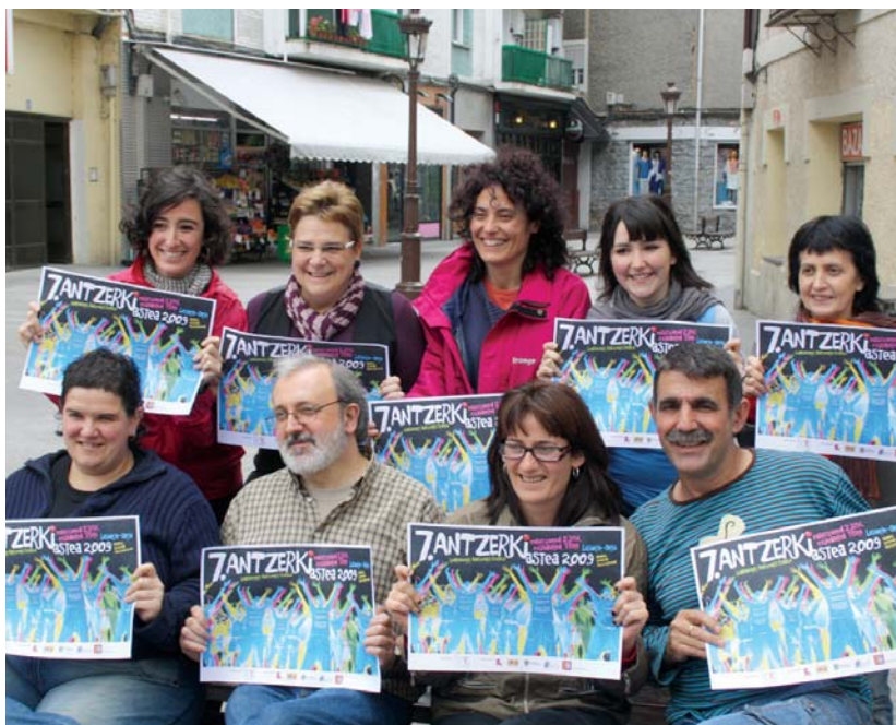
Antzerki Astea aurkezpenan Landaberri Antzerki Eskolako irakasle, partaide eta lagunak bildu ziren.

Guztira 15 emanaldi eskainiko dira kulturetxean, beraz aukera paregabea antzerkia eta dantza gozatzeko.