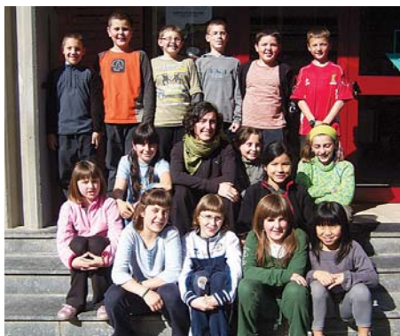
Fandantragoreinusot laneko protagonistak.