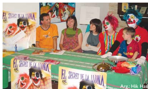
Arg.: Hik Hasi

Maiatzaren 10ean aurkeztu zen Bartzelonan El secret de la lluna filma. Hik Hasi ekoiztutako filma 2004ean estreinatuta euskaraz eta haren balio hezitzailea ikusi- ta, eta hezur-haragizko prota- gonistak dituzten katalanezko haurrentzako filmak urriak direla kontuan hartuta, Musi- ca Trapellak hutsune hori bete nahi izan du Hik Hasi egin- dako lana oinarri hartuz eta filma katalanera bikoiztuz.