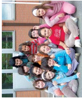
Mimo antzerki lanelo protagonistak, Landaberriko 3. mailakoak.