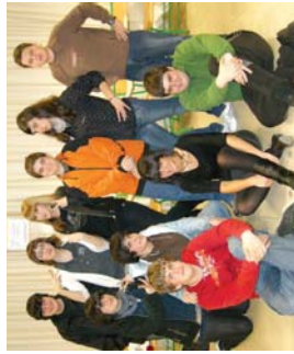
Camp Rock lanelo protagonistak, Landaberriko DBH3-4.