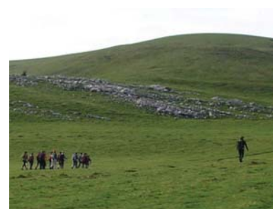
Lasarteoriatarrek hamabi ordu eta erdi behar izan zituzten Amezketatik eta Irantzuko arteko bidea egiteko.