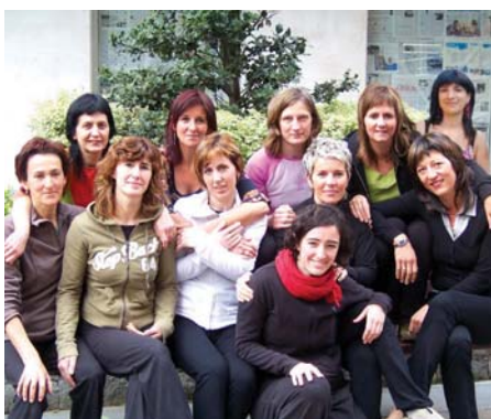
Fandantragoreinusot laneko protagonistak.