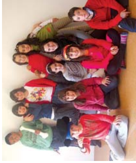
Berrekin agiten ez zeketen piratza lanelo protagonistak, 4. mailakoak.