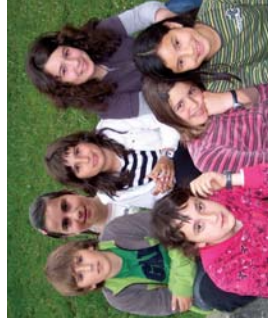
Lizara Magikeak lanelo protagonistak, Landaberriko 6. mailakoak.