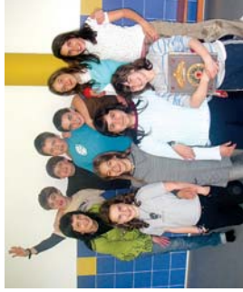
Lizara Magikeak lanelo protagonistak, Landaberriko 6. mailakoak.