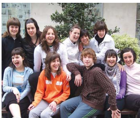
Fandantragoreinusot laneko protagonistak.