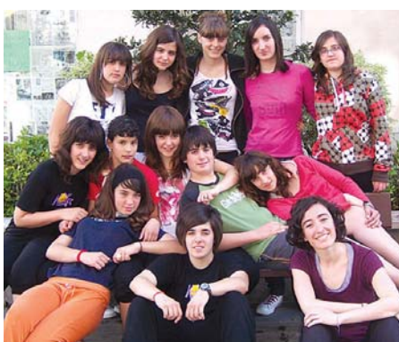
Fandantragoreinusot laneko protagonistak, DBH 2-3.