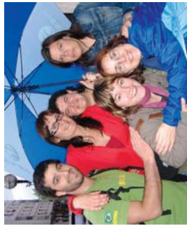
Eze haurren jatorri da lanelo protagonistak.