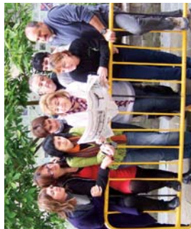
Habeto kantuak... eraz kantuak lanelo protagonistak.