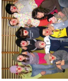
Kalki... hasi filmazten lanelo protagonistak, 5. mailakoak.