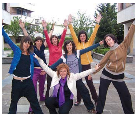
Fandantragoreinusot laneko protagonistak.