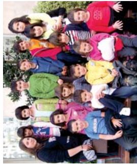
Top movie' lanelo protagonistak, Landaberriko 1. mailakoak.