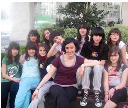
Fandantragoreinusot laneko protagonistak, DBH I.