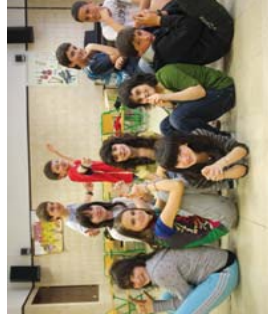
Iprobiak lanelo protagonistak, Landaberriko DBH1.