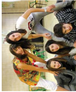
Iprobiak lanelo protagonistak, Landaberriko DBH2.