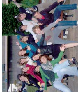
Grece lanelo protagonistak.