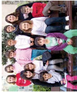
Rock and Roll' lanelo protagonistak, Landaberriko 1. mailakoak.