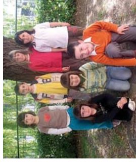
Ametsak lanelo protagonistak, Landaberriko 2. mailakoak.