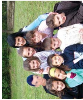
Mimo antzerki lanelo protagonistak, Landaberriko 3. mailakoak.