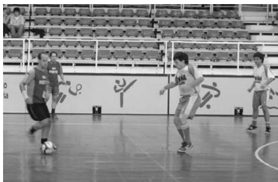
Buenetxea eta Izkiña taldeek finalaurrekoan partida parekatu jokatu zuten.

Beraz, hurrengo astean ere norgehiagoka interesgarriak ikusteko aukera egongo da kiroldegian oraindik guztiak aukerak baituztute. •