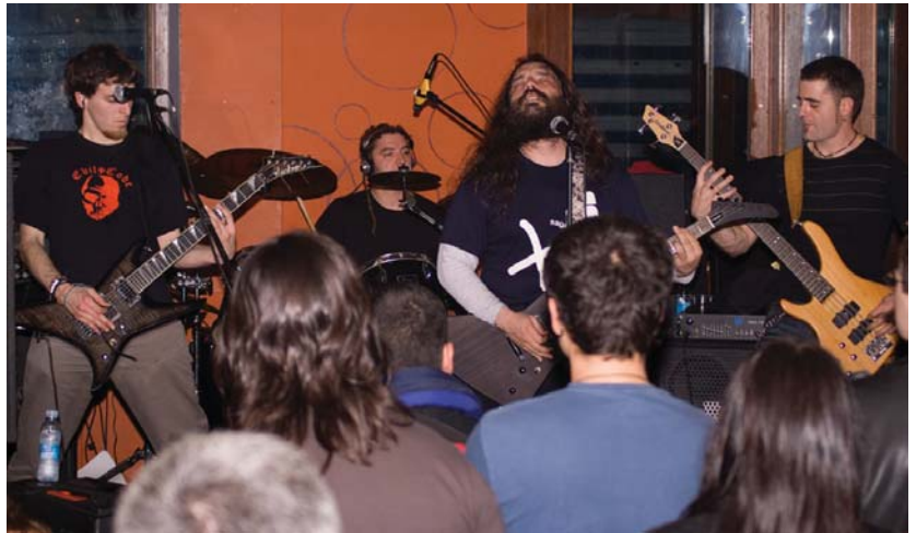
Kudai taldearen doinu trash metalak entzun ahal izan ziren larunbata gauean Jalgin.

Taldearen lan helduena dela diote kideek, "ia atsedetik gabe, sekula egin dugun musika indartsuena aurki dezakezue, lelo melodikoei tartea uzten badiegu ere."•