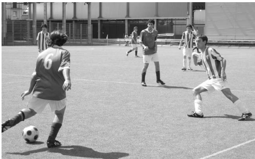
Texas Lasartearra taldeko jubenilek luzapeneko bigarren zatian eskuratu zuten final laurdenetarako txartela.

Lehenengo zati kaxkarra egin zuen arren, jubenilen taldeak 1 eta 0 irabazten zihonan lehenengo zatia bukatzean. Eta, gainera, gol bat balioga-