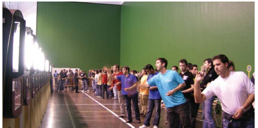
Giro ezin hobea egon zen Michelingo frontoian asteburu osoan. Herritar ugari bildu zen dardo jaurtitzailak animatzera. Heldu, zein gazteak gogor lehiatu ziren Euskadiko txapela eskuratzeko.