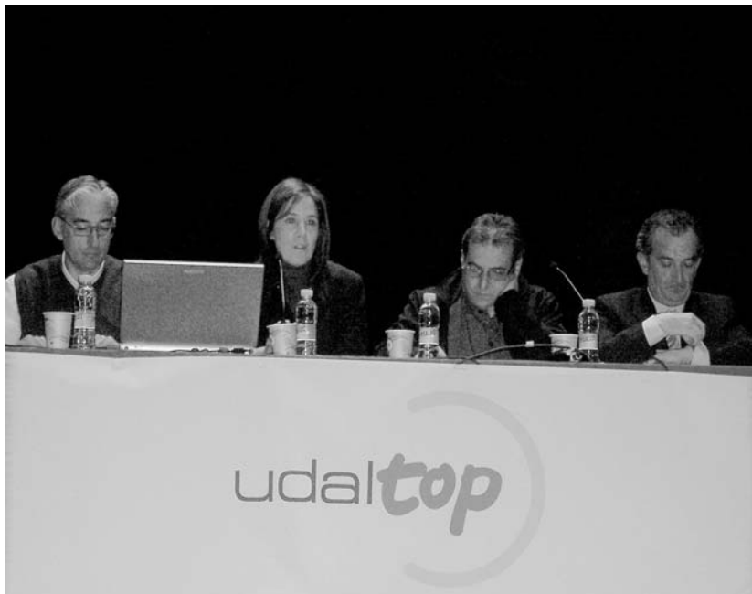
Eusko Jaurlaritza, Foru Aldundi, EUDEL eta Lasarte-Oriako Euskara batzordeko kideek eman zitoten hasiera topaketari.