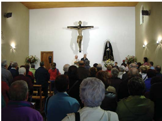
Ohiturak dionez, Azkorteke erromeria mezarekin hasi zen. Bertan herritar ugari bildu zen.