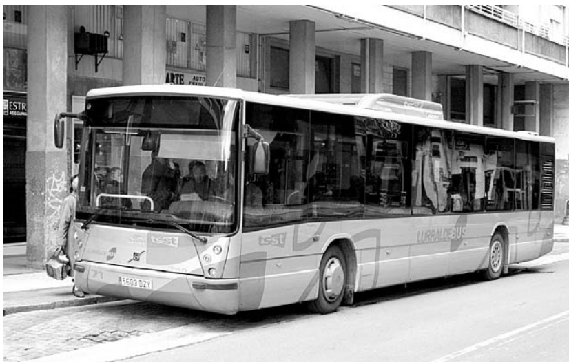
Nahi baino gehiago atzeratu bada ere, badirudi hil honen erdialderako martxan jarriko direla autobus linea berriak.

Usurbil eta Urnieta arteko autobus-linea bakarra sortzea aurreikusten zuen 2008ko akordioak.