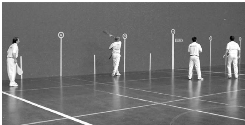
Goiko irudian 3. eta 4. postuagatik lehian, behean berriz, finaleko irudia.

“ Azkenean irabazi dugu, baina txapeldunordeak serio aritu dira eta gu ere gogor saiatu behar izan gara txapela eramateko