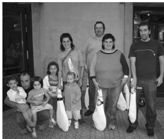
Diru sariatz gain, urdiazpiokoen zozketa egiten da Porrako partehartzaileen artean.

Porra egiteko txirrindularien zerrenda Ostadarreko webean aurkitu ahal dezakezue eta giroa behin hasita sailkapen eta boleto guztiak bertan aurkituko dituzue. •