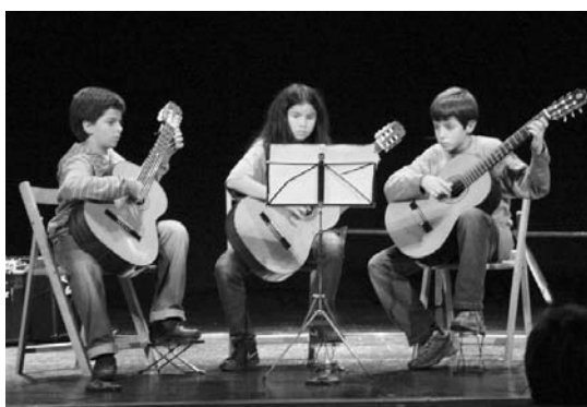
Musika eskolako ikasleek bizpahiru kontzertu eskaintzen dituzte kulturetxean.

Manuel Lekuona Kultur etxean eskuratu daitezke aurrematrikula orriak 09:00etatik 13:00etara eta