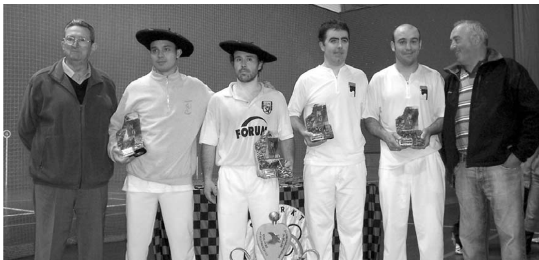
Irudian, txapeldunak eta txapeldunordeak oroigarriekin eta antolatzaileekin.

“ Azkenean irabazi dugu, baina txapeldunordeak serio aritu dira eta gu ere gogor saiatu behar izan gara txapela eramateko