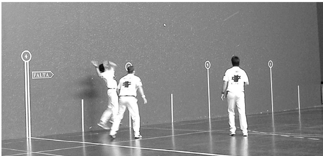
Argazkian ikus daitekeen senior mailako partidari izan zen tantuetan diferentziarik handiena izan zuena.