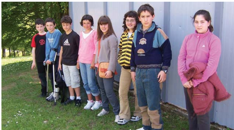
Patruila Berdeko zortzi kideak 10-12 urte dituzte. Irudian, konpostatzeko ontzia daukaten tokian daude.

Gelaz gela pasa zen Patruila jasotako informazioa eman eta galdera batzuk egin; papera berrerabiltzen zuten, plastikozko zaborra