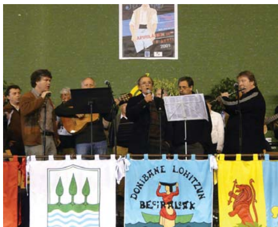
Hainbat taldeek girotu zuten bazkalostea Donibane Garaziko Kantuaren egunean.