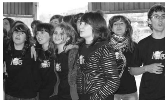
Kuadrillategiko kamiseta dotoreak jantzita umore onean.