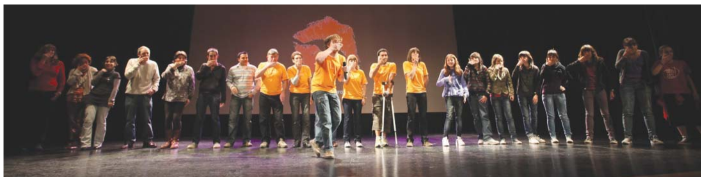
Zortzikoteak, euskara ikasten ari direnak eta gazteak omendu zituzten Maratoian izan zuten jarrerarengatik. Irudian, guztiak gero olatu erraldoi bihurtu zen haizearen soinua ateratzen.