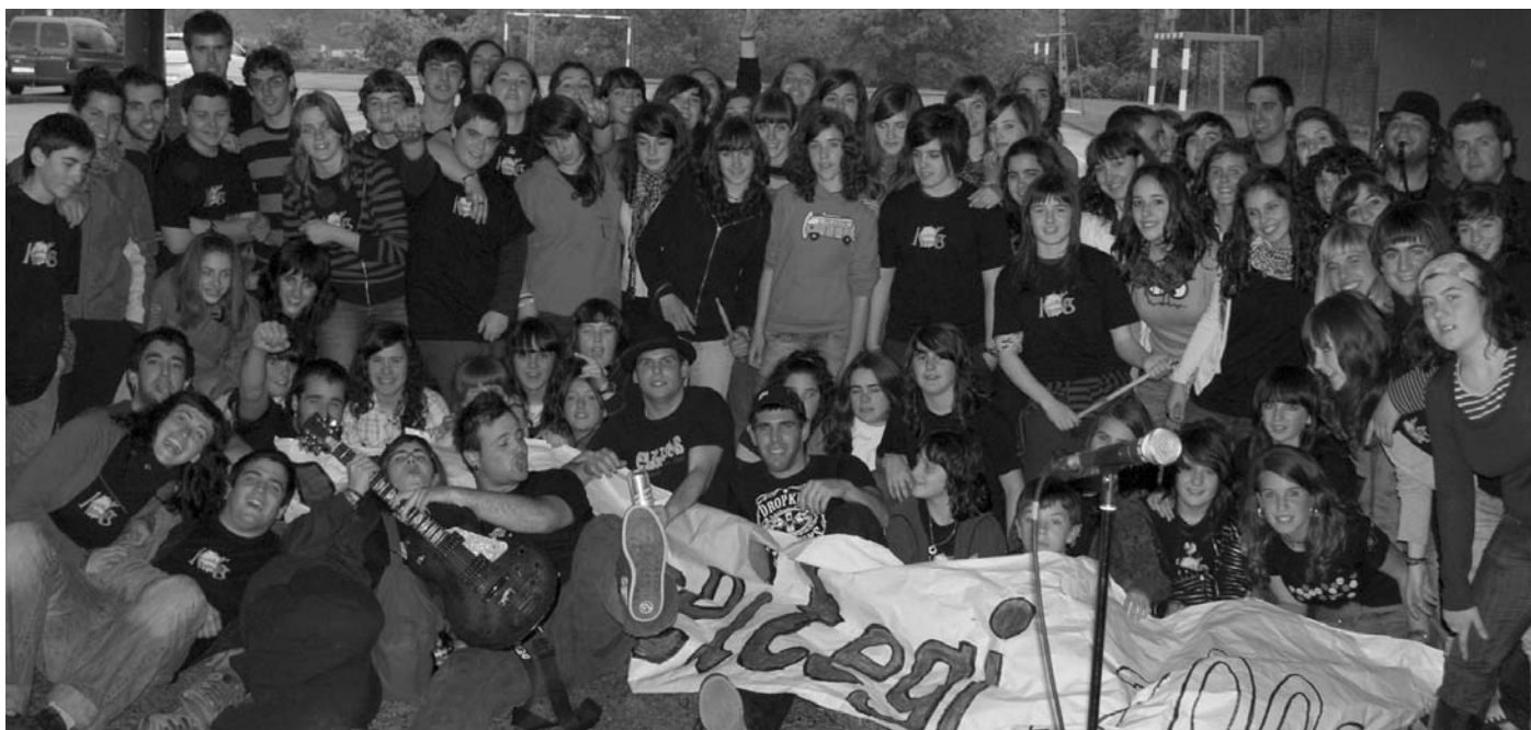
Pozik zeuden bi lagun kuadrillak jaialdia amaitu eta gero. Kontzertua amaitu zenean, Hesian taldekoekin batera argazkia atera zuten guztiek batera.