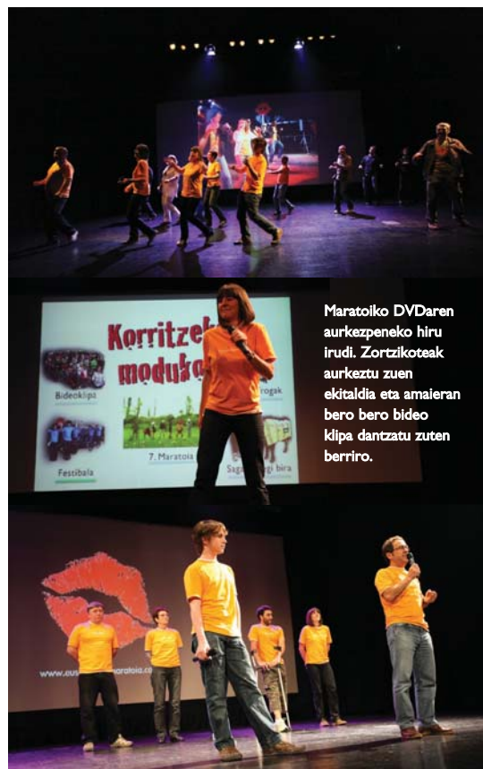
Maratoiko DVDaren aurkezpeneko hiru irudi. Zortzikoteak aurkeztu zuen ekitaldia eta amaieran bero bero bideo klipa dantzatu zuten berriro.

Ondoren laburpenaren bigarren zatia eman zen, igandekoa. Igandean goizean goizetik berriro martxan zirenak, azken orduetan han segitzen zutela ikusi ahal izan zen. Amaieran ezkutuan lanean aritzen direnetako batzu igo zituzten oholtza gainera, eta guztiak, zortzikoteak zein ikuseek bero bero amaitu zuten ekitaldia. •