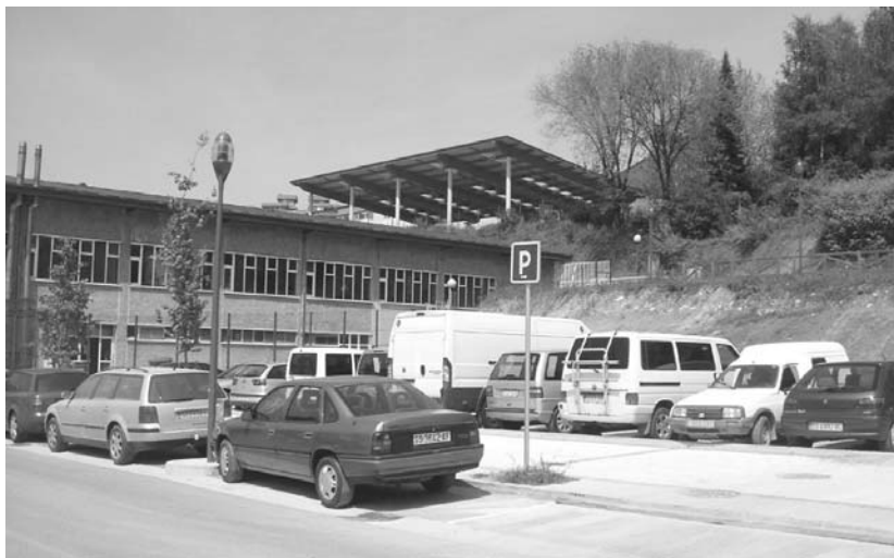
Tokian Tokiko Inbertsioko Estatuko Funtzarekin finantzatu diren proiektuetako bat frontoi berria eta padel pista dira.

Oriako pabilioien atzealdea eraberritzeko proiektua ingurumen-ekintza ikusgarria izango da eta bere helburua orain degradatuta dagoen hiri-espazio bat errekuperatzea da. Ibaiaren erribera errekuperatuko da horrela, oinezkoentzako ibai ondoko pasealeku bat lortuz, eta zonalde berdeak eraberrituko dira.