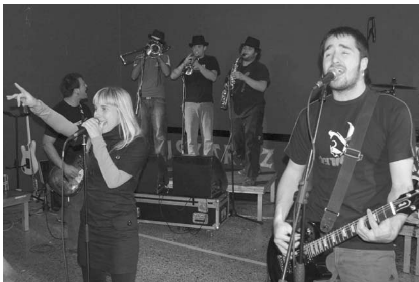
Hesian taldeak harrera oso ona izan zuen Lasarte-Oria eta Elgoibarko gazteen artean.