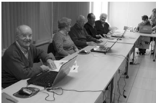
Ordenagailuan trebatzeko ikastaroko hiru saio egin dituzte Biyak Bateko kideek.

Lehengo astean hasi zen ikastaroa eta 6 ordu nahiko izan dira teknologia berriak menderatzeko. •