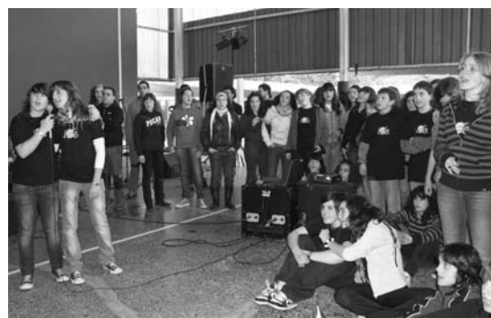
Gazteak ere kantari ibili ziren arratsaldean. Karaokeak arrakasta izan zuten.