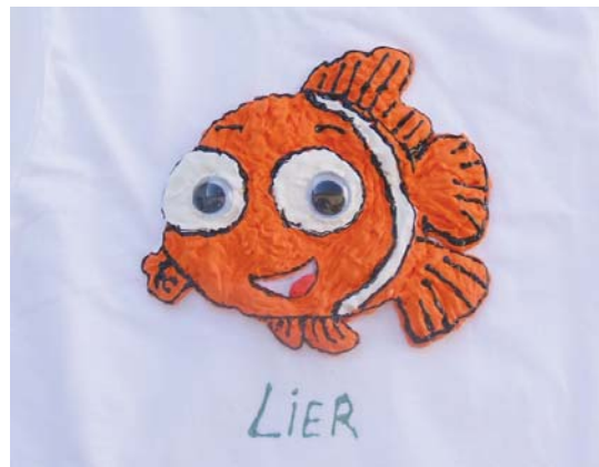
Kamisetetan 3D marrazkiak egiten irakatsiko da ikastaroko saioetako batean.

Ikastaro honetan kamisetak zure gustuko egingo dituzu apaingarriak jarritz, marrazki originalak eginaz... Bide batez etxean erabiliak eta baztertuta ditugun kamisetak eraldatzeko aukera izan daiteke, baita opari polit bat egiteko ere. •