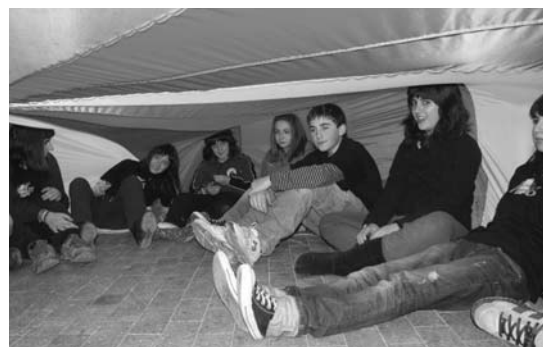
Elkar ezagutu dute Elgoibar eta Lasarte-Oriako gazteek.

Larunbatean argi geratu zen gazteek Hesian taldea gogoko dutela eta taldea ezagutzen dutela, kontzertuak iraun zuen bitartean ikusi zenez. Bukieran guztiak batera argazki bat atera zuten. •