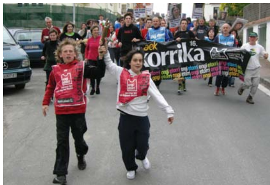
Donaixtikoko ikasle bat Korrikan, Landaberriko Gurasoen kilometroa osatzen.

Asteazkenean, Lasarte-Oriara bueltatu ziren Donaixtikoko 16 lagunekin batera. Eguerdian Zubietan izan