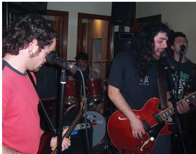
Makulu Ken taldeak Abend-en eta Desperviciok Sustrai-n eskaini zituzten emanaldietako irudiak. Bakoitzak bere aretoan giro bikaina jarri zuten.