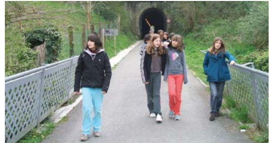
Denetarik egin dute Landaberriko eta Donaixtikoko ikastetxeeko neska mutilek. Bost egun pasa dituzte elkarrekin martxoaren