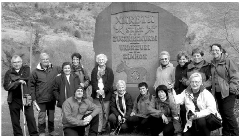
Egunpasa ederraz gozatzeko aukera izan zuten irteerara animatu zirenak.

Ondoren, Etxalarko herriari buelta bat eman zioten. Kalez kale bertako eraikuntza nagusiak ikusi zituzten, hala nola, Jasokunde eliza eta hila-rri guztiak, Udaletxea, kultur etxea edo pilotalekua. Garai