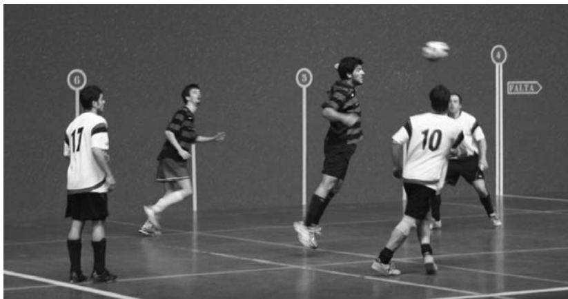
Urriaren hasi zen herriko areto futbol txapelketa azken faseetara iritsi da.

Hiru lehiaketa jokatu dira maiatzaren 23ra arte, play offak, ligila eta kontsolazioa. Eta lehenengo faseko sailkapenaren arabera taldeak honela banatu dira: