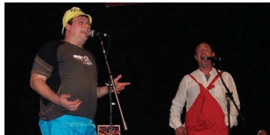
Mundua Konpontzeko Tailerrean edozor da posible: bertsok bi ahotsetan.