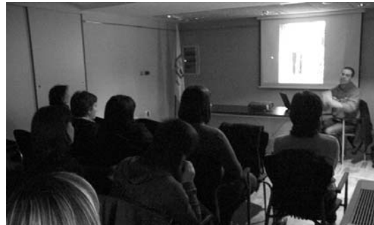
Udal Euskaltegiko ikasleek adi entzun zituzten munduen zaintzaileen istorioak.

Honela, hala nola, Leitzaranekeo haraneko eraikuntza hondakin guztiak aztertu dituen ingenieroa, testuak aztertu eta bere herrialdean traktorea eta