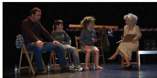
Aktoreak bat-batean agertu eta hainbat paperetan aritu ziren.