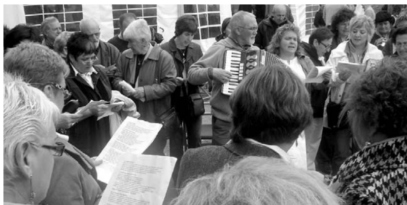
Irudian Xumela abesbatza Segurara joan zen egunean.

Ohi bezala, hitzaldiek Lasarte-Oriako Manuel Lekuona Kultur Etxeko hitzaldi aretoan izango dute leku eta, orduari dagokionez, arratsaldeko 18:00etan izango dira. •