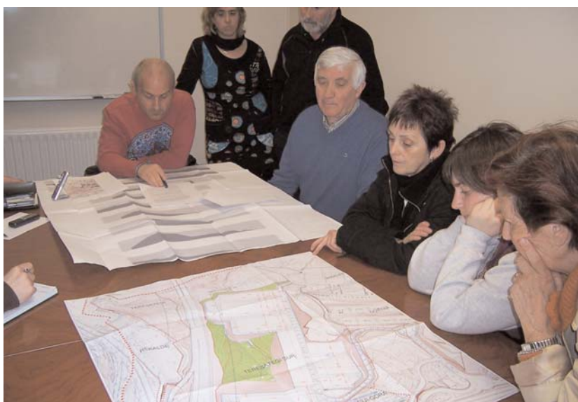
Ostiraleko bileran hainbat herritarrek Teresategiri buruzko bigarren txostenaren berri izan zuten.

Teresategin industrialdea jartzeko bigarren azterketa hau 2008. urtekoa da eta hainbat