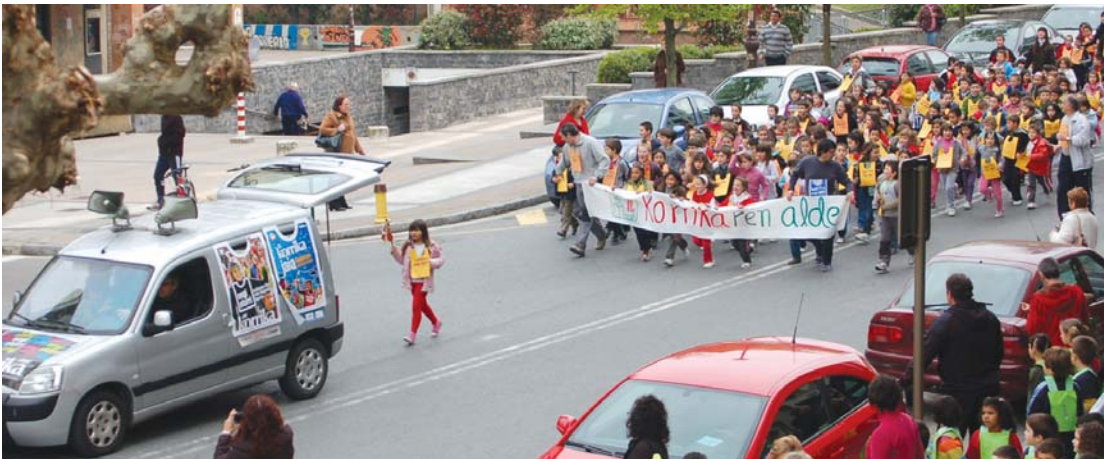
Landaberriko eta Sasoeta-Zumaburuko gaztetxoek herria dantzan eta korrika jarri zuten ostegun goizeko Korrika txikiari esker.

■ Lasarte-Oriako neska mutilak herriko kaleetan zehar ibili ziren ostegun goizean