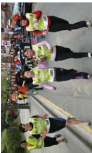
Ikastetxeetako lekukoa etorkinek eman zuten tarre bitan.