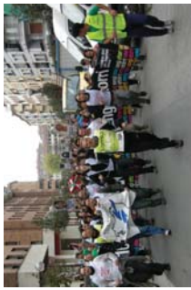
LAB sindikatuenko lagunek ere lekukoa eman zuten.