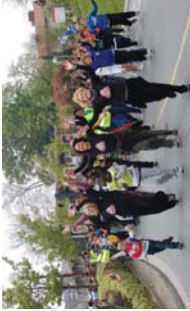
Prinbo, Porrotx eta Marimotosek ere dantza zuten Korrikan.