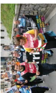
Takuneko begiraleek ere lekukoa eman zuten.