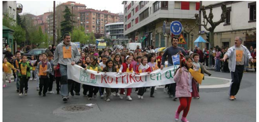
Lekukoa eraman zutenen artean, hainbat haur etorkin ikusi genituen aurtengo omenduei aipu egiten.

Eta korrika egin ondoren, esnekiak izan zituzten indarrak batu eta Amalur triki eskolaren erromerian parte hartzeko. Ttakuneko begiraleekin eta jauskailuarekin jolasean ere ikusi genituen haur batzuk. •