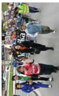
Lanberritako Guraso elkarrearen lekukoa gazteokoen esku.