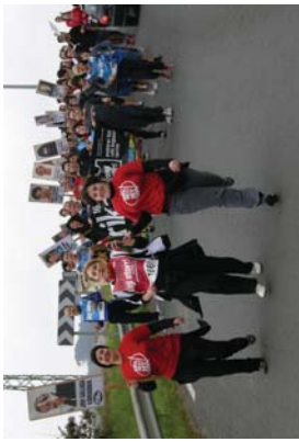
Elkei Abertzaleko lagunak arin-arin jaitsi zuten Kaxilarro ikastolako aldira.