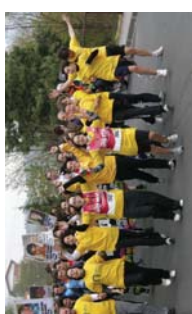
Tripontzi jangelako lagunak ekeki igo zuten Zubalicako aldira.