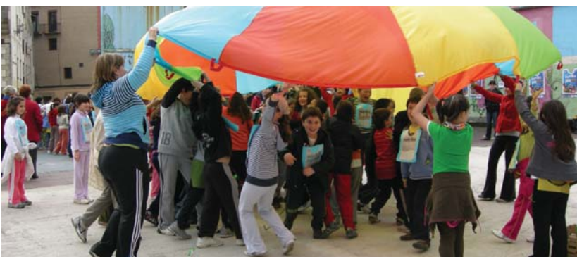
Korrika egin ostean, jolasteko gogoekin geratu ziren haur ugari eta jauskailuarekin izkutaketan jolastu ziren.