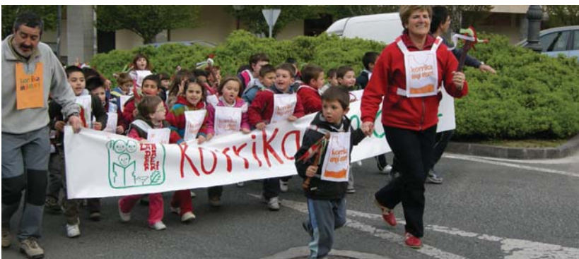
Nahiz eta aldapa gora egin behar, ttipi-ttapa Landaberriko txikiek bere txanda ederki burutu zuten.