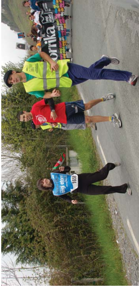
Sorgin Jaik Bazardeko gazteak izan ziren Lasarte-Oriako lehenengo lekukoa eman zutenak, hauek laguntzen Urnietan eta Lasarte-Oriako hogei bat lagun egon ziren.