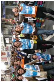
AEFko kideek haino eman zuten 16. Korrikako lekukoa.