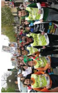
Byak bat ellarrerako lagunek Zubietarantz eman zuten lekukoa.