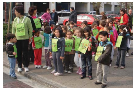
Zumaburu-Sasoetako txikiak prest Korrika txikiari hasiera emateko.