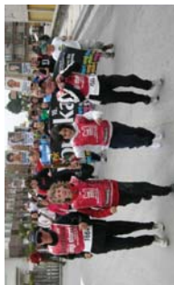
Elbarte gastronomikoetik adin gazteak korrikarak izan zituzten.