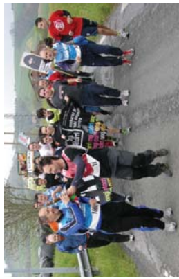
Elkeiz eta Otaó darrak bere kilometroa orngi banatuta zuten.