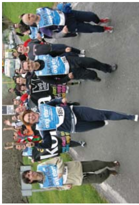
Udaleko zinegotzak ere parte hartu zuten lekukoa emanimaz.

Lekukoaren atzetik herritarrek egin zuen euskararen alde lasterka. Arratsaldeko 14:35ean iritsi zen garaiz eta erritmo onean burutu ziren Lasarte-Oriako 8 kilometroak