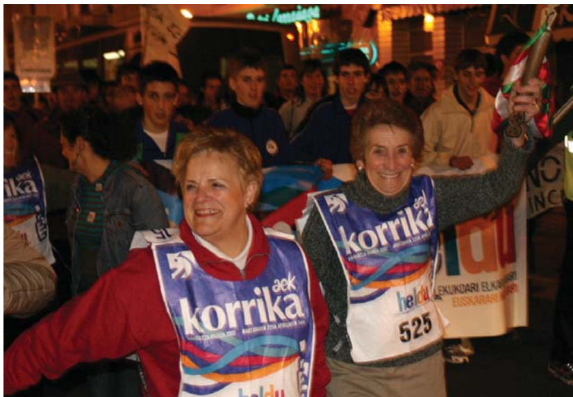
Duela bi urte, adin guztietako herritarrek eraman zuten lekukoa. Guztiak ikusiko ditugu aurkezpen ekitaldiko bideoan.