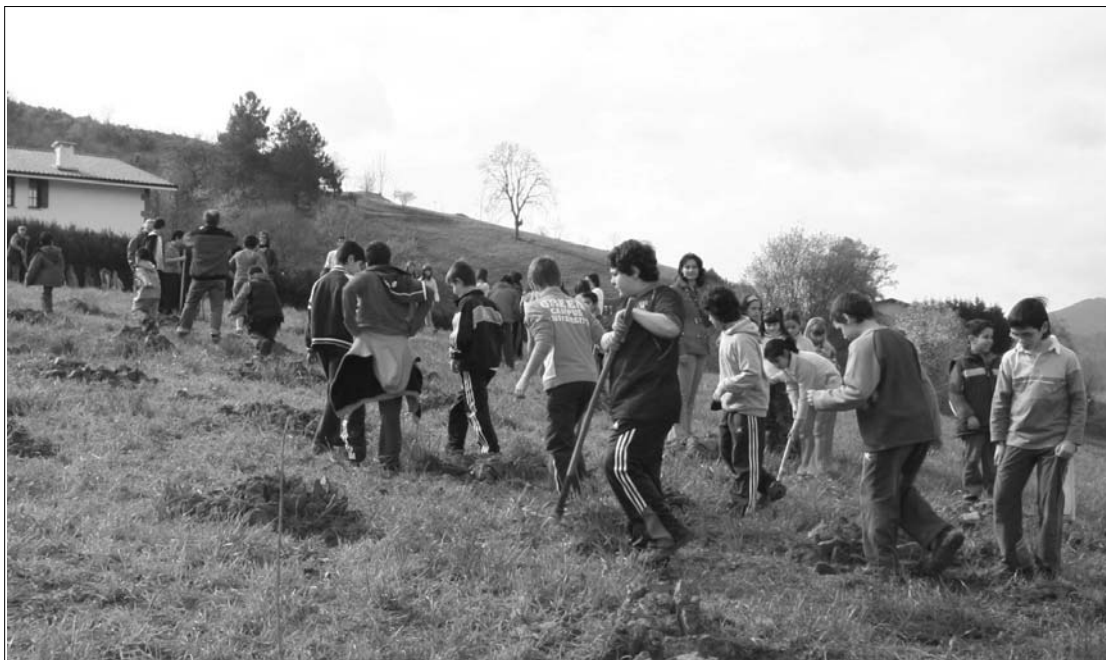
lazko Zuhaitzaren egunean ikasleek 75 zuhaitz landatu zituzten; lizarrak eta haritzak.

Garbiketa zerbitzuak bere baitan hartzen ditu kiroldegia, Michelingo kirolgunea eta trinketea, eta zazpi laguneko ekipoak eramango du aurrera. •