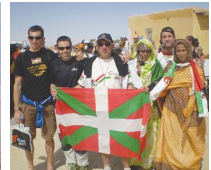
Euskaldunetarik batzu, Saharako bi emakumerekin.

Horrenbestez, haien haiman joan-etorria etengabea zela esan du Arrutik, edozein ordutan: "Lotara joan arte ez dakizu oraindik zein etorri-