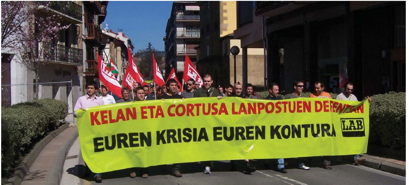
LAB sindikatuak deituta, hainbat herritarrek Lasarte-Oriako Kelan Elektronika eta Andoaingo Cortusa enpresen Lan Erregulazio proposamenak salatu zituzten ostirala eguerdian.

Lasarte-Oriako Kelan Elektronika S.A. enpresak aurkeztutako enplegu-erregulazio espedienteari baiezkua eman zion Lan Delegaritzak eta urriaren 1a geroztik, hasi ziren laneko egoera berriarekin, aste barruko