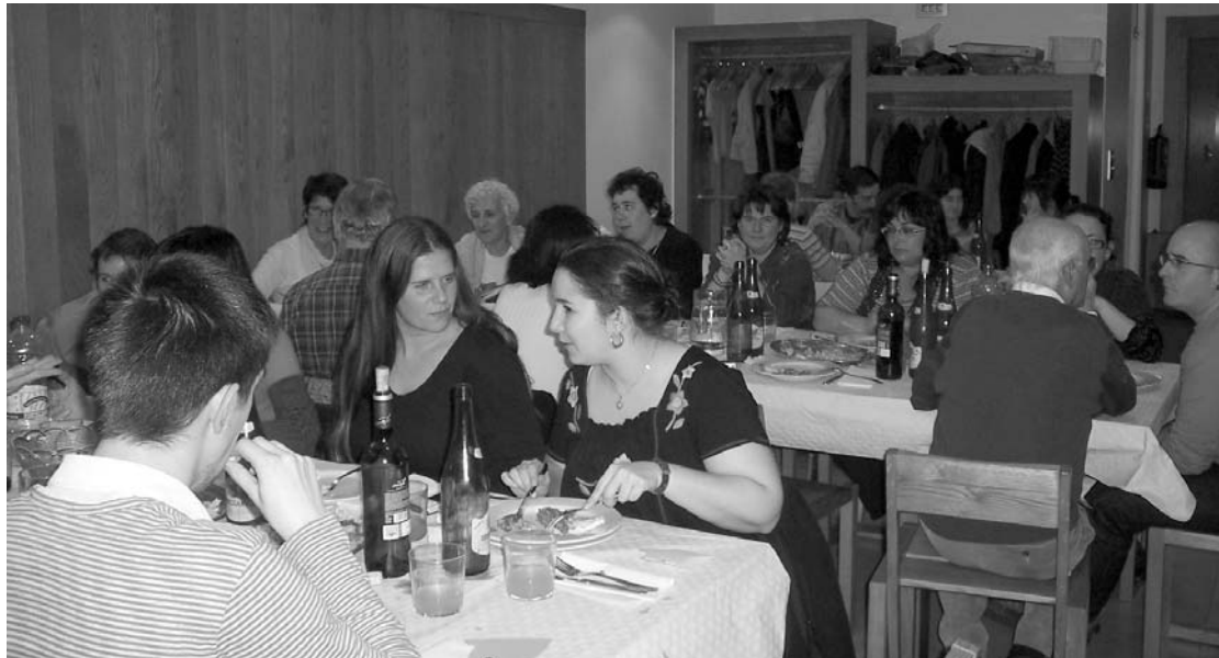
Jokuen bidez ezarri zioten solaskide bakoitzari eseri behar zuen lekua. Eta bigarren platera beste toki batean jan zuten: jokua eta solasa izan ziren nagusi afarian.