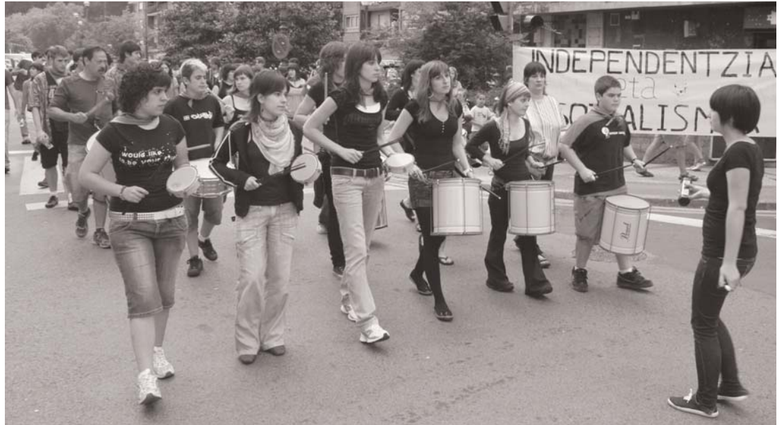
Iaz batukada ikastaroan parte hartu zutenek giro bikaina jarri zuten sanpedrotan. Aurten ere jaietan kalejiran ateratzeko erritmoak prestatzeko asmoa dute.

Perkusio tresna ezberdinak jotzean ateratzen diren soinuak eta doinuak dira batukadaren oinarria. Kalejiran, danbor, bonbo, atabal, tan-tan edo beste edozein perkusio tresnak jo eta erritmo bizian dantzan egiten dute. Iazko San Pedrotan herritarrek ikusi eta gozatu ahal izan zuten herriko batukarien goxotasun eta erritmo-etaz. Aurten ere ostiralero elkartuko dira Ttakunek bultzatutako taldekoak euren burrunba partikularra prestatzeko.