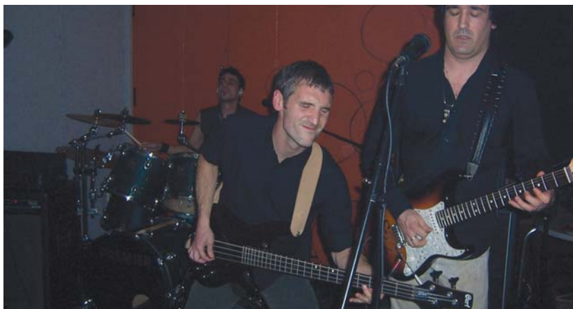
Belceblues taldekoak blues-a euskaraz egin daitekeela erakutsi zuten. Infer diskoa aurkeztu zuen Bergarako hirukoteak.