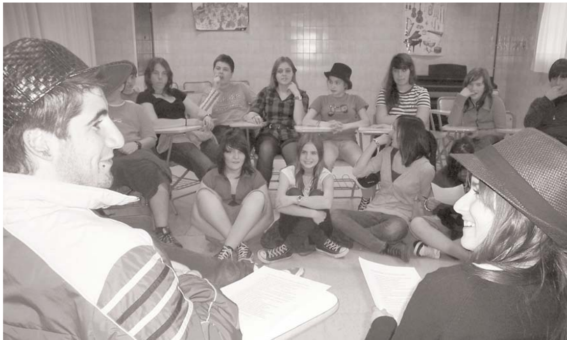
Go!azeneko aktoreek herriko gaztetxoekin jakin minari erantzun zioten. Elkarrizketa Irakutrezin-en hurrengo alean argitaratuko da.

Ondoren hainbat galdera egin zizkieten 12-15 urte bitarteko ikasleek. Argi eta garbi ikusi zen gaztetxoek filma ikusita dutela, filmari eta aktoreei buruz ondo informata daudela, baina, jakinmin handia zuten eta denetariko galderak luzatu zizkieten bi bisitarietara: Go!azen pelikularen casting eta grabaketari buruzkoak, filmean abestutako kantuei buruzkoak, euren bizitza pertsonalari buruzkoak edota, besteak beste, etorkizunerako dituzten asmoei buruzkoak. Bi aktoreek aurreratu zuten telebistan serie bat grabatzeko proposamena jaso dute eta beraz, "Asier", "Desi" eta filmeko beste protagonistek jarraipena izango dute telebistan.