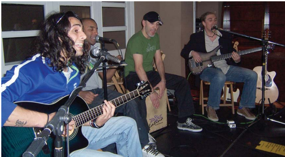
The Billy Jeans taldekoen kontzertua berezia izan zen kultur etxeko lehen solairuan ostiral arratsaldean. Lehenengo aldiz emanaldi akustikoa eskaini zuten.