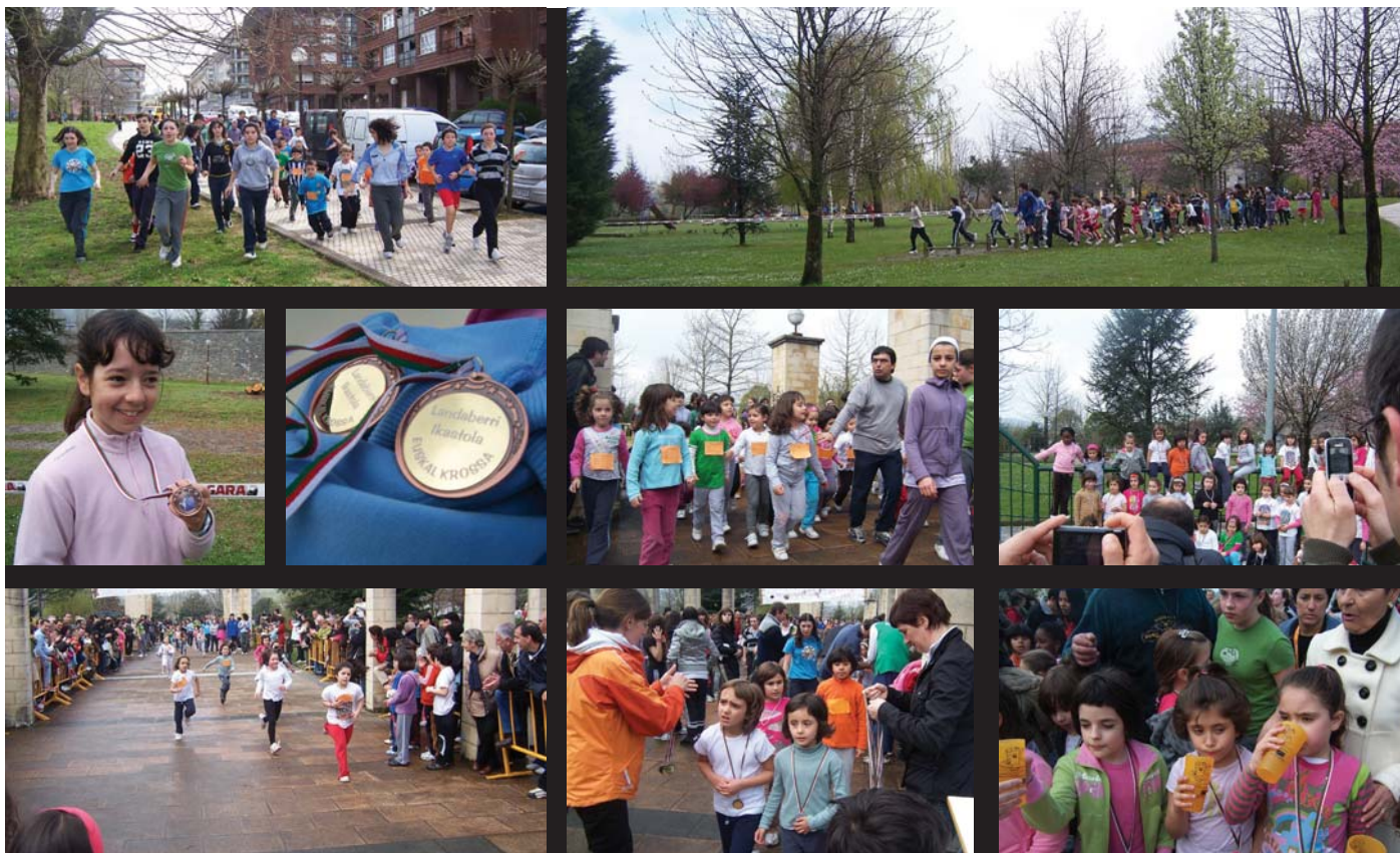
Neska-mutil gehienek lepotik zintzilik eraman zuten etxera Atsobakarren zehar lasterka egin eta gero jasotako domina. Ur botilarik ez zen banatu, hondakin gutxiago sortzeagatik.