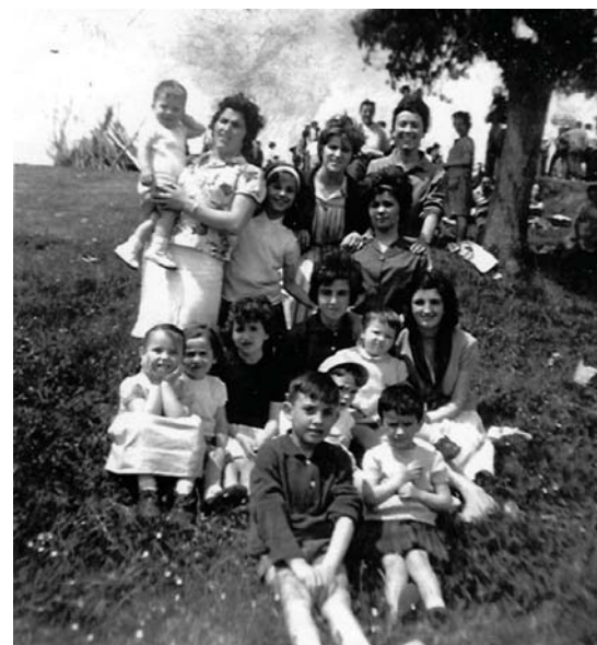
Haur talde bat Azkorteako Santa Kruz festetan ateratako argazkian.