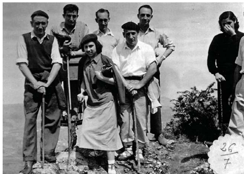
1947an mendizale talde bati Buruntzan ateratako argazkia. Antzeko hainbat argazki daude liburuan.