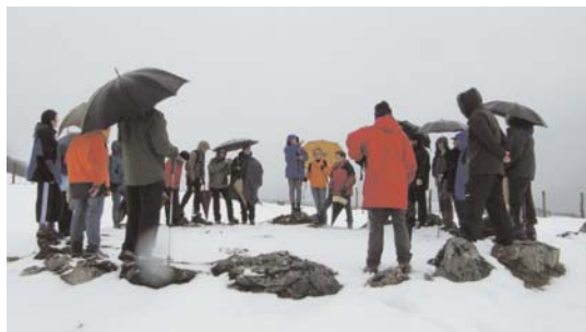
Oinatz taldeak Arotz, Markina eta Arano aldera egin zituen aurreko irteerak.

Hala ere, honek ez dio batera kendu antzinako xarma. XVIII. mendekoak diren ola, irinerrota, sagardoa egiteko lantoki edota zenbait zurgindegi mantendu dira. Hauek herritarrentzako lan toki izan dira eta hala nabarmetzen da bertako eraikin dotore anitzetan.