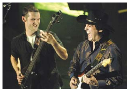
Biliyin doinuak entzuteko aukera egongo da kultur etxeke kafetegian eta Belceblues ek Infer diskoa aurkeztuko du Jalgin