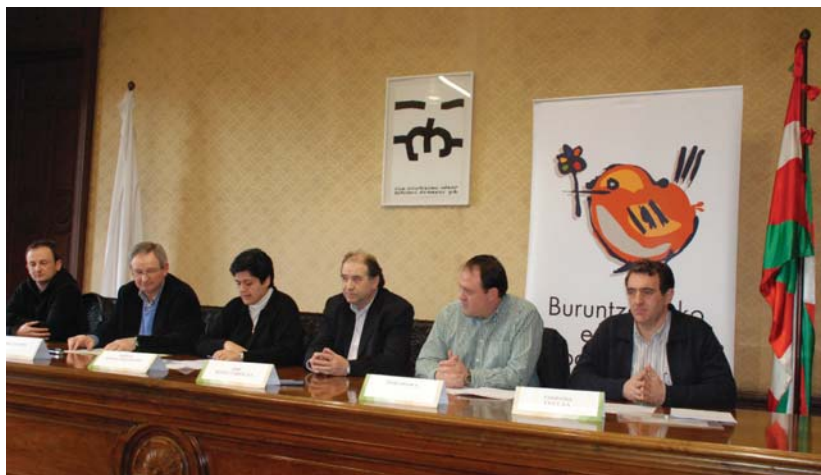
Hernani, Urnieta eta Lasarte-Oriako hitzarmenak sinatu ziren astelehenean Hernaniko Udaletxean.