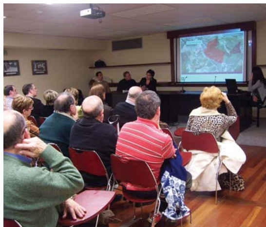
Kultur etxean aurkezpena egiteaz gain, martxoaren 27ra arte, Udalak liburutegiko sarreran ordenagailuak ezarri ditu herriarrek maketa ikus dezaten .